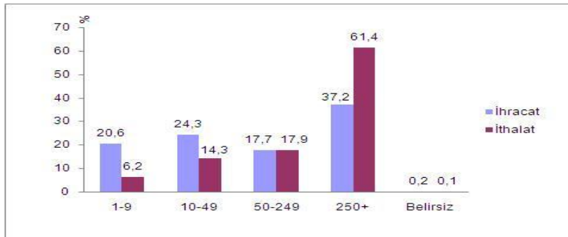
Tablo 4: Çalışan Sayısına Göre 2012 Dış Ticaret Rakamları (%)

TÜİK tarafından açıklanan istatistiksel verilere göre, Türkiye'de 2012 yılında gerçekleşen ihracatın % 62,6'sını ve ithalatın ise % 38,5'ini KOBİ'ler gerçekleştirerek ekonomideki paylarını ve ekonomiye olan katkılarını büyümeye devam etmektedirler (TÜİK, 2013). Ayrıca aşağıdaki tabloda da görüldüğü üzere 2012 yılı ithalat ve ihracat rakamlarında 250 ve daha az işçi çalıştıran girişimlerin (KOBİ'ler) ulusal istihdama olan katkılarının da büyük öneme sahip olduğu görülmektedir.