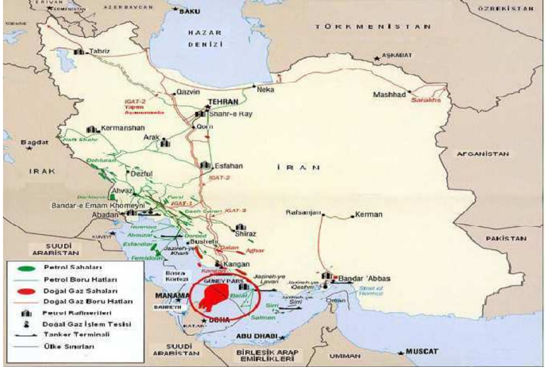
Harita 2: İran Doğalgaz ve Petrol Sahaları