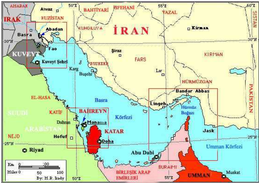
Harita 1: Basra Körfezi