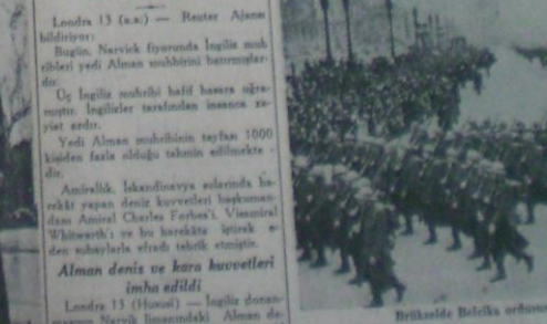
Britanide Balıca orduunu

Alman deniz ve kara kuvvetleri imha edildi Londra 13 (Haber) — İngiliz donanması Narvik limanındaki Alman deniz kuvvetlerini imha etti.