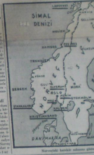
Norveçteki hareket salınışı gösterir