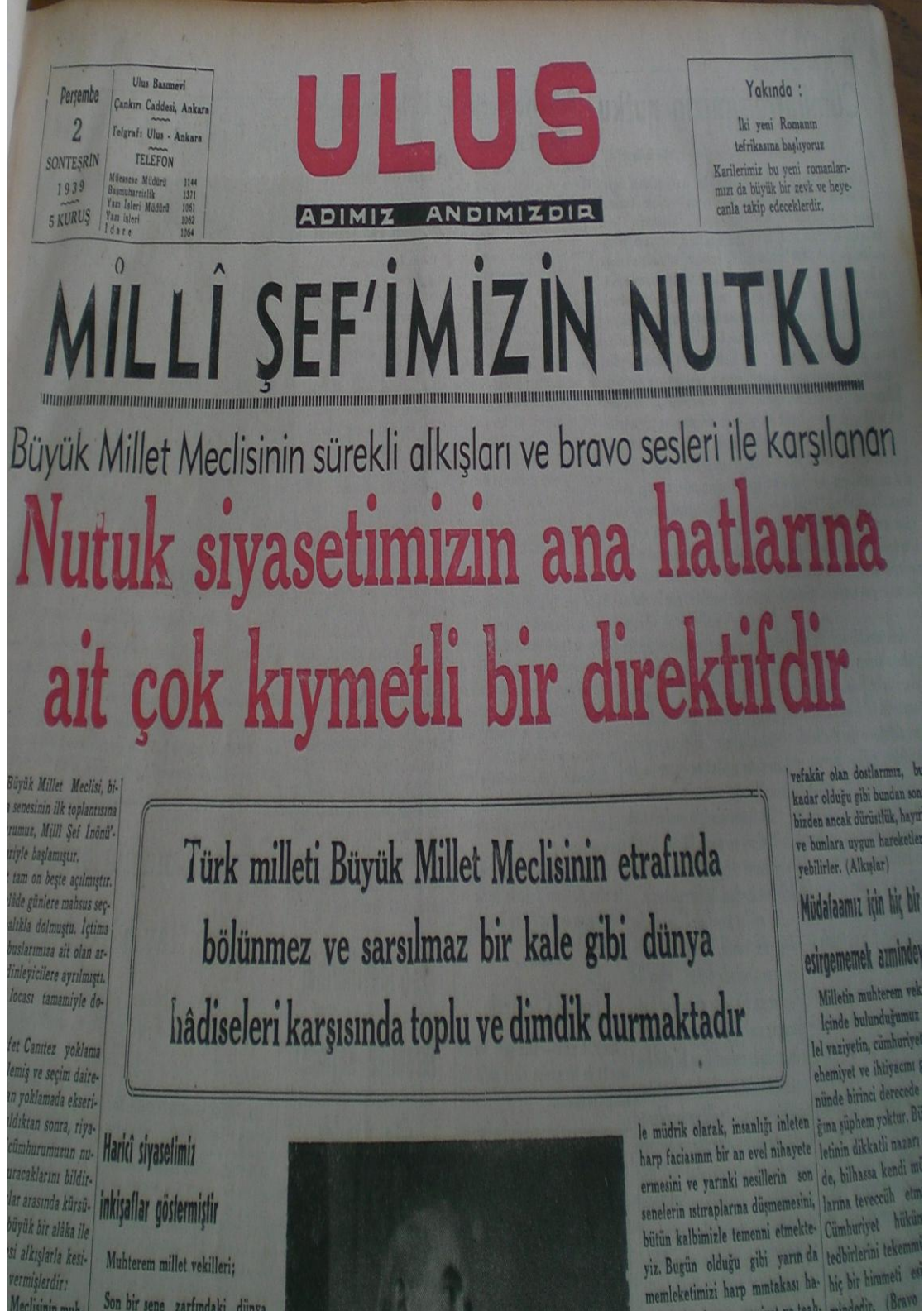
Resim 5. Ulus Gazetesi (2 Kasım 1939)