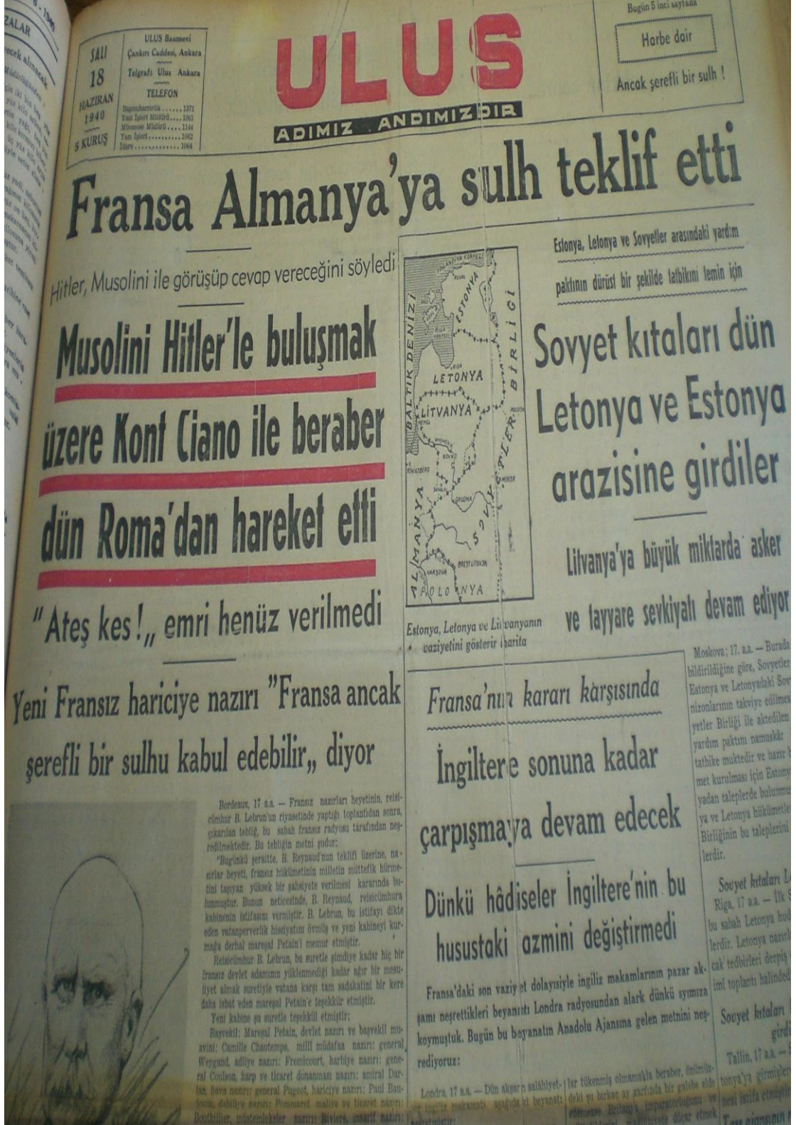
Resim 15. Ulus Gazetesi (18 Haziran 1940)