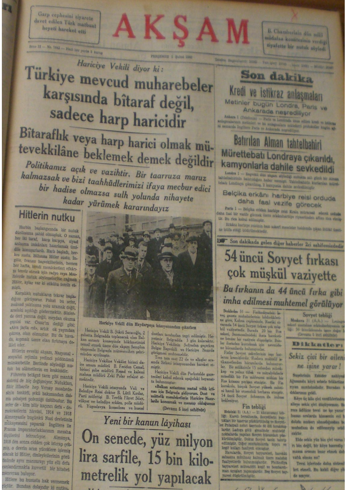
Resim 6. Akşam Gazetesi (1 Şubat 1940)