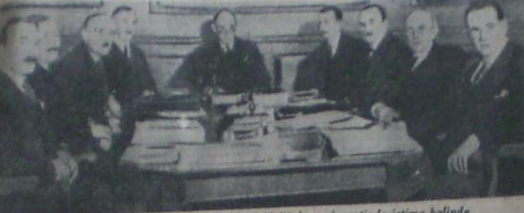
İngilizlerin Balkan sefirleri Londrada Lord Halifaxın riyesetinde içtima halinde

Almanyanın Macar hududunda tahşidat yaptığı söyleniyor