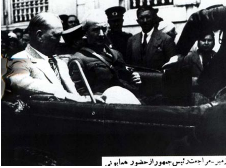
Resim 1.4. İsmet Paşa ile İzmir'den Ankara'ya dönüşü (1926)