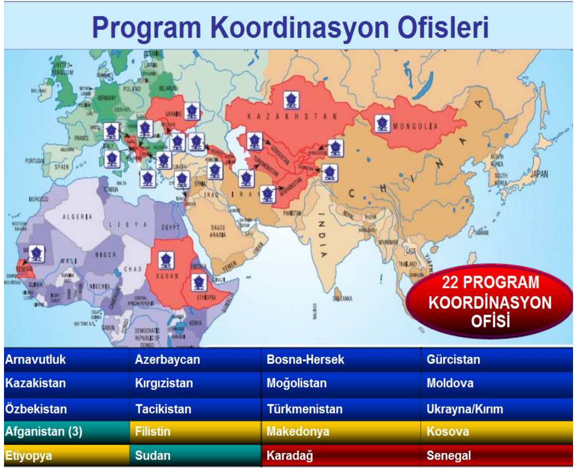
Şekil 2. TİKA Program Koordinasyon Ofisi Bulunan Ülkeler