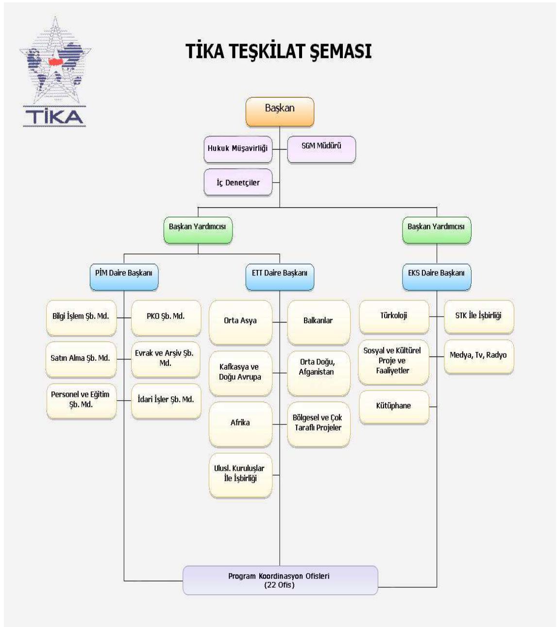
Şekil 1. TİKA Teşkilat Şeması

özlük hakları, idari işlemleri ve kuruluşun mali bütçe yönetiminden sorumludur. PİM Dairesi Başkanlığının bünyesinde Bilgi İşlem Şube Müdürlüğü, Satınalma Şube Müdürlüğü, Personel ve Eğitim Şube Müdürlüğü, PKO Şube Müdürlüğü, Evrak ve Arşiv Şube Müdürlüğü, İdari Şube Müdürlüğü bulunmaktadır.