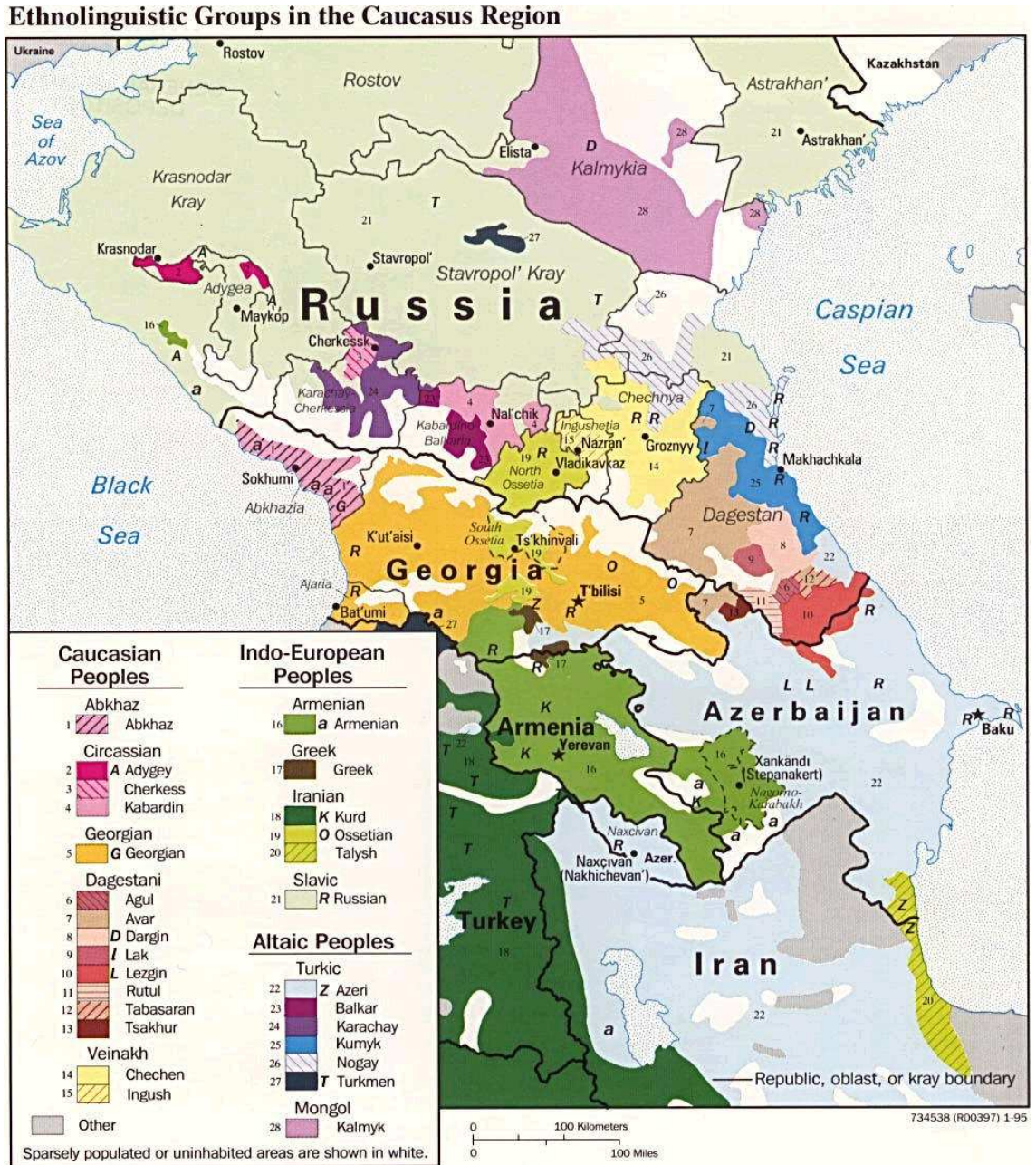
Şekil 4: Kafkasya'da Konuşulan Diller ve Kafkas Halkları