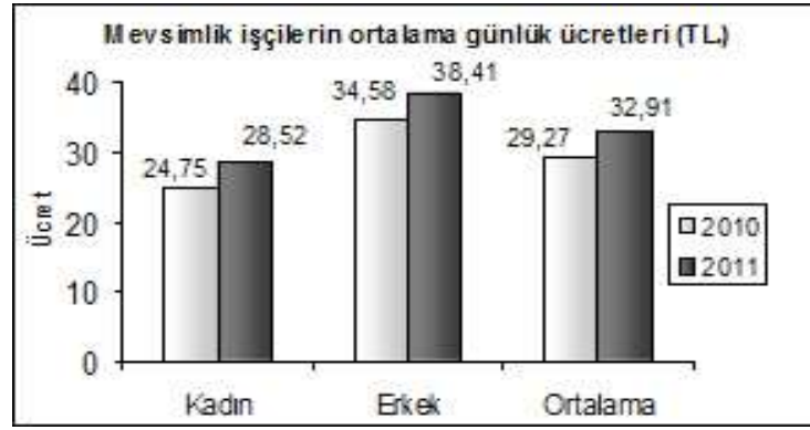
Grafik 1: Tarımsal İşletmelerde Ücret Yapısı, 2011

TÜİK'in yaptığı 2011 Tarımsal İşletmeler (Hanehalkı) Ücret Yapısı Araştırması sonucuna göre, hanehalkı tarım işletmelerinde 2011 yılında mevsimlik tarım işçilerinin ortalama günlük ücretleri 2010 yılına göre %12,44 oranında artarak 32,91 TL., sürekli tarım işçilerinin ortalama aylık ücretleri ise %10,75 oranında artarak 978,97 TL olarak gerçekleşmiştir.