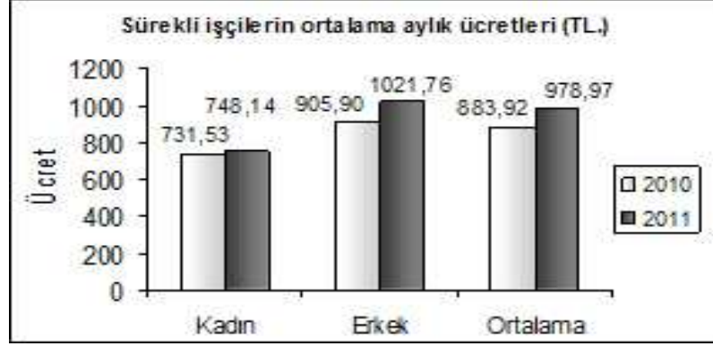
Grafik 2 : Tarımsal İşletmelerde Ücret Yapısı, 2011