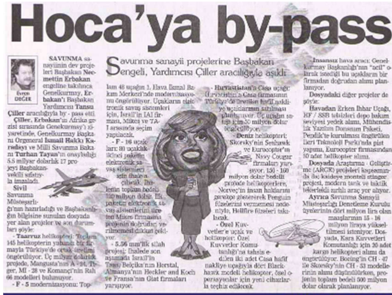
Resim 3: Milliyet Gazetesi'nin 'Hoca'ya by-pass' başlıklı haberi. 327

perspektifi dahilinde hareket etmeye zorlandığını göstermektedir. Öte yandan söz konusu anlaşma “iki ülke arasında savunma alanında işbirliği yapılmasına ilişkin iyi niyeti ve temenniyi” içeren ve herhangi bir icrai yönü olmayan standart bir çerçeve anlaşması olmasına rağmen, bizzat medya tarafından fazlasıyla abartılmış ve söz konusu haber gelecek projelerin müjdeleri ile birlikte sunulmuştur. 326