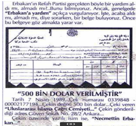
Resim 1: Refah Partisi’nin Uluslararası İslama Çağrı Cemiyeti’nden aldığı iddia edilen yardımın yazılı olduğu çek 280

Kemalist bloğun RP’yi itibarsızlaştırma noktasında dolaşıma soktuğu bir diğer söylem ise Erbakan’ın RP’sinin 7 Nisan 1989’da, Libya’nın “İslami devrimi yaygınlaştırma amacıyla kurduğu” 277 Uluslararası İslama Çağrı Cemiyeti’nden 500 bin dolarlık yardım aldığı konusu olmuştur. 278 Milliyet Gazetesi’nde belgelenecek sunulan bu iddiaya göre Libya, Uluslararası İslam’a Çağrı Cemiyeti üzerinden İslami bloğun siyasal alandaki temsilcisi konumundaki RP’ye finansal destek sağlıyor ve bu yolla Türkiye’deki ‘irticai’ faaliyetleri destekliyordu. Bu doğrultuda gezinin ardından konu ile ilgili açıklama yapan CHP Genel Başkanı Deniz Baykal, bu durumu RP’yi ve onun dış politikasını itibarsızlaştırmak için devreye sokmuş ve “Başbakan Necmettin Erbakan’ın, Libya lideri Muammer Kaddafi’nin Türkiye’ye yönelik hakaretleri karşısındaki suskunluğunun” Libya ve RP arasındaki bu finansal ilişki ile ilgili olduğu yorumunda bulunmuştur. 279