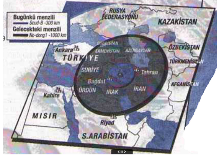
Resim 4: İran'ın füze menzili 346

Sonuç olarak ifade etmek gerekirse, bu dönemde “asker sadece siyasete ve siyasetçiye müdahale etmekle yetinmemekte bizzat siyaset yapmakta ve üretmektedir. Bunu da siyasi meseleleri devlet tekeline alarak, siyaset dışı ilan ederek ve millileştirerek gerçekleştirmektedir.” Nitekim dış politikanın güvenlik perspektifinden ele alınması “sorunlar ve çözümleri, devletçiliğin tanımladığı muğlak bir ‘milli çıkarlar’ mantığına” 347 indirgemekte ve bu durum ‘devleti’ temsil eden ve ‘devlet politikalarının’ nihai koruyucusu olarak görülen TSK’nın bir dış politika aktörü olarak devreye girmesini meşrulaştırmakta ve normalleştirmektedir. “Buradan hareketle Türkiye-İsrail ilişkilerinde askerin büyük ölçüde dominant olduğu ve dış politikada böylesine ayrıcalıklı pozisyonda bulunmasının da iktidar ilişkileri bağlamında bakıldığında 1990’lar boyunca orduyu sivil siyaset karşısında ayrıcalıklı bir pozisyona taşıdığı söylenebilir.” 348 Bu açıdan iktidarda İsrail karşıtı politikalarıyla öne çıkan ve hatta mevcut anlaşmaları feshedeceğini söyleyen bir hükümetin varlığına rağmen, trajikomik bir şekilde Türkiye ve İsrail’in “en önemli askeri işbirliği anlaşmalarını, İslamcı başbakanın MGK baskısıyla istifa ettiği Haziran 1997’de sona eren Erbakan döneminde” imzalamış olması şaşırtıcı değildir. 349 Dolayısıyla konumuz açısından bakıldığında Türkiye-İsrail ilişkileri, “ordunun içeride işleyişte olan iktidar ilişkilerinde