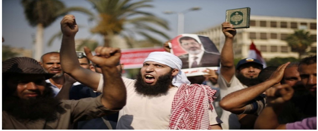
Resim 3: Görevden alınmış olan Mısır Cumhurbaşkanı Muhammed Mursi'nin destekçileri Cumartesi günü Kahire Üniversitesinde yaptıkları protesto boyunca slogan attı. 286

haberlerle beraber kullanılan resimlere de bir ayrıcalık yüklemektedir. Zira resimler ideolojik yaklaşımın renklendirilmiş bir görüntüsü olup, “anlam”ı açık bir şekilde değil, fakat öneri ve ima yoluyla bilgi ve bilinçaltı arasında bir sürece gönderme yaparak sunan araçlardır. 285 Böylelikle Şarkiyatçı söylemde tutarlılığın pekişmesinde anlamı biçimselleştiren ve sunduğu biçimlerle Şark dünyası hakkındaki bilgileri ve bilinçaltında oluşan şekilleri yeniden üreten resimlerin önemi bir kez daha ortaya çıkmaktadır. Bu çerçevede Şarkiyatçı kurguda “fark”ın yeniden üretiminde çizilen imajların değerlendirilmesi bağlamında 3 Temmuz 2013 darbesinden sonra Wall Street Journal’da yayınlanan İhvan yanlılarını yansıtan kareler ile asker yanlısı bir çocuğun yer aldığı resim oldukça yol gösterici olacaktır.