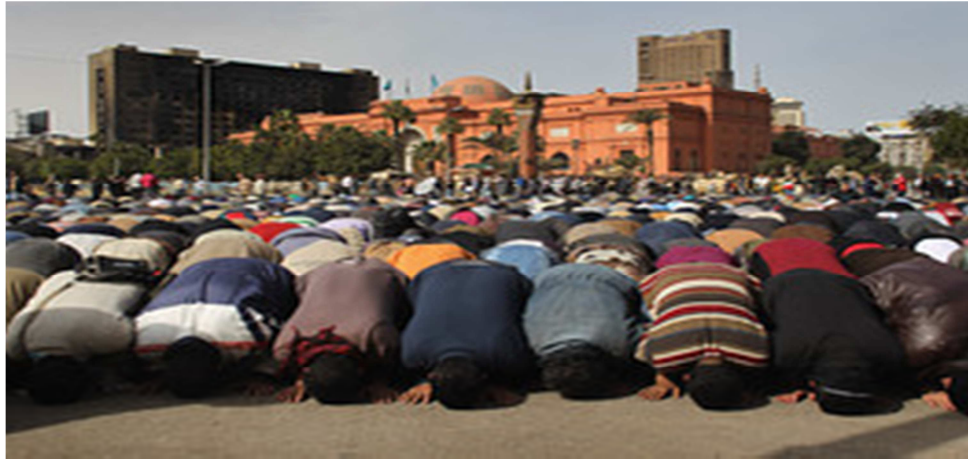
Resim 2: “Müslüman Kardeşler İktidara Gelirse Ne Yapacak?”, Wall Street Journal, 4 Şubat 2011

Müslüman Kardeşler’le alakalı en büyük soru ise seçimleri kaybetmeleri durumunda barışçıl bir şekilde yönetimden vazgeçip vazgeçmeyecekleri meselesidir. Çünkü MK demokrasi davasına yürekten inandığı için değil güç elde etmek için seçimlere katılmıştır.” 281