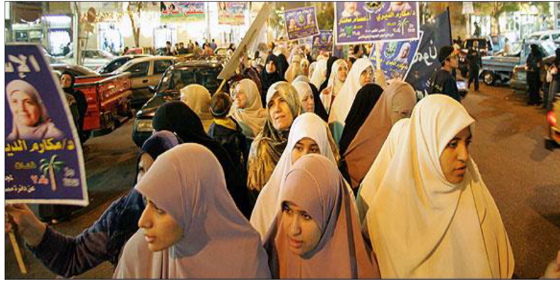
Resim 1: Müslüman Kardeşler’in Desteği ile Parlamentoda Kadınların Temsili için Yürüyen Kadınlar, New York Times, 9 Kasım 2005 280

Bu haberin ürettiği söylem ile bağlantılı olması açısından bu haberden bir ay önce, 9 Kasım 2005’te, yine Müslüman Kardeşler’in Mısır’da Eylül ayında gerçekleştirilen seçimlerde parlamentoda elde ettiği çoğunluğu konu edinen “Din Mısır’da Bir Güç Olarak Ortaya Çıkıyor” başlıklı yazıda şöyle bir resimle sunulmuştur: