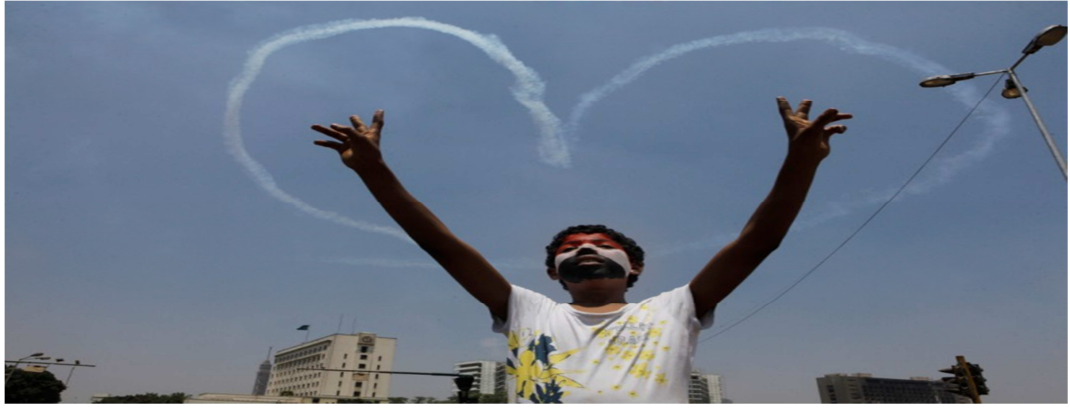
Resim 5: Askeri uçaklar Cuma günü Tahrir Alanında gökyüzüne kalp görüntüsü çizdi. 288

Mısır'da Mursi'nin asker tarafından görevden alınmasından sonra İhvan destekçilerinin protestolarını yansıtan resimler ile askerın kutlamasını yansıtan resmin Şarkiyatçı düşüncede kurgunun yeniden üretilmesi bağlamında değerlendirilmesi, bu resimlerin karşılaştırılmasıyla anlamlı olacaktır. Bu bağlamda ilk olarak ilk iki resim ile son resim arasındaki en önemli farkı ortaya koymak gerekirse, İhvan destekçilerinin yer aldığı resimlerde bir kalabalık yansıtılırken son resimde tek bir çocuğun resmedildiği söylenmelidir.