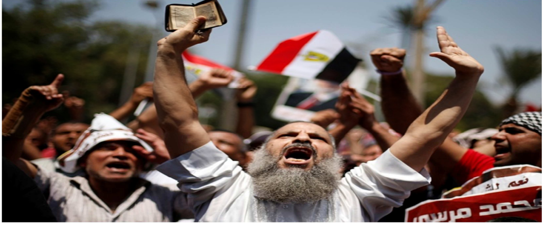
Resim 4: Mursi destekçileri Cuma namazından sonra Kahire Üniversitesi yakınlarında toplandı. 287