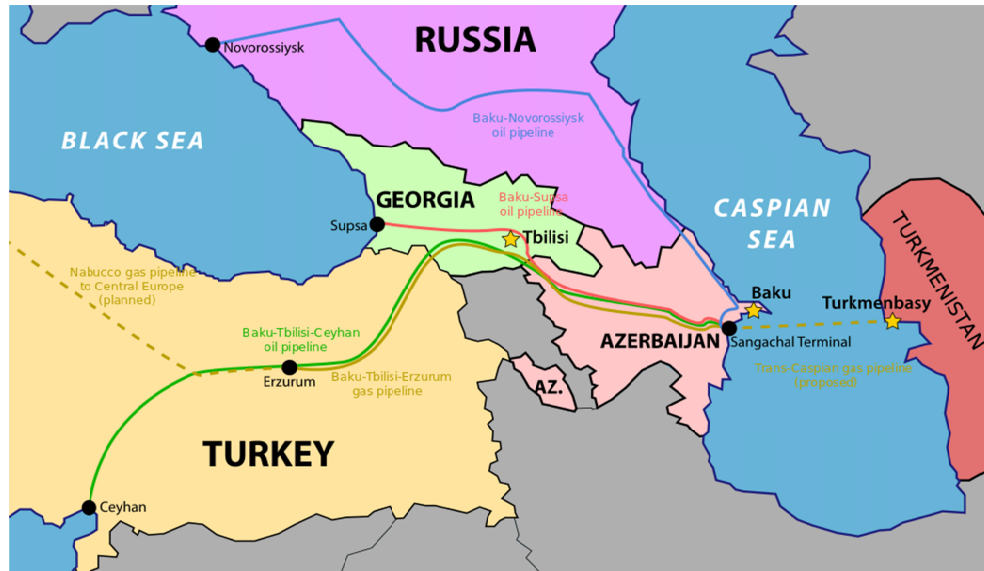
Şekil 2: Bakü-Tiflis Ceyhan Petrol Boru Hattı Projesi Güzergahı