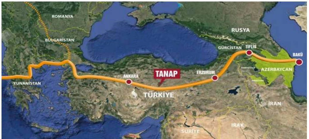
Şekil 3: TANAP Projesinin Geçiş Güzergahı