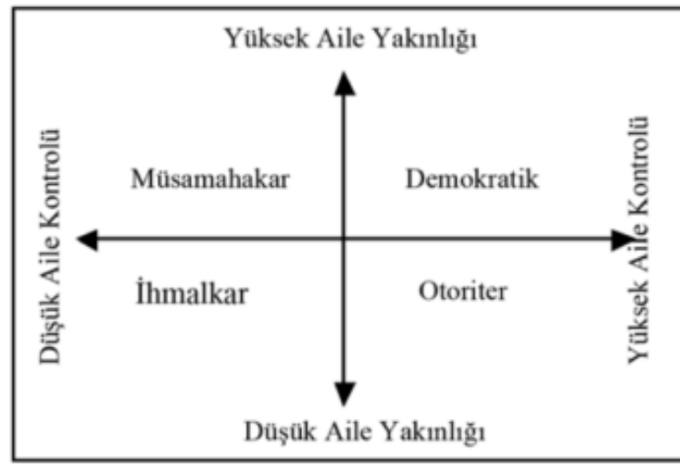
Şekil 2. Aile Stilleri

Şekil 1’ de internet aile kontrolü ve internet aile yakınlığı boyutlarına göre aile stilleri gösterilmiştir.