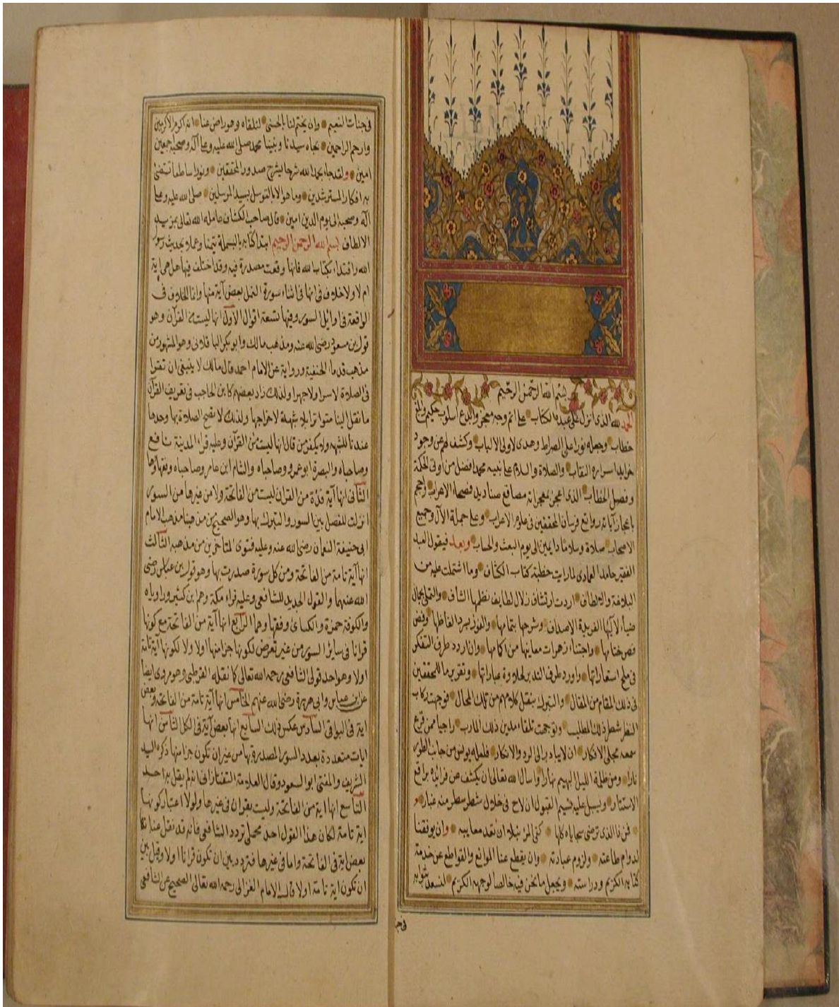
نسخة مكتبة يوسف آغا (أ) اللوحة الأولى، رقم المخطوط: 393