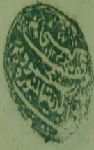
نسخة المكتبة المحمودية (م) اللوحة الأولى، رقم المخطوط: 2670 (خ)

وبعد فيقول العبد الفقير حامد المهادي ما رأيت خطبة كتاب الكشاف وما استمعت عليه من البلاغة والالطاف اردت ان يشاق زلال لطايق نظمها الشاق والتعليل بحمال صبا لا يلبها الفريفة الاصداف وشرحها بتمامها والفوز بسرد الفاظها وفض فص حنأها واجتناد زهرات معانيها من اكمامها وان ارد طرف التفر في ملح استعاراتها واورد طرف التدبير لحلاوة عباراتها وتفرير ما للمحققين في ذلك العالم من المقال والتركيب نقل كلامهم من تلك المجال وتوجهت ركاب النظر سطر ذلك المطيب وتوجهت لتفادي من ذلك الماراب را حيا من فرغ سمع مجمل الافكار ان لا يبادر بالرد والافكار فلهذا يونس من جانب الطور نار ومن ظلمة الليل البهيم نهارا واسأل الله تعالى ان يكتف عن فرايد برافع الاستنار ويسبل عليه نسيم القبول ان لاج في خلال سطر من عبارات فمن ذا الذي ترصن سبحانها كلها كفى المرزوبلان تود معايبه وان يوفنا الدوام طاعة ولزوم عبادة وان يقطع عنك الموانع والمواعظ عن خدمة كتابه الكريم ودراسة ويجعل ما نحن فيه خالصا لوجه الكريم لسعد شوايد في جنات النعيم وان يحكم لنا بالحسن النلقاه وهو راض عنا انه اكرم الاكرمين وارحم الراحمين اجماع سيدنا ونبينا محمد صلى الله وسلم عليه وعلى آله وصحبه اجمعين امين ولقد جاء محمد الله شرا سترج صدور المحققين ونور اساطعنا تستضيء به افكار السرفنديين