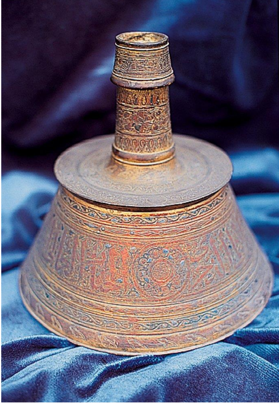
Ek 11: 15. Yüzyıla Ait Memlük Pirinç Şamdanı (Türk İnşaat Eserleri Müzesi, Envanter Nr. 232)