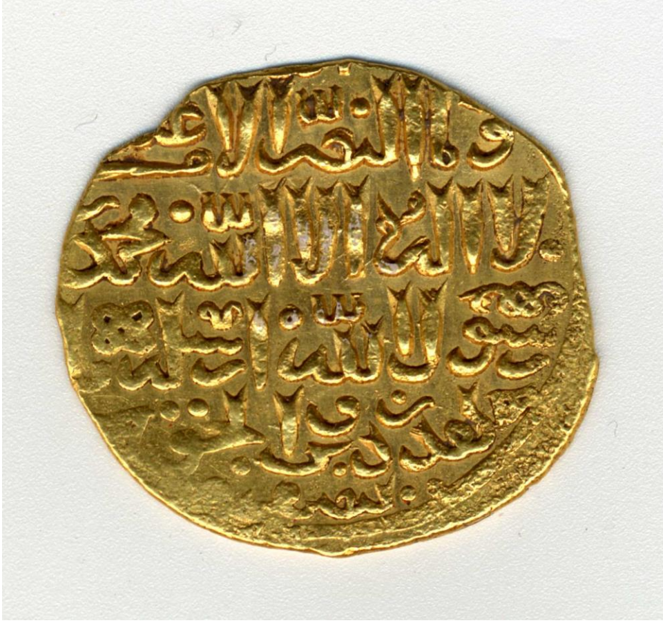
Ek 6: Memlükler Dönemine Atfedilen 740/1340 Yılına Ait Altın Dinar