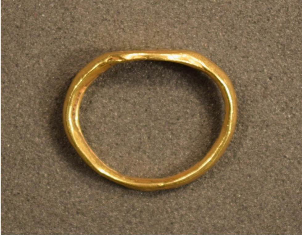
Ek 10: Memlükler Dönemine Atfedilen Altın Bir Yüzük (14.yy-15.yy)