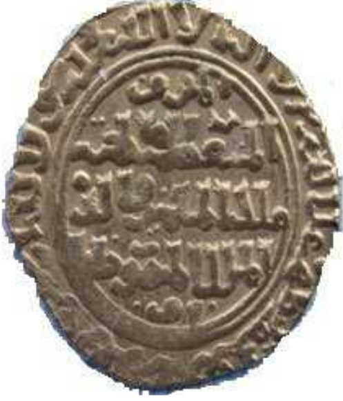
Ek 3: Şecerüddür'ün Bastırdığı Dinarın Ön ve Arka Yüzü