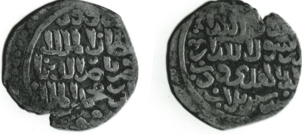
Ek 5: el-Melikü'n-Nâsır Muhammed b. Kalavun Devrine Ait Gümüş Para