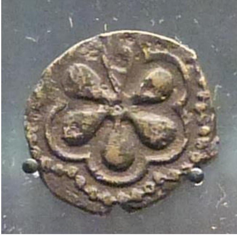
Ek 8: el-Melikü'n-Nâsır Muhammed B. Kalavun Devrine Ait Bakır Para