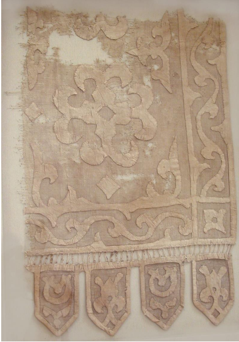
Ek 14: Memlükler Dönemine Atfedilen Bir Kumaş Parçası (13.yy-14.yy)