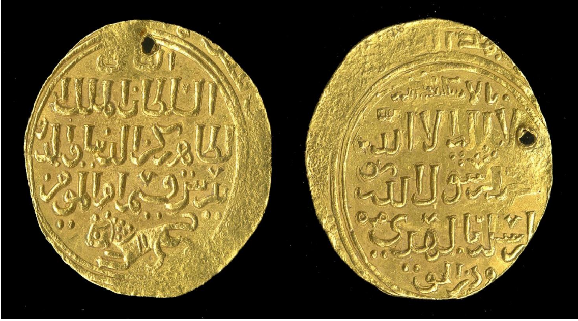
Ek 4: el-Melikü'z-Zâhir Baybars Dönemine Ait Altın Para