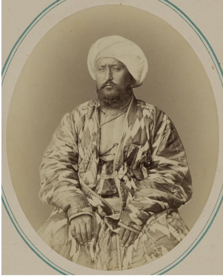
Ek 1: Hüdayar Han

Kaynak: https://www.loc.gov/pictures/phpdata/pageturner.php?type=&agg=ppmsca&item=09951&seq=32 Erişim Tarihi: 15.08.2023