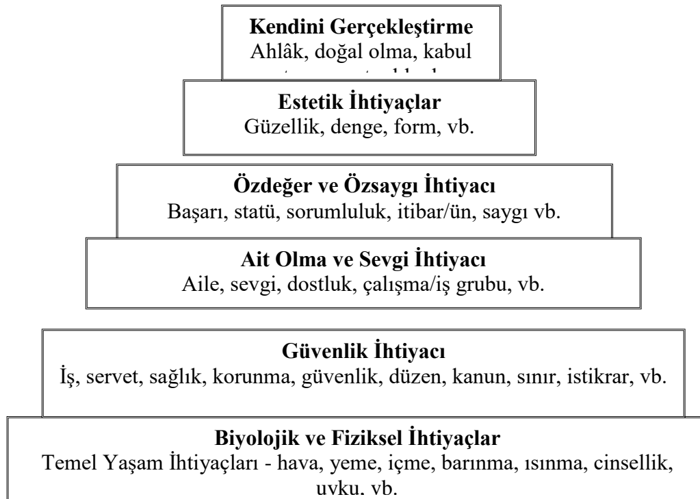
Şekil 2. Maslow'un 7 basamaklı ihtiyaçlar hiyerarşisi

Maslow'un ihtiyaçlar hiyerarşisi daha sonra tekrar gözden geçirilip söz konusu hiyerarşinin basamak sayısının yedi olması gerektiği öne sürülmüştür (İnceoğlu, 2004, s. 112). Maslow'un kuramına bilme-anlama ve estetik basamakları eklenmiştir.