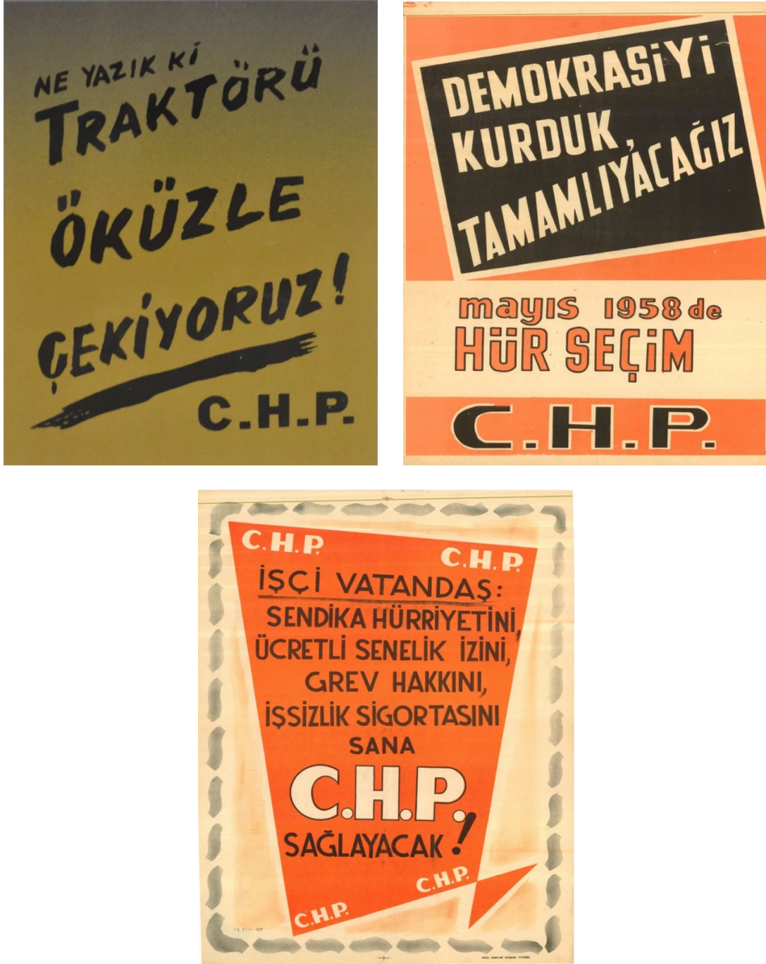
Resim 3: CHP'nin Seçim Kampanyasında Kullandığı Afişlerinden Üçü

Kaynak: A. Ergin'in "Türkiye'de 1954 ve 1957 Genel Seçimlerinde Siyasi Afiş ve Slogan Kullanımı (DP-CHP Örneği)" isimli çalışması