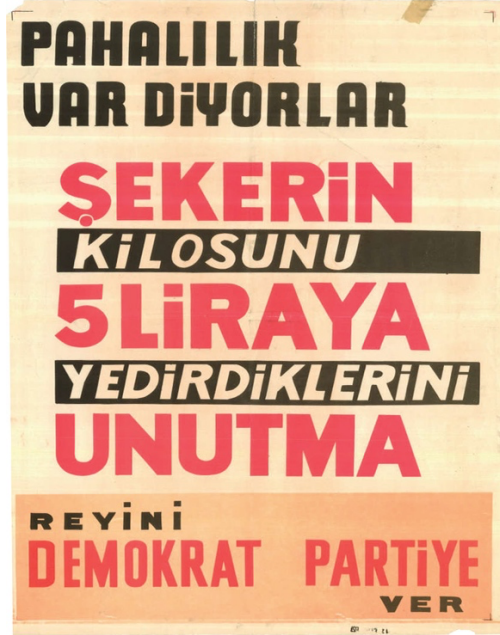
Resim 2: DP'nin Seçim Kampanyasında Kullandığı Afişlerden Üçü