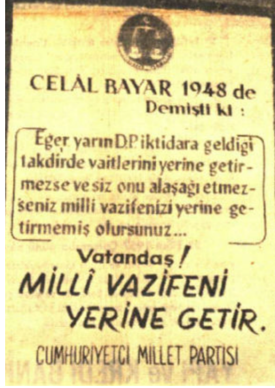
Resim 4: CMP'nin Seçim Kampanyasında Kullandığı Bir Afiş: