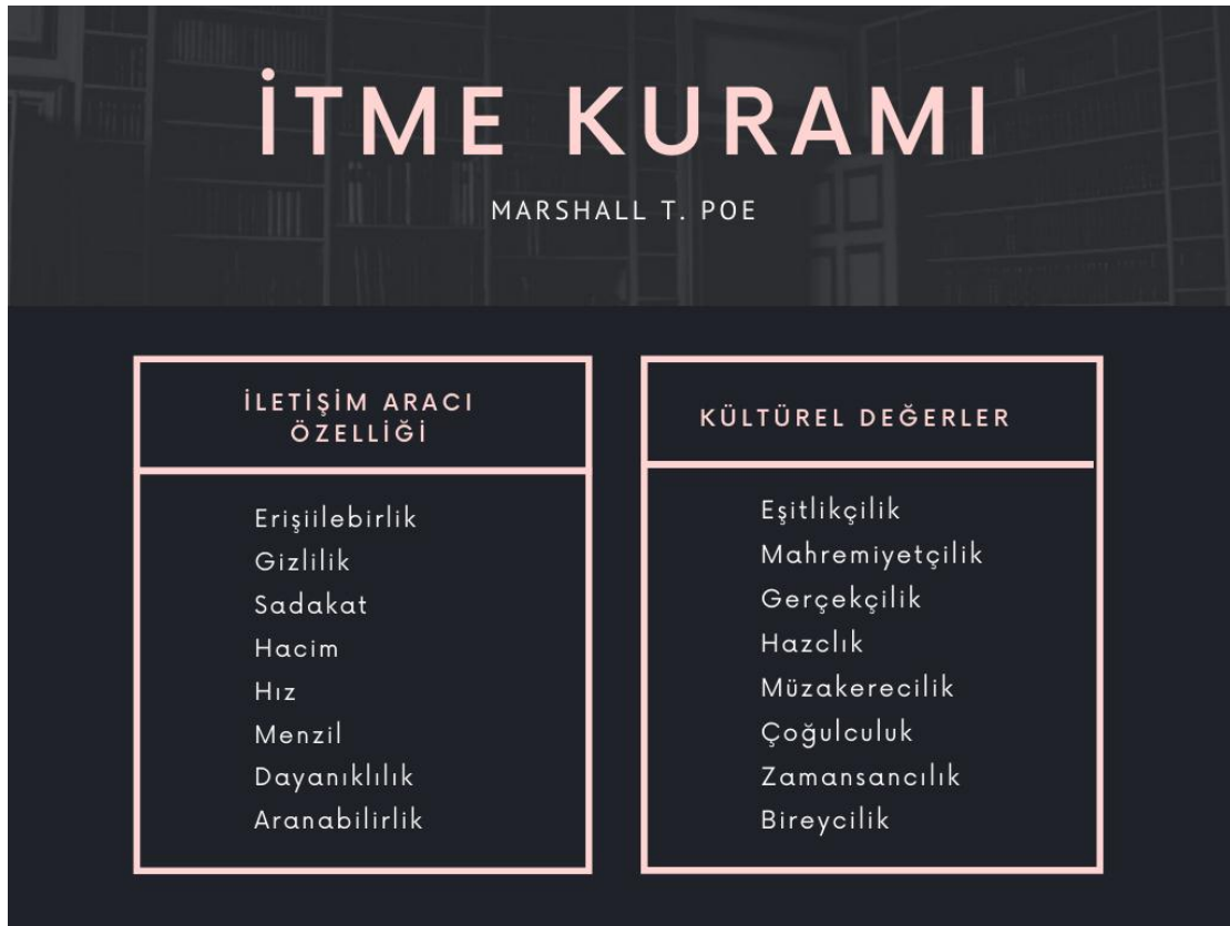
Şekil 2: Poe'nin İtme Kuramı'nın Özeti

Poe medya tarihini beş döneme ayırmıştır. Bunlar “konuşma döneminde insanlık”, “elyazmaları döneminde insanlık”, “matbaa döneminde insanlık”, “görsel-ışitsel iletişim döneminde insanlık” ve “internet çağında insanlık”tır. Ona göre medya tarihinde iletişim araçlarının özellikleri, toplum üzerinde kültürel değerler oluşturmuş ve iletişim araçları sosyal gerçekliğe dönüşmüştür. Örnek olarak “elyazmaları” döneminde yazıyı okuma ve yazmanın rahiplerin ve belli elit kesimlerin elindedir ve kitlesel olarak yaygın hale gelmemiştir. Bu durum, yazının erişilebilirlik özelliği zayıf olduğu için, kültürel değer olarak eşitlikçilik yerine “seçkincilik” fikrinin ortaya çıkmasına sebep olmuştur. Yazının gizlilik özelliği yüksektir, bundan dolayı “mahremiyetçilik” anlayışı gelişir. “Sadakat” düşük olduğu için idealizm, hacim alanı düşük olduğu için “çilecilik”, hız düşük olduğu için “otoriteryanizm”, menzil yüksek olduğu için çoğulculuk, dayanıklılık yüksek olduğu için “zamansalcılık” ve “aranabilirlik” düşük olduğu için kolektivizm ortaya çıkmıştır. 105