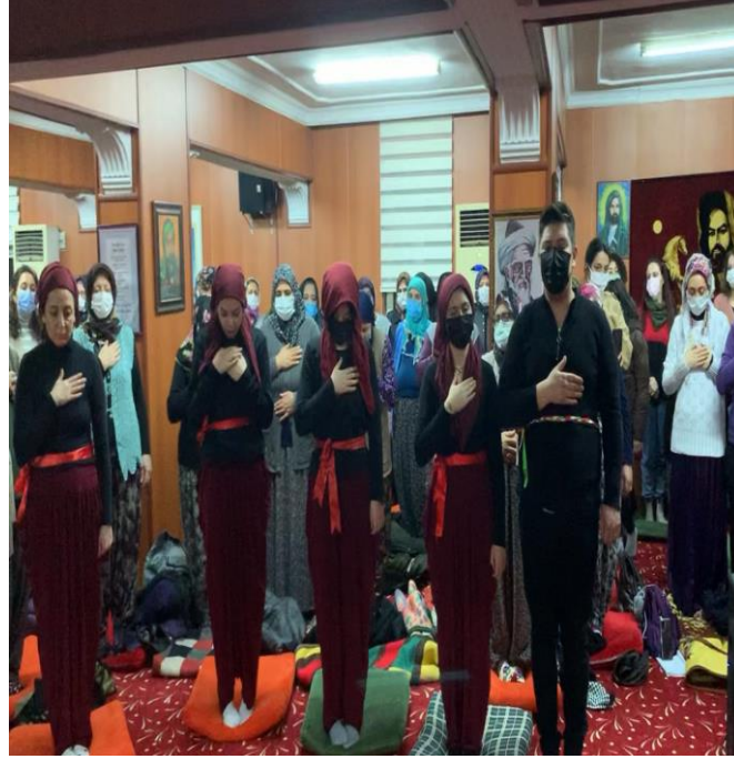
Fotoğraf 24: Hızır Cemi Eskişehir Cemevi, Semah Ekibi ve Herkesin Ayağa Kalkması