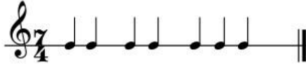
Şekil 23: Ali'nin Düldül'ün Semahı Ritim Kalıbı-2