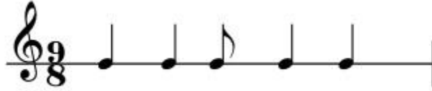
Şekil 47: Kırklar (Miraçlama) Semahı Ritim Kalıbı