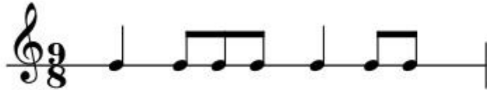
Şekil 59: Dervişler Semahı Ritim Kalıbı