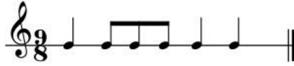
Şekil 66: Kerbela Semahı Ritim Kalıbı-4