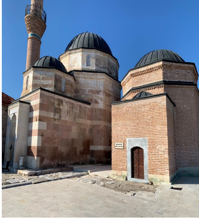
Fotoğraf 39: Seyyid Sultan Şucaaddin Veli Dergâhı, Cami ve Mürvet Ali Paşa Türbesi