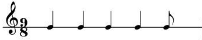
Şekil 40: Dem Geldi (Dedeler) Semahı Ritim Kalıbı-2