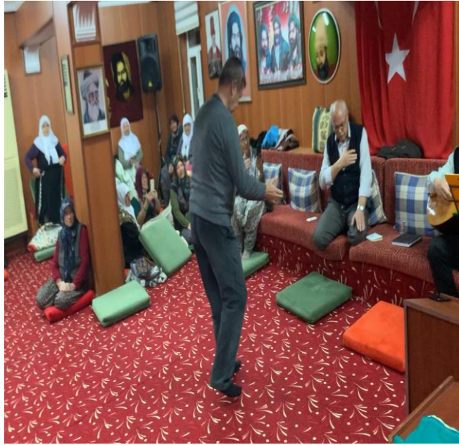
Fotoğraf 12: Eskişehir Cemevi Deli Battal'ın Garipler Semahı'nı Tek Kişi Olarak Dönmesi-2