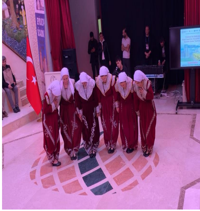
Fotoğraf 7: “Türkistan’dan Balkanlara, Ahmet Yesevi’den Sücaaddin Veli’ye Erenlerin İzinden” Konferansı, Yöresel Kıyafetlerle Semah Ekibi-1