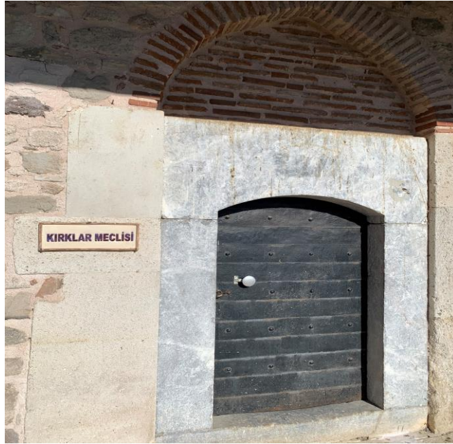
Fotoğraf 42: Seyyid Sultan Şücaaddin Veli Dergâhı, Kırklar Meclisi