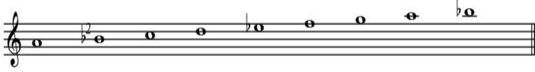
Şekil 58: Dervişler Semahı Dizisi