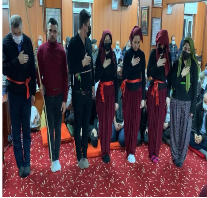
Fotoğraf 22: Hızır Cemi Eskişehir Cemevi, Hizmetçilerin Niyaz Etmesi