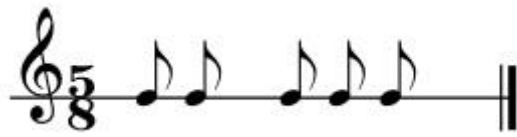
Őekil 63: Kerbelah Semahı Ritim Kalıbı-1