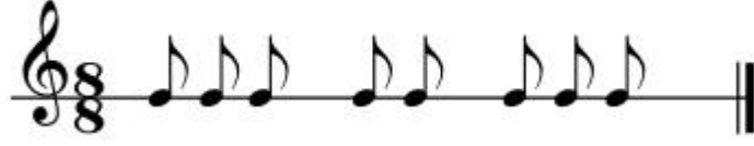
Şekil 65: Kerbela Semahı Ritim Kalıbı-3