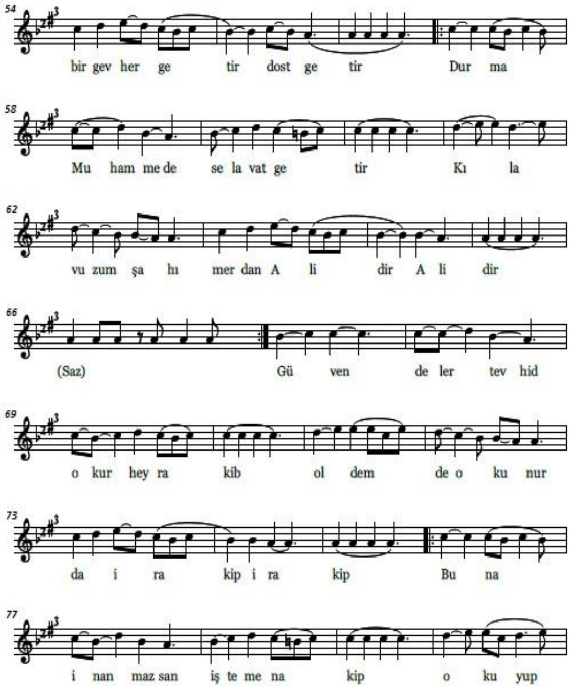
Şekil 3: Kırklar Semahı Notası-3