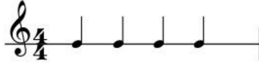
Şekil 39: Dem Geldi (Dedeler) Semahı Ritim Kalıbı-1