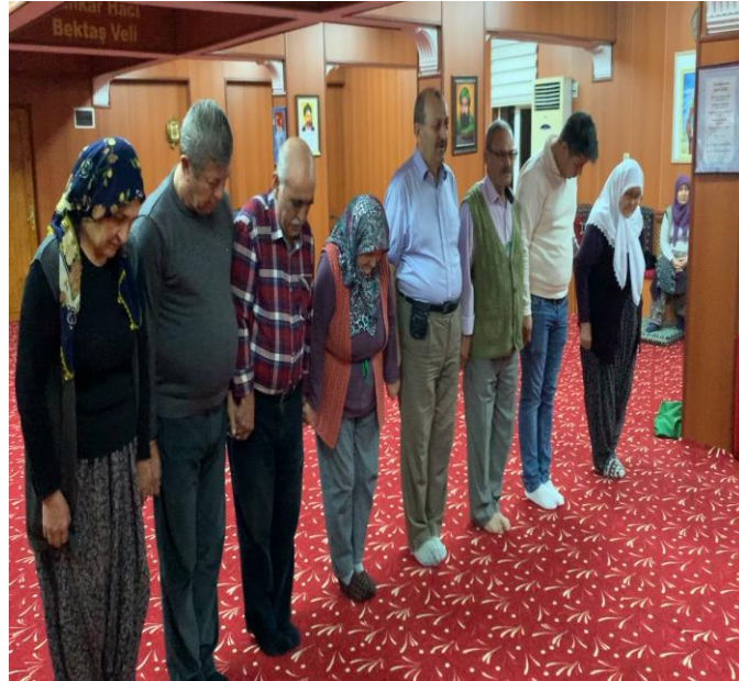
Fotoğraf 10: Eskişehir Cemevi, Kadın ve Erkekler Beraber Semah Döndükten Sonra Şah Beyit Kısmı