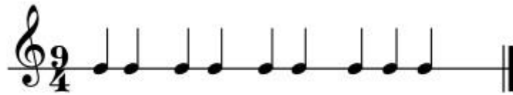
Şekil 17: Turnalar Semahı Ritim Kalıbı-1