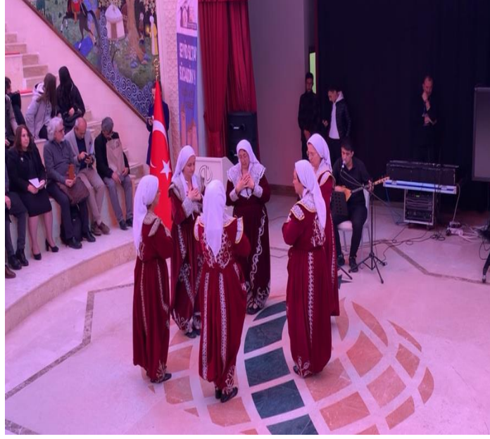
Fotoğraf 9: “Türkistan’dan Balkanlara, Ahmet Yesevi’den Sücaaddin Veli’ye Erenlerin İzinden” Konferansı, Yöresel Kıyafetlerle Semah Ekibi-3

Kaynak: Yazar tarafından oluşturulmuştur.