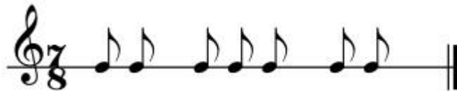
Őekil 64: Kerbelah Semahı Ritim Kalıbı-2