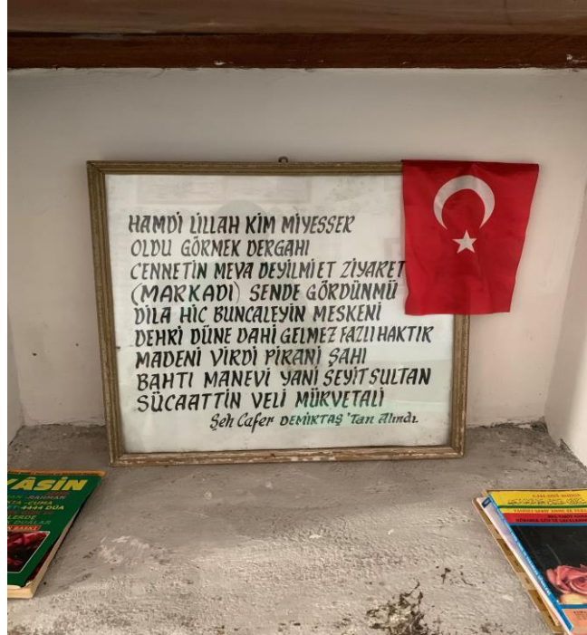
Fotoğraf 36: Seyyid Sultan Şücaaddin Veli Dergâhında Bulunan Bir Yazı