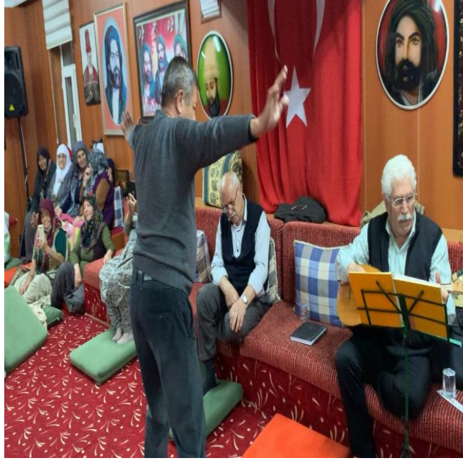
Fotoğraf 11: Eskişehir Cemevi Deli Battal'ın Garipler Semahı'nı Tek Kişi Olarak Dönmesi-1