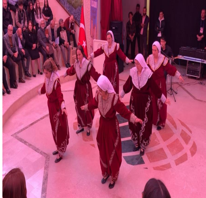
Fotoğraf 8: “Türkistan’dan Balkanlara, Ahmet Yesevi’den Sücaaddin Veli’ye Erenlerin İzinden” Konferansı, Yöresel Kıyafetlerle Semah Ekibi-2