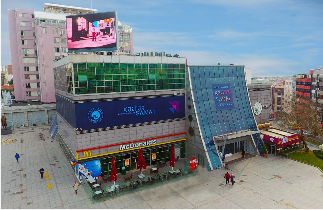
Fotoğraf 1: Gaziosmanpaşa Belediyesi Kültür ve Sanat Merkezi Binası

Gaziosmanpaşa Sanat Akademisi 2018 yılı Kasım ayında ilçe sınırları içerisinde bulunan Kültür ve Sanat Merkezi binasında faaliyete başlamış bir belediye hizmeti olarak karşımıza çıkmaktadır (www.goptasanat.com). Bugün itibariyle “goptasanat” kullanıcı adıyla instagram sayfasında paylaşılan afiş ve görsellerde yer alan bilgiler doğrultusunda bu akademide 43 branşta sanatsal eğitim verilmektedir (www.instagram.com/goptasanat).