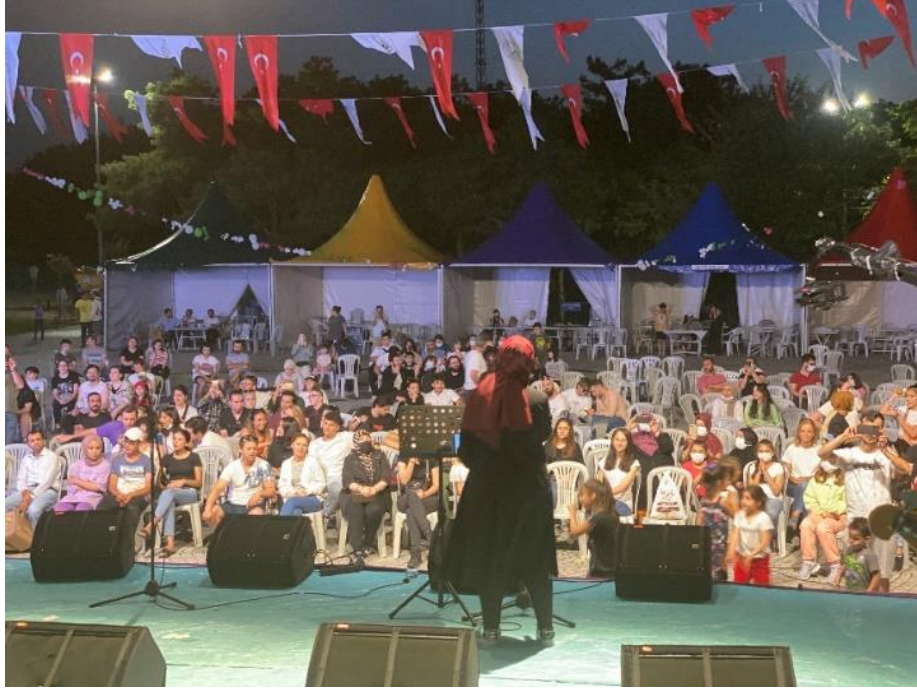
Fotoğraf 25: 2020-2021 Eğitim Öğretim Yılı Yıl Sonu Şenlikleri

bugün 100'ü aşkın sayıda etkinlik yaparak ilçe genelinde ve komşu ilçelere sanatsal anlamda hizmet verdiği bilgisine ulaşılmıştır. Bu faaliyetlere örnek olarak seminer, söyleşi, atölye çalışmaları, konser, dinleti, gösteri, sergi, şenlik, anma programları gibi etkinlikler verilebilmektedir (www.goptasanat.com.tr).