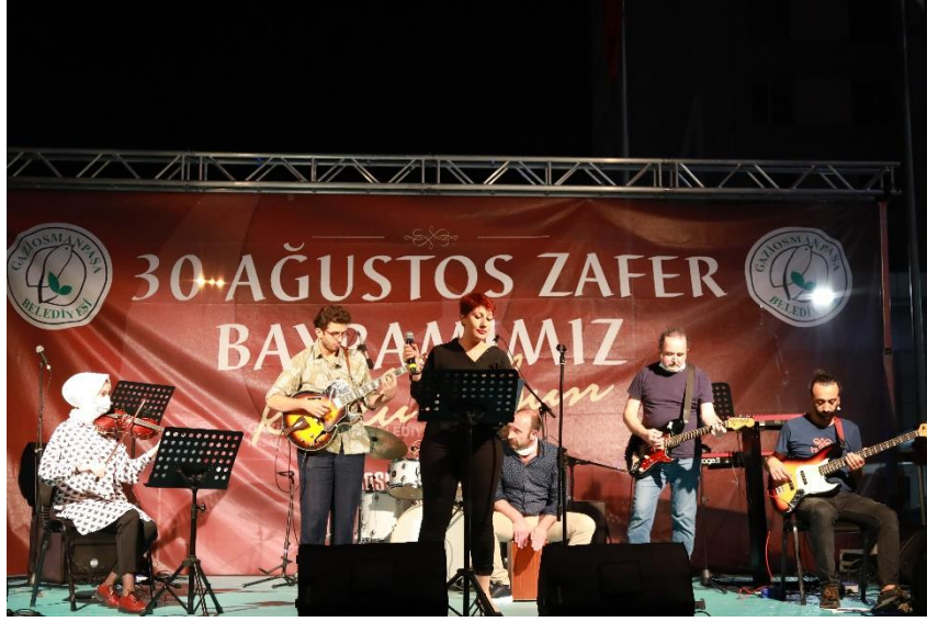
Fotoğraf 26: Gaziosmanpaşa Sanat Akademisi Öğretmenler Orkestrası 30 Ağustos Zafer Bayramı Konseri