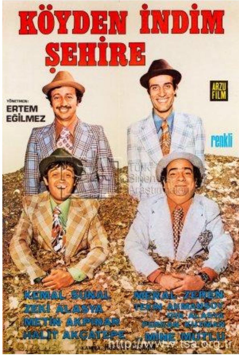
Ek 15 - Köyden İndim Şehire Film Afışı

Kaynak: https://www.tsa.org.tr , Erişim Tarihi 15.05.2022 (Köyden İndim Şehire)