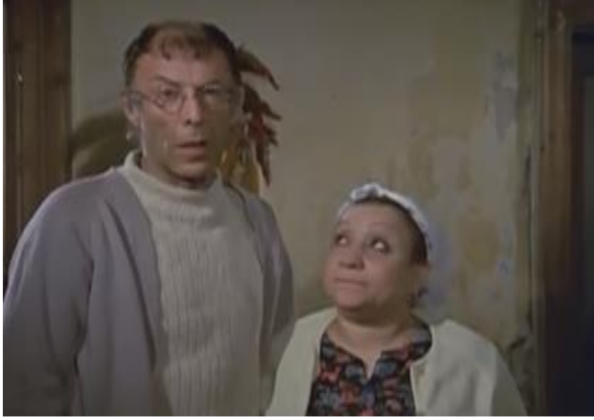
Görsel 4: Mehmet Çavuş'un Evinin Bodrumunda Duvara Asılı Kurutulmuş Biberler