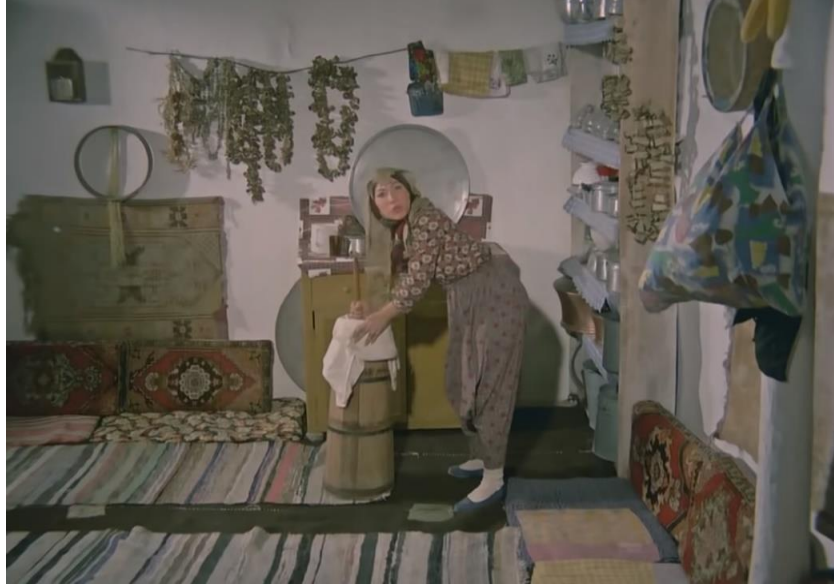
Görsel 8: Filmin Köy Hayatına Ait Bazı Ev Eşyaları

Bakır kazan, bakır tencere, el bezleri, tepsi, yer minderi, elek, yastık, duvar halıları, sandık, su testisi ve sepettir.