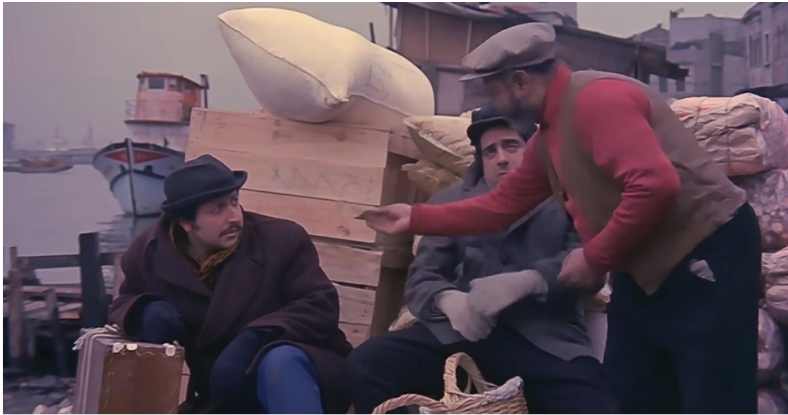
Görsel 14: Filmdeki Mesleklere Dair Bir Sahne

Tuvalet Temizlik Görevlisi: Zeki ile Metin İstanbul'a geldikleri sahnede Zeki'nin tuvalet ihtiyacının geldiği görülür. Metin, ihtiyacını gidermesi bağlamında Zeki'ye arabaların arasına gitmesini söyler. Bu durumu gören bir taksici duruma müdahale eder. İkiliye, binanın içerisinde tuvalet olduğunu söyleyerek onları tuvalete yönlendirir. Tuvalette bulunan temizlik görevlisi Zeki'den 50 kuruş tuvalet parası ister. Filmde ayrıca temizlik görevlisi ile Zeki-Metin arasında geçen diyaloglar komiklik arz eder. Temizlik görevlisinin Doğu Grubu ağız özellikleriyle konuştuğu tespit edilmiştir. Bu durum metin merkezli yaklaşıma örnek teşkil eder.