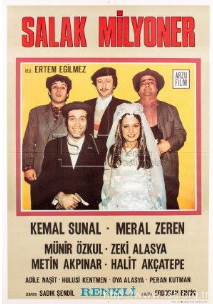
Ek 14 - Salak Milyoner Film Afifi

(Salak Milyoner)