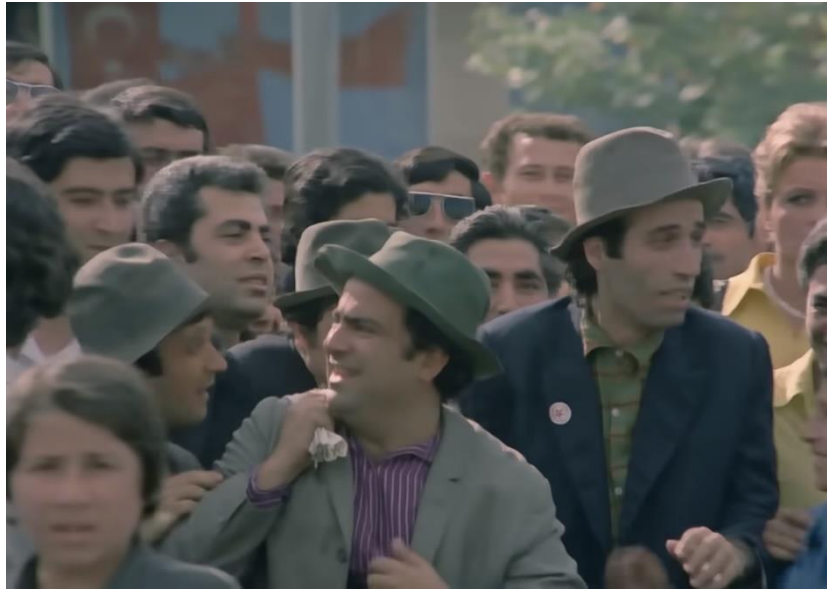
Görsel 11: Kardeşler, Şehre Geldiklerinde Millî Bayram Töreni ile Karşılaşırlar

İlgili filmde dört kardeş, Ankara'ya geldikleri zaman millî bayram töreni yapılmaktadır. Filmde, millî bayram olduğunu vurgulamak için Ankara'nın dört bir yanı Türk bayrağı ve Atatürk posterleriyle süslenmiştir. Kardeşler, o günün bayram olduğundan habersizdirler. Şaşkınlıkla kalabalığın içerisine karışırlar. Neler olduğunu vatandaşlara sorup öğrenmeye çalışırlar. Günün anlam ve önemini öğrendikten sonra onlar da kalabalıkla birlikte alkış tutup bayramı kutlarlar. Askeri geçit törenlerini izlerler. Ayrıca filmde millî bayramın akşam vaktinde de devam ettiği görülmektedir. Filmde millî bayram sahnesinde çalan Sakarya Marşı ses merkezli yaklaşıma örnek teşkil eder.