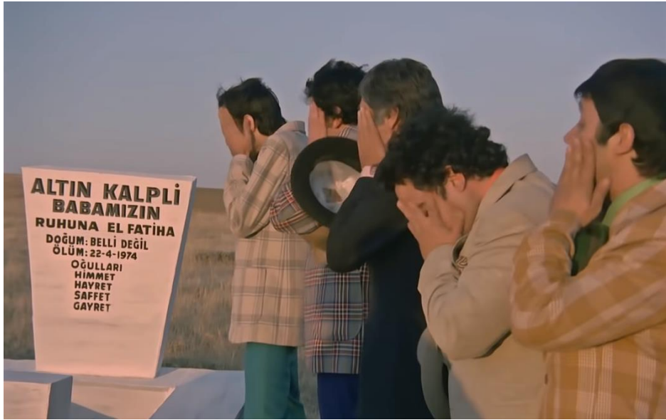
Görsel 10: Kardeşler ve Ali Rıza Emmi, Kayserili Behçet’in Kabrini Ziyaret Ederken

Türk halk kültüründe mezar taşlarında ölen kişinin adı-soyadı, doğum-ölüm tarihleri ve ölen kişinin ruhuna Fatiha istenmesi yer alır. Tüm bunlarla birlikte ölen kişinin mesleği, ölüm nedeni, istekleri de belirtilir. Ayrıca ölen kişiye duyulan sevgiyi ifade etmek amacıyla şiirler, beyitler ve deyişler mezar taşlarını süslemektedir. Bu ve benzeri durumlar filme konu olmuştur. Dört kardeş, babalarına mezar taşı yaptırmış ve üzerine de “Altın kalpli babamızın ruhuna el Fatiha” yazdırmışlardır. Görüldüğü üzere kardeşlerin babalarına karşı duydukları sevgi, mezar taşında da dile getirilmiştir. Filmde mezar ziyaretinin sona ermesiyle ağabey Himmet, üzerindeki altınların ağırlığından dolayı açılmış olan bir mezarın içerisine düşer ve yardım ister. Bu bölümde izleyiciye mizah yoluyla bir mesajın gönderildiği söylenebilir. Zengin ve fakir olan her insanın ölümü tadacağı düşüncesi bu sahnede yansıtılmaktadır.