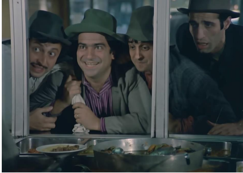
Görsel 9: Kardeşler, Ankara’da Bir Lokantaya Gidip Yemek Yerken

Pürelî kebab, diğerk adıyla patatesli tas kebabı kardeşler arasında çok beğenilmiş bir yemek çeşidi olarak izleyiciye yansıtılır.