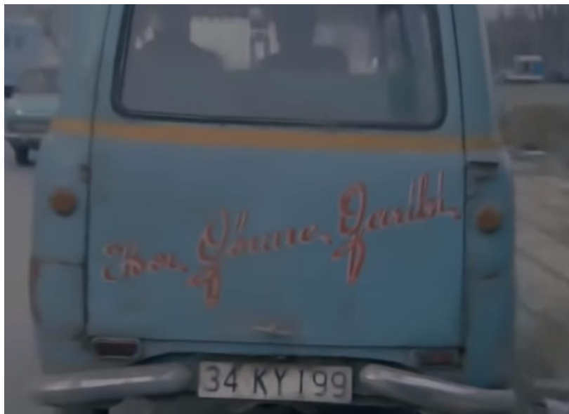
Görsel 20: Selim’in Minibüsündeki Düzgü Örneği

Minibüs: Halim ve Selim’in minibüsleri vardır ve ekmek paralarını bu araçları kullanım yoluyla kazanırlar. Selim’in minibüsünün arkasındaki yazı “Hor görme garibi” olarak izleyiciye yansıtılmıştır. Doğan Kaya’nın görüşüne göre Anonim Halk Şiiri türleri içerisinde mani, bilmece, türkü, ağıt, ninni gibi türlerin yanında halkın günlük hayatında esnaflıkla ilgili kullandığı pek çok söz vardır. Bu sözler, “Düzgü” olarak adlandırılmaktadır. Halkın gündelik hayatta kullandığı sözlerin, taksi, kamyon, minibüs gibi araçların arkasında kullanılması düzgülüye örnektir. (Kaya, 1999:403) Selim’in minibüsünün arkasındaki “Hor görme garibi” cümlesi Doğan Kaya’nın da örneklendirdiği gibi bir düzgülü türüne örnek verilebilir.