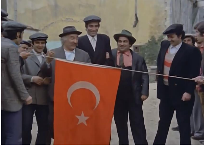
Görsel 5: Köy Halkı Tarafından Düğün Alayının Önü Kesilirken