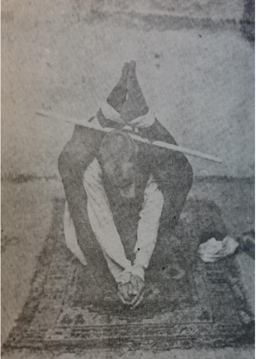
Resim 5: Domuz Topu İşkencesi