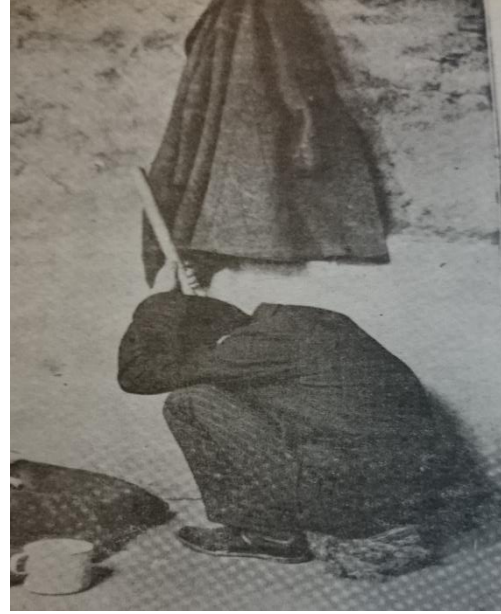
Resim 7: Tuvalet Hapsindeki Bir Mahkûm

Bekirağa bölüğü de 2. Meşrutiyet sonrası muhaliflere yönelik işkencelerle özdeşleşmiş bir mekân olarak kayıtlara geçmiştir. İttihat ve Terakki komitecileri tarafından muhalifleri bastırmak ve halka korku salmak amacıyla Cemiyet-i Hafıyye adında, devlet aleyhine faaliyette bulduklarını iddia ettikleri bir teşkilat nazariyesi ortaya atıldı. Bu cemiyete üye olma suçlamasıyla gözaltına alınanlara Bekirağa bölüğünde ölümle tehdit, kırbaçla ve kızılılık sopasıyla darp (bk. Resim 4 ve Resim 6), cımbızla et çekme, falaka, kazıklama (bk. Resim 3), 322 domuz topu (bk. Resim 5) 323 , gemi çapası, 324 gibi işkenceler; tuvalette