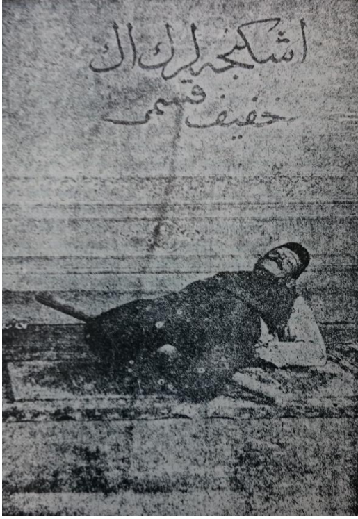
Resim 3: Kazıklama İşkencesi