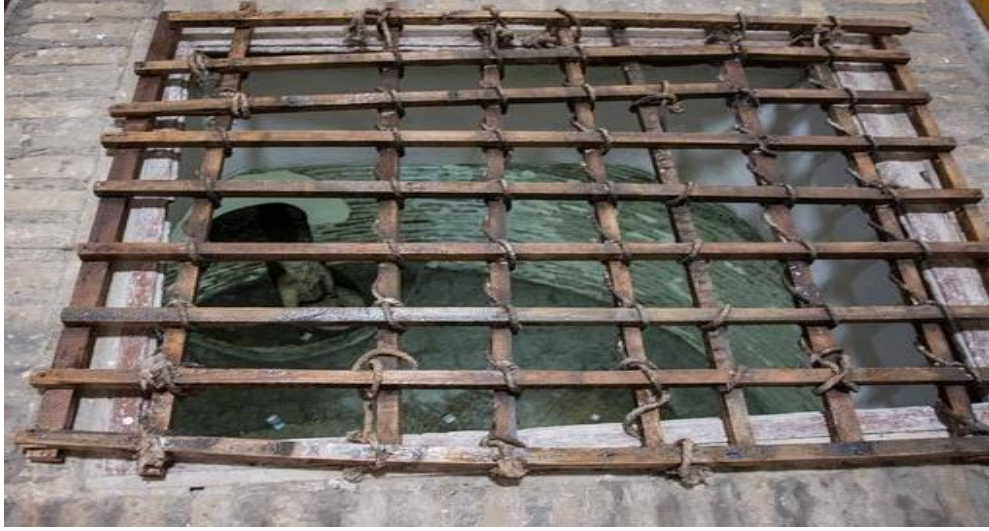
Resim 2: Kene Kuyusu (Buhâra Zindan Müzesi)

valilerinden Ziyâd b. Ebîh (ö. 53/673) döneminde kurulan ve Haccâc döneminde de faal olarak kullanılan dâru'l-istihrâc isimli bir işkence merkezinden bahsedilir. Burada daha ziyade rüşvet veya zimmete para geçirmekle suçlanan devlet memurlarından itiraf almak için işkence uygulandığı belirtilmektedir. Sorgulamaları yürütüp zanlıları konuşurmakla