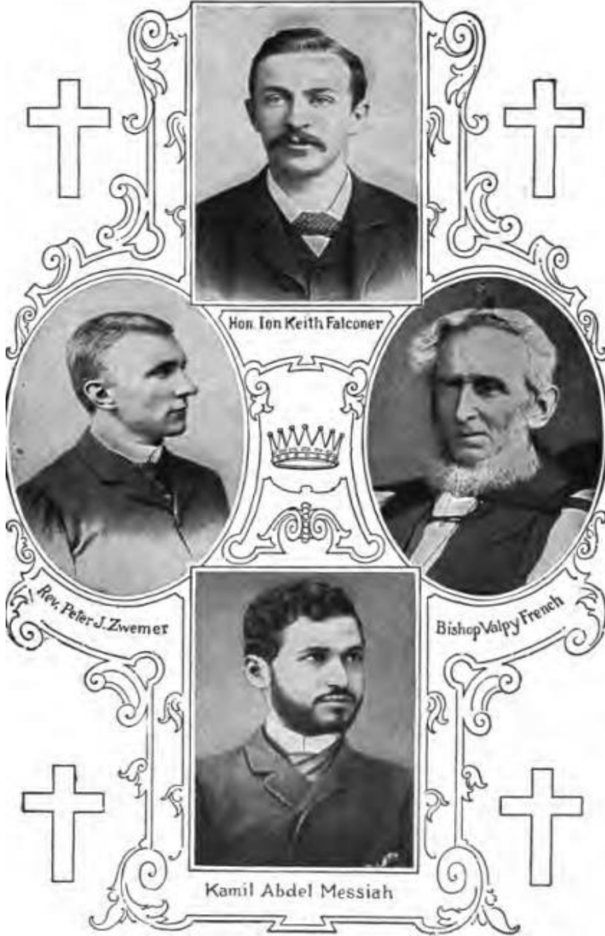
FOUR MISSIONARY MARTYRS OF ARABIA