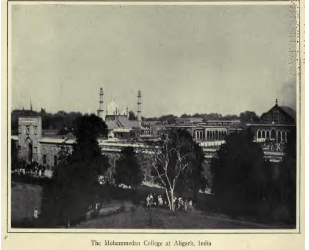
Ek 6: Aligarh'da Seyyid Ahmed Han tarafından kurulan Müslüman Koleji