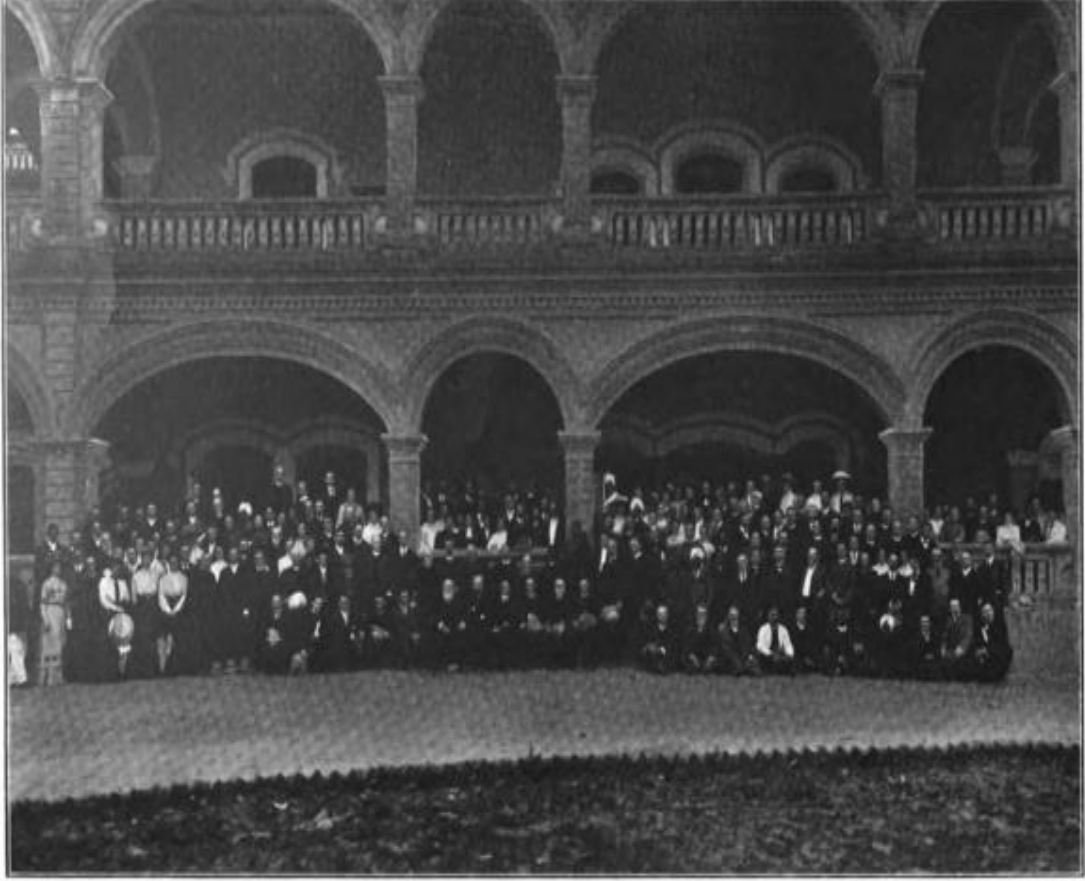
DELEGATES AT THE MISSIONARY CONFERENCE ON WORK AMONG MOSLEMS, LUCKNOW, INDIA, JANUARY 23-28, 1911

Ek 7: 23-28 Ocak 1911'de Lucknow'da düzenlenen Müslüman Dünyası Misyoner Konferansı katılımcıları.