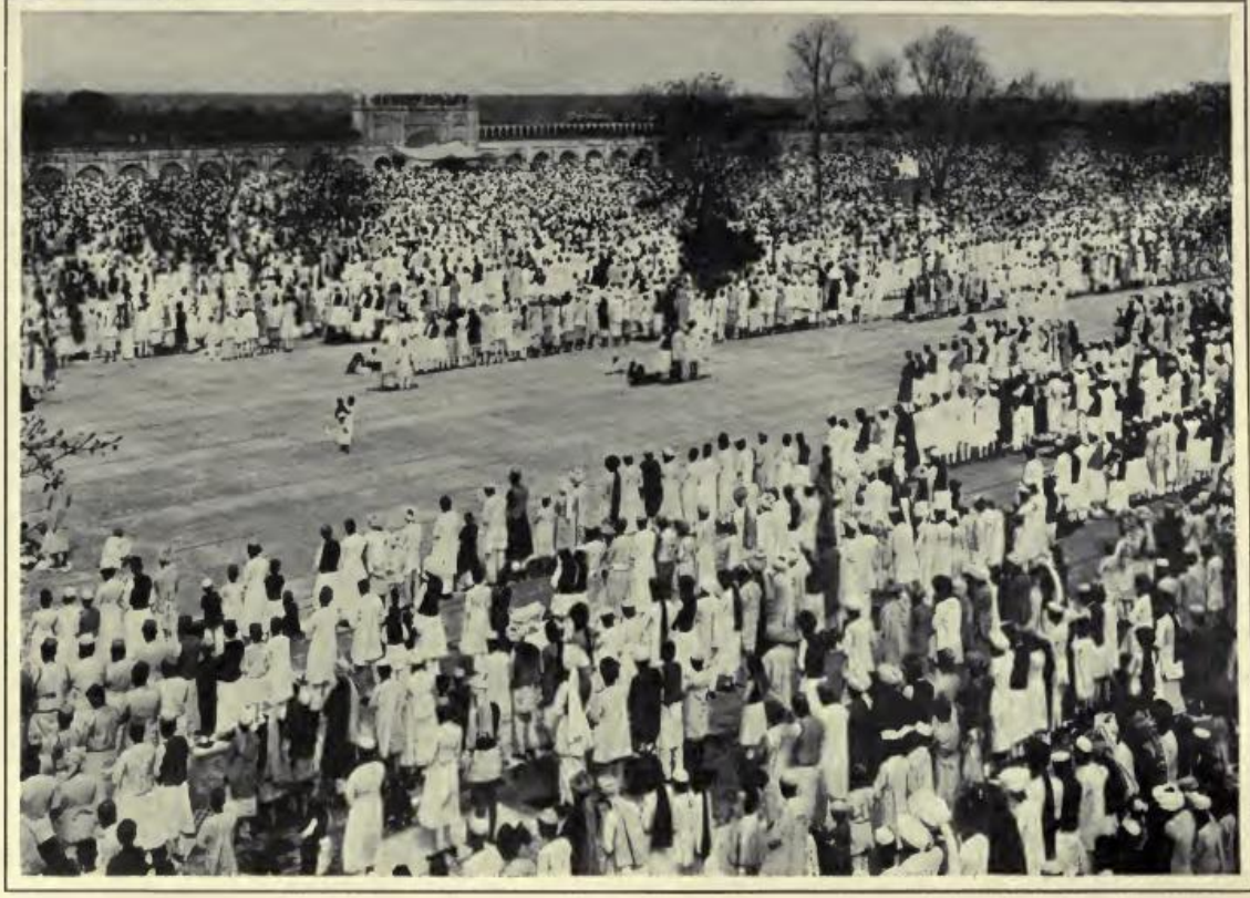
Ek 4: Delhi’de Müslümanlar arasında gerçekleştirilen bir bayram kutlaması.