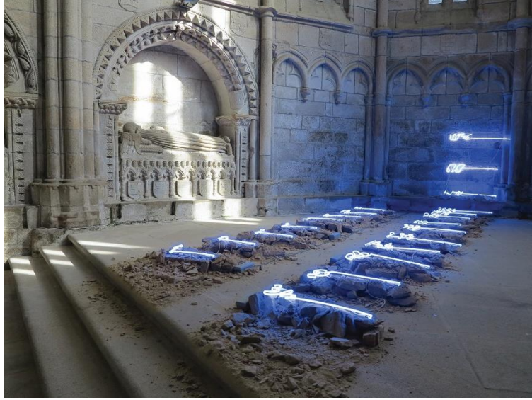
Resim 3. 'On The Road' Sergisi', Santiago de Compostela, Ekim 2014(Mario Merz, "İsimsiz", Taş Formu Granderio, Toprak ve Neon Tüpler)

Sergi, yer ve mekân seçimi konusunda, konu bütünlüğü açısından bir uyum içermektedir. Eserler, mekânla ilişki kurularak, şehrin tarihi bölgesindeki dini mimarilere, şehir mezarlığına ve park alanlarına dağıtılmıştır. Dolayısıyla anlam estetiğinin zaman ve mekân kavramlarıyla kurduğu ilişki, izleyici kitlesinin büyük çoğunluğunun Santiago'yu hacı olmak maksadıyla ziyaret eden Hristiyanlar olduğu düşünülürse, bu sergi için kaçınılmaz mistik sonucu yaratmıştır. Kısacası, Assisi'li Francis'in Giotto'nun freskolarıyla başlayan sanat serüveni, günümüz sanatında küratöryel bakış açısıyla devam ederken, Assisi'li Francis, çağdaş sanatın normlarına göre hazırlanan sergide, anlam bütünlüğünde estetik açıdan yeni bir değer kazanmıştır. (Resim4-5)