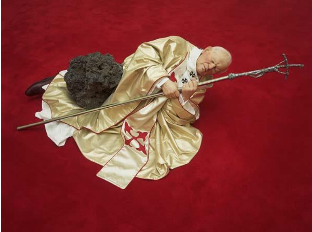
Maurizio Cattelan, La Nona Ora (The Ninth Hour), 1999 http://www.klerkxiam.com/blog/2015/10/8/maurizio-cattelan-swallow-after-listening

Modernizm ile başlayan dini yok sayma çabaları, sonrasında çağdaş sanatın din kavramına yönelik negatif yaklaşımları dikkat çekmeye başlamıştır. Kilisenin sanat aracılığıyla kurduğu geleneksel ilişkide kopuşun vardığı nokta da, sanat adına dini eleştirme ve sorgulamaya kadar ulaşmıştır.