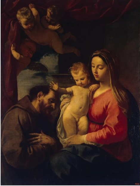
Resim 1. Simone Cantarini (1612-1648)