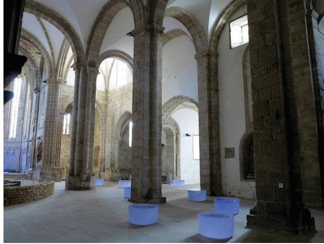
Resim. 5.'On The Road' Sergisi, Santiago de Compostela, Ekim 2014 (Roni Horn “İsimsiz” )