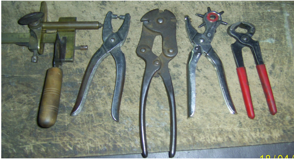
Fotoğraf 26: Deri kesme makası, balıkgözü, zincir kesme makası, çarklı zımba, kerpeten

Çalışmamız sırasında pek çok kaynak kişiden yararlandık. Bunların bir kısmı belli bir el sanatında usta olmuş kişilerken bir kısmı da Taraklı'da yaşayan, buranın kültürünü bilen, yaşayan ve el sanatları ile ilgili gözlem yolu ile belli bir bilgi