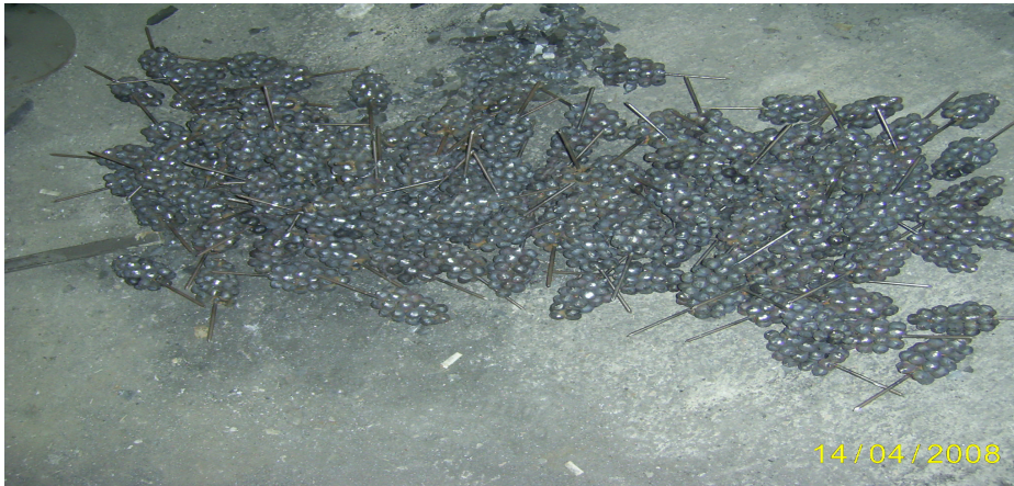
Fotoğraf 10:Gülay Yanık ustanın işyerinde yapılmış üzüm salkımları.

Demircilerin kullandığı başlıca araç gereç ve makineler: Şahmerdan, çeşitli büyüklükte kısıçlar, örgü kısacı, mengene, yan anahtar, yaşmak baskısı, yan baskı,