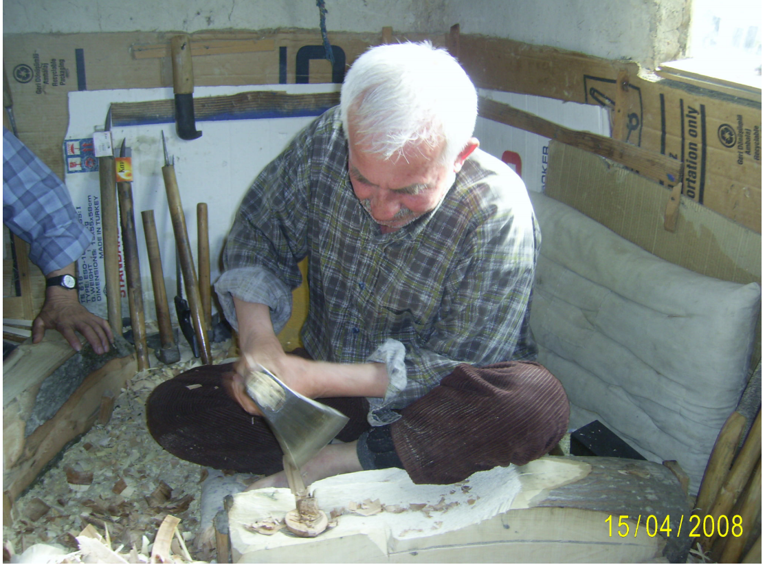
Fotoğraf 12: Gürgen ağacından yapılmış kaşıkçı tezgâhında keserlek işlemi.

Kafa kazıyan, sap kazıyan ve iç kazıyan ile kaşığın içi, dışı ve sapı kazınarak düzeltilir. Daha sonra sıra “yalaklama” ya gelir. Buda iğdi ile kaşığın içindeki izlerin yok edilmesidir. En son aşamada kaşık zımparalanır. Yün ve keçe ile perdahlanır. Kaşığa kaba şekli verildikten sonra daha ince çalışılarak yollanmadan önceki son işlemlerinin yapılmasına perdahlamak deniyor. Ağacın kaşık haline getirilmesinde temel iş yontmaktır.