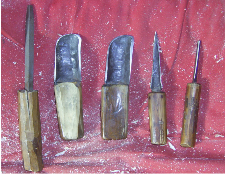
Fotoğraf 14: Trp, trp, kafa kazıyan, bıak, bıak, iędi, iędi, bıak, keser