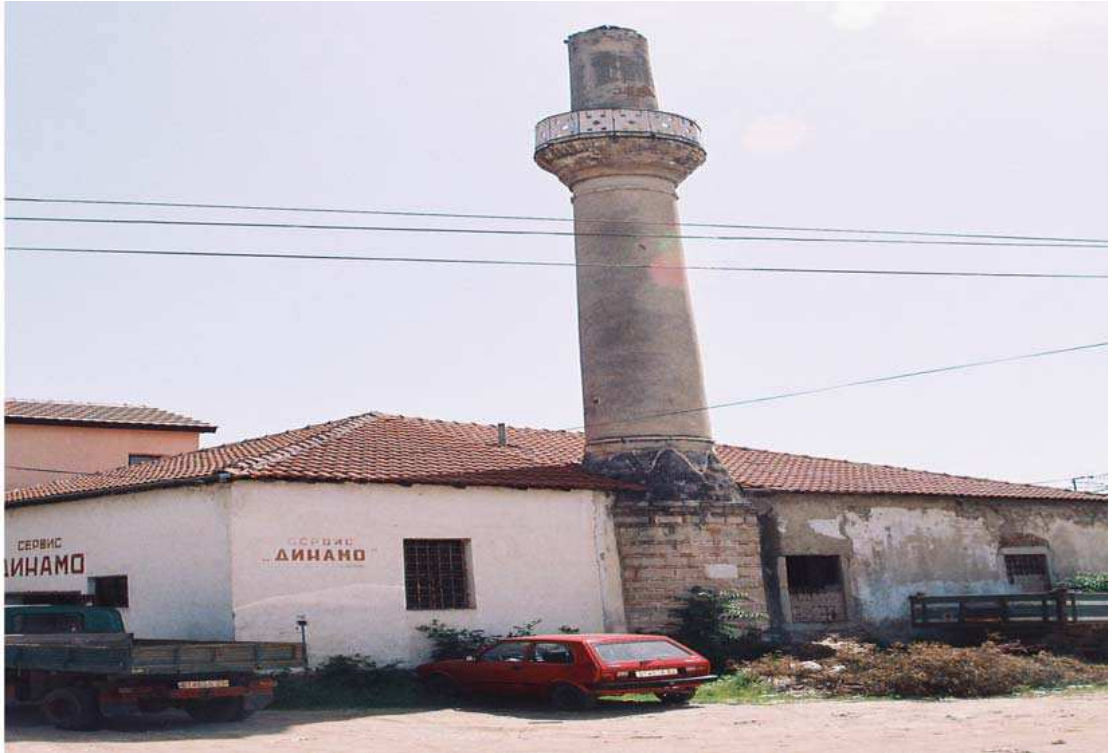
Müftü Şerif Camii