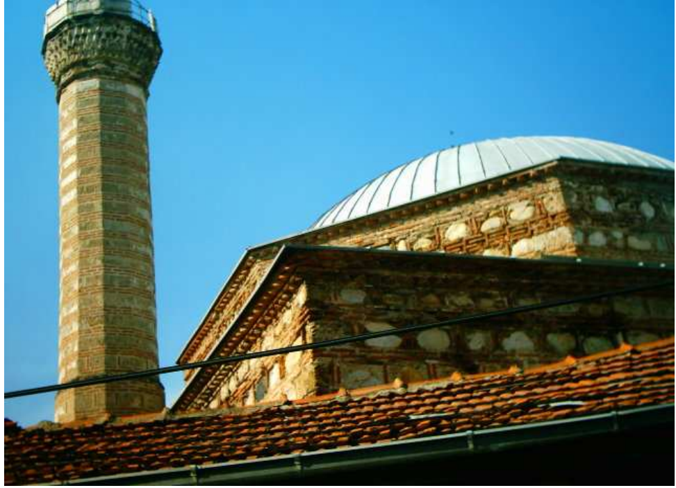
Mahmut Bey Camisi