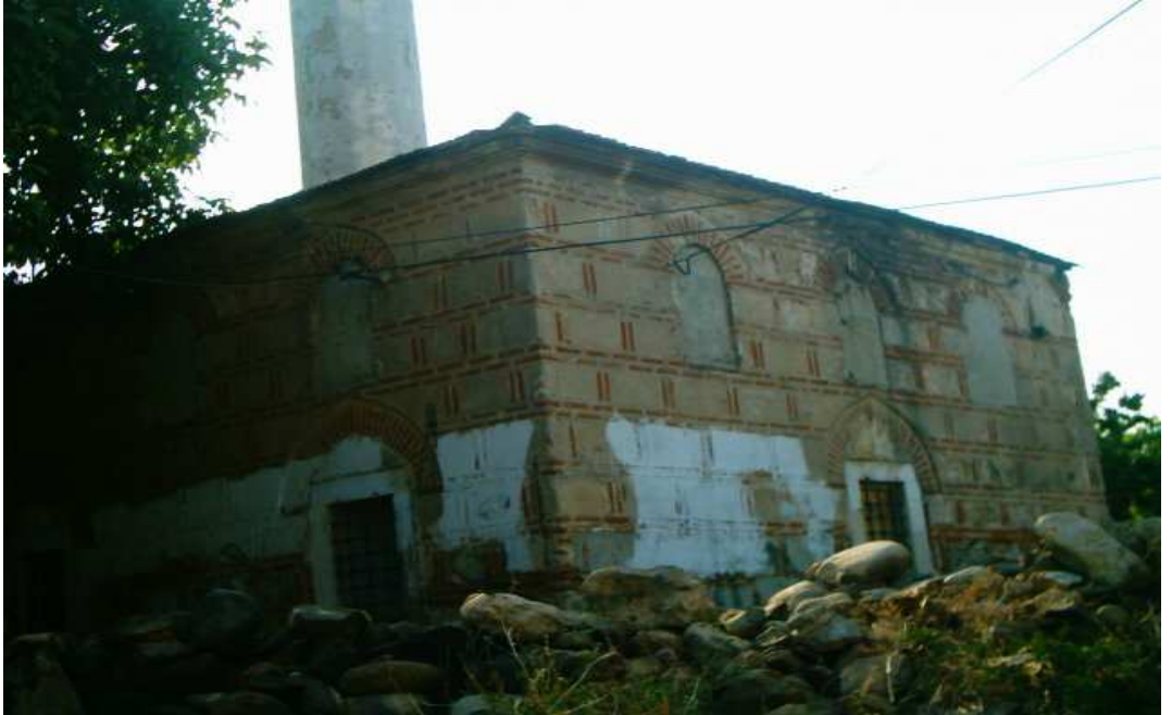
Koca Kadı Camiinin durumu