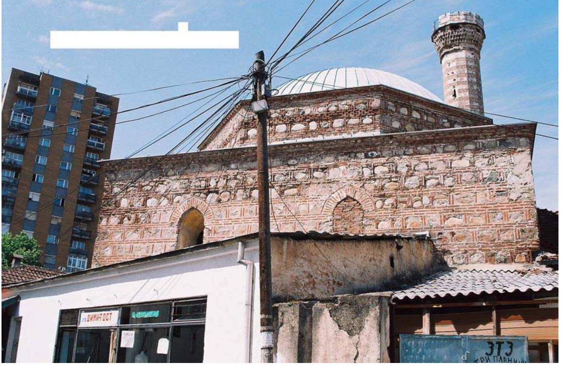
Hacı Şerif Bey Camii