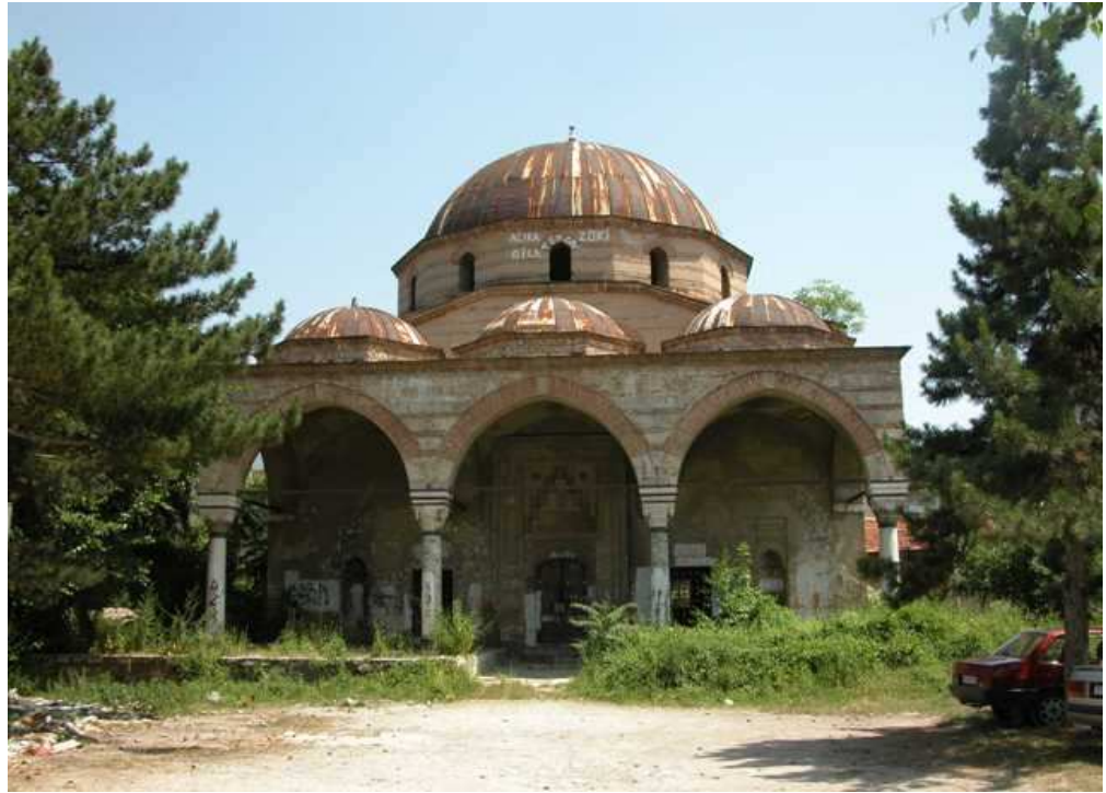
Haydar Kadi Caminin Bugünkü Durumu