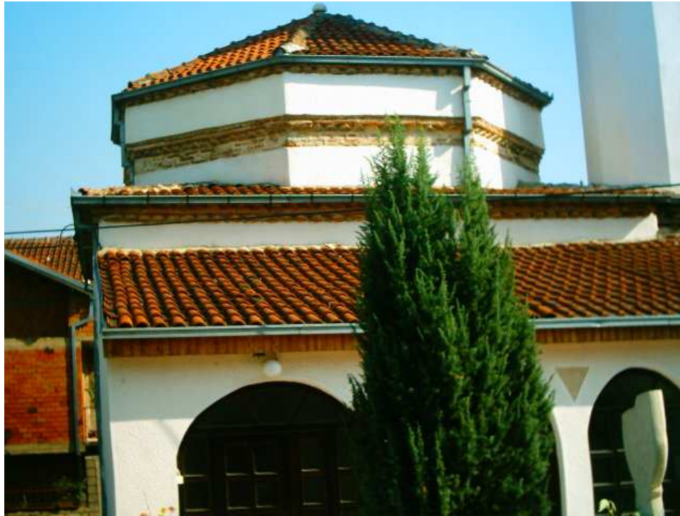
Hasan Baba Camii