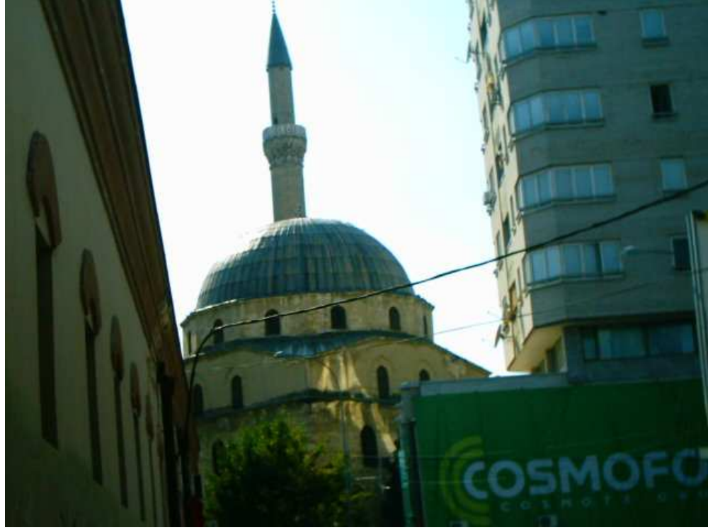
İshak Çelebi Camisi