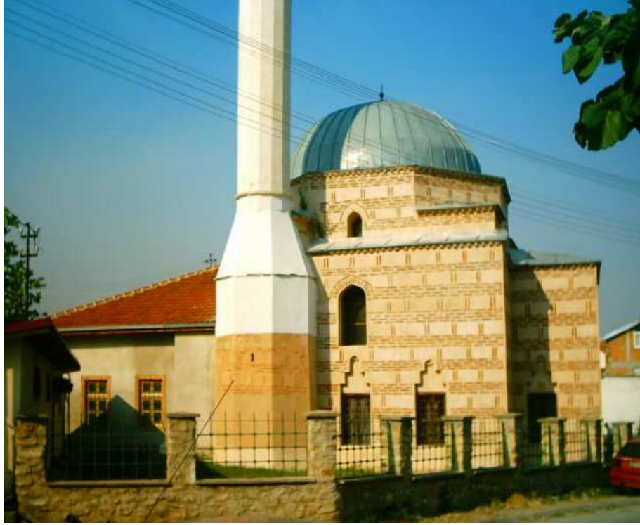
Hamza Bey Camii