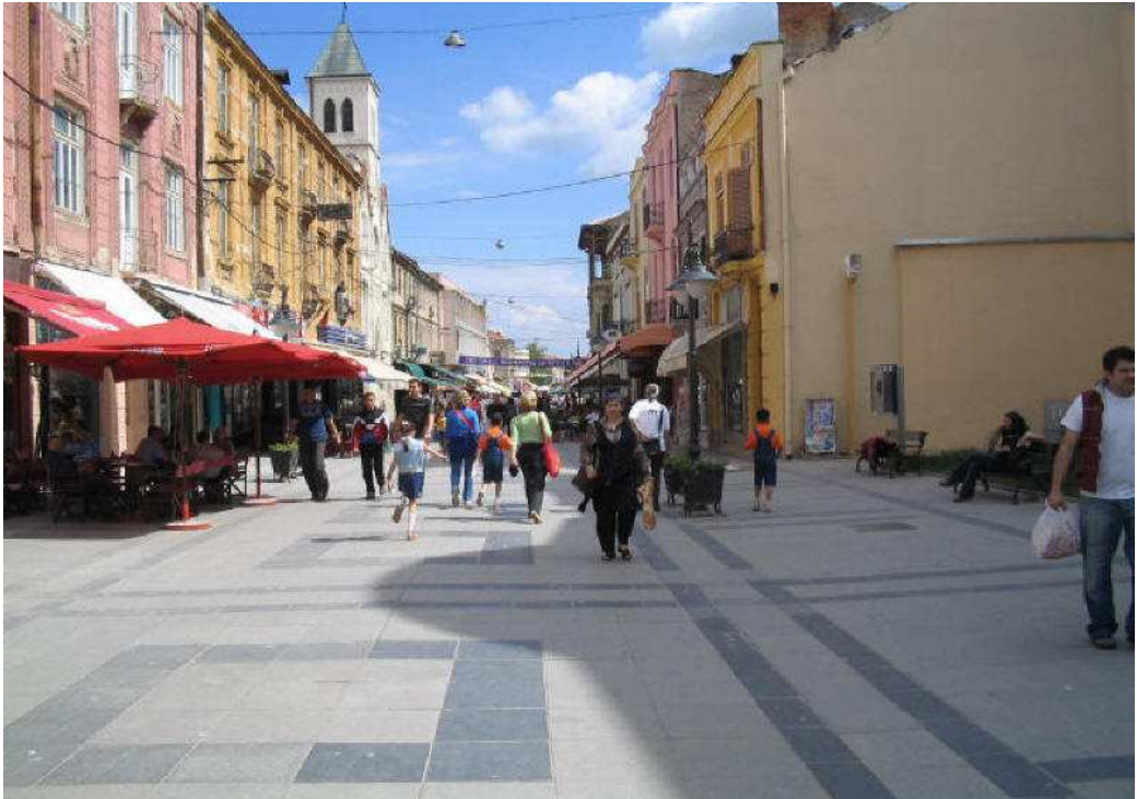
Manastır'ın günümüzdeki hali