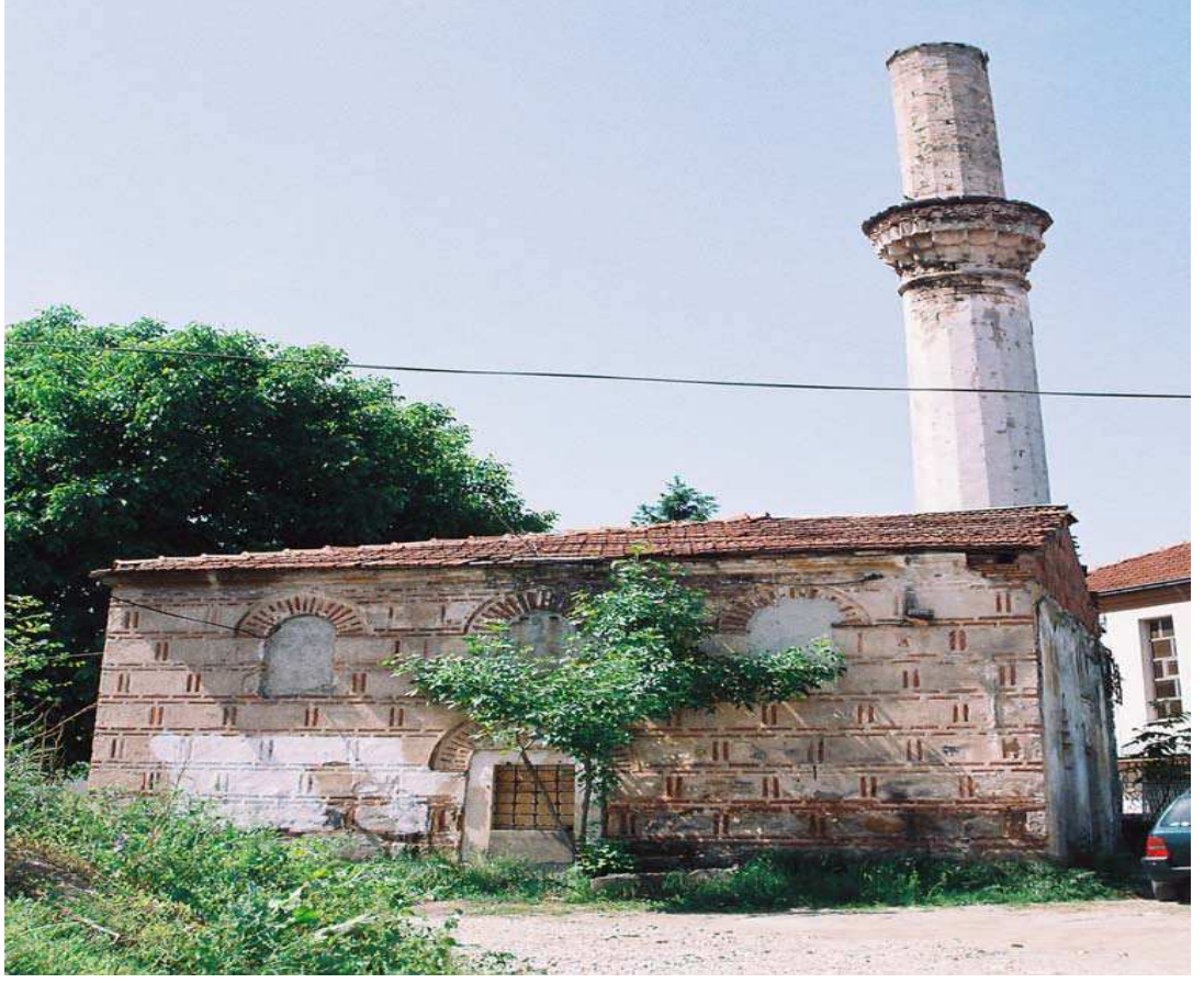
Koca Kadı Caminin Arkadan Görüntüsü