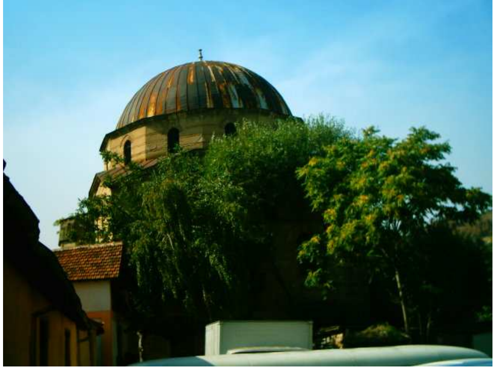
Haydar Kadi Camisi