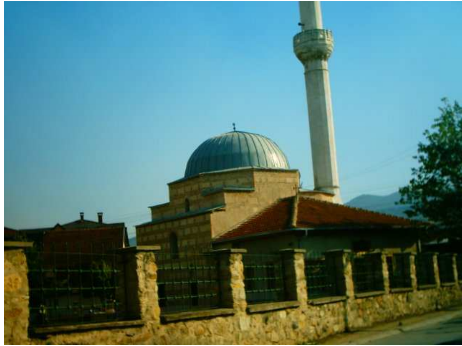
Hamza Bey Camii