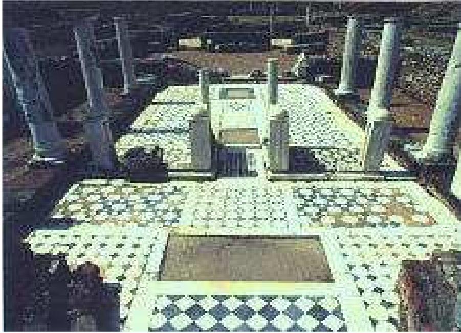
Heraklea Şhri, www.orbis.com.mk/bitol-niz-vekovite.htm (17.04.2008)