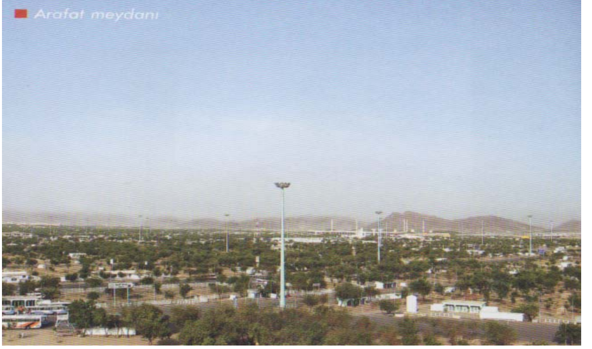
Arafat Meydanı (Bk. Küçükaşçı, Hicaz Albümü s. 62.)