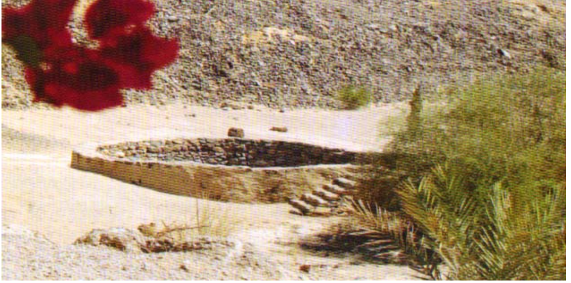
Bedir kuyusu ( Küçükkaşçı, Hicaz Albümü s. 155.)