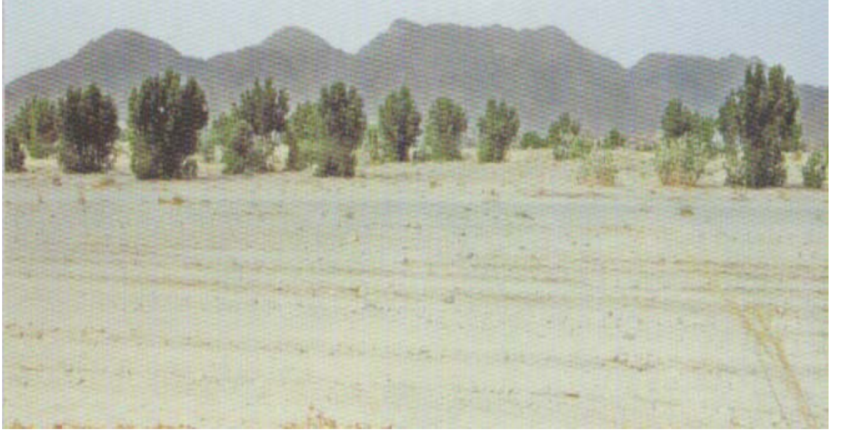
Mekke Yakınlarında Bulunan Mugammes Vadisi ( Küçükaşçı, Hicaz Albümü s. 74.)