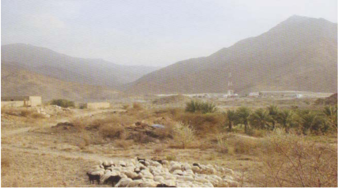
Nahle Vadisi: Tarih boyunca Mekke'nin, meyve ve sebze ihtiyacını karşılayan en önemli yer olan Nahle (hurma ağacı) vadisi, Mekke- Taif yolu üzerindedir.