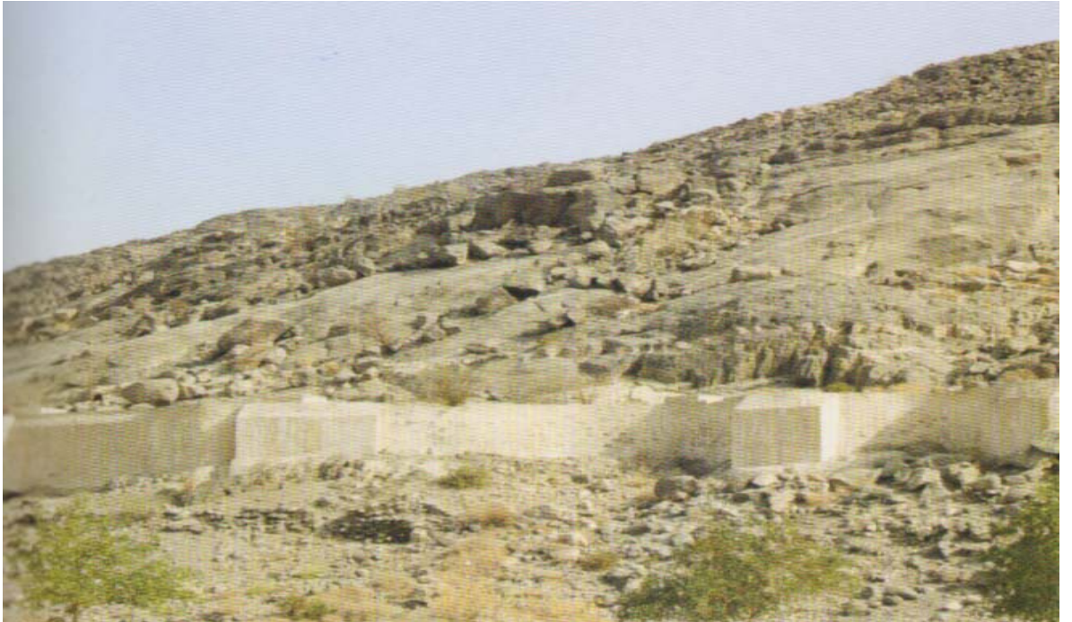
Arafat-Müzdelife Arasındaki Su Yolu ( Küçükkaşçı, Hicaz Albümü s. 63.)