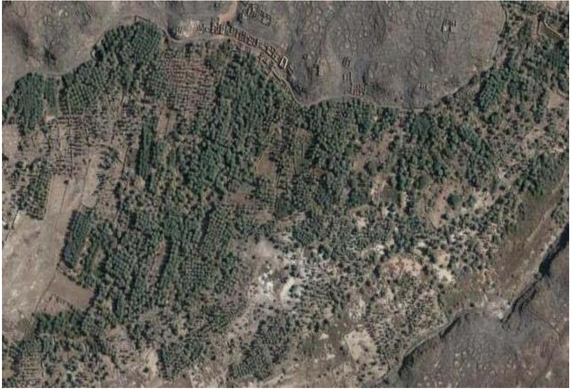
Hayber Hurmalıkları ve Etrafı Duvarlarla Örülmü Haitlerin Günümüzdeki Durumu (Bk. Google Earth, Khayber)