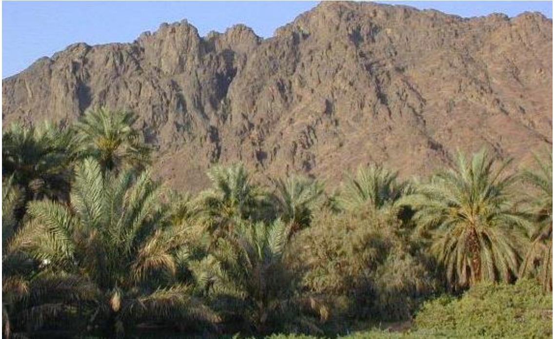
Uhud Dađı Yakınında Bulunan Hurmalıklar (Hicaz2000.com)