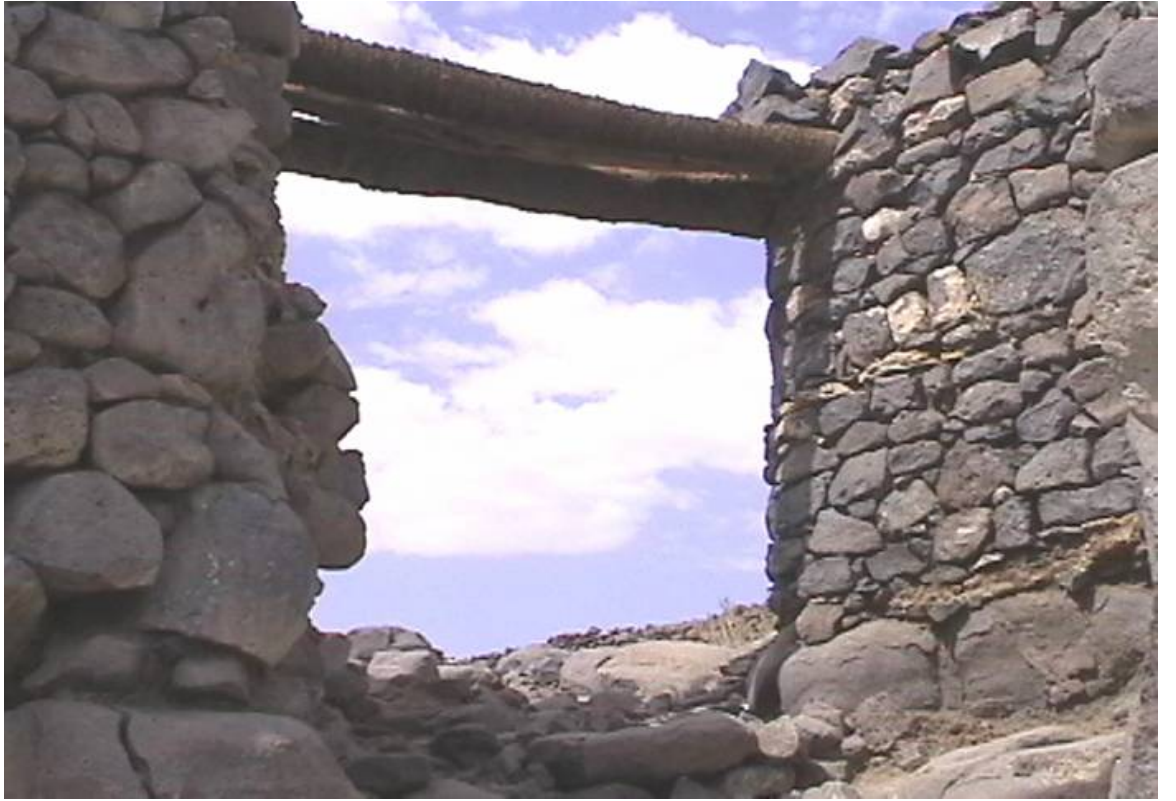
Hayber Harabeleri ve Yapılarda Kullanılan Hurma Kütükleri