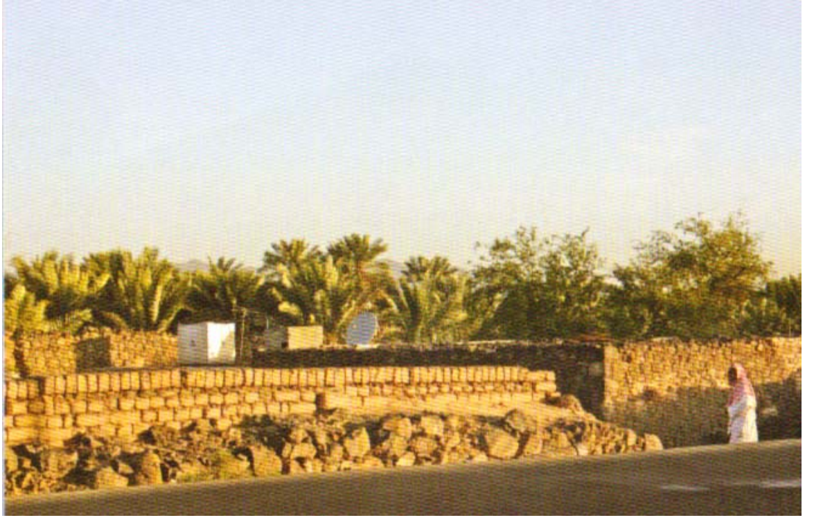
Benî Kurayza Toprakları ( Küçükaşçı, Hicaz Albümü s. 150.)