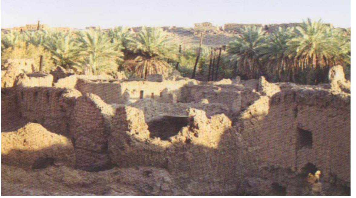
Hayber Harabeleri ve Hurmalıkları ( Küçükaşçı, Hicaz Albümü s. 157.