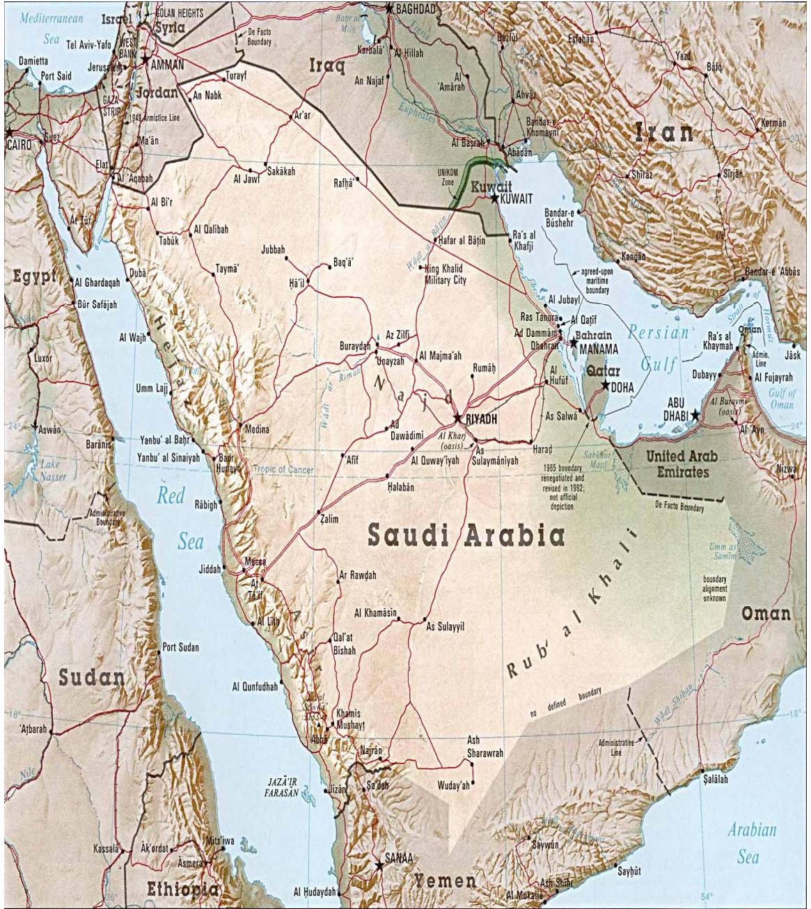
Arap Yarımadası Fiziki Haritası (saudi_arabia lib.utexas.edu)