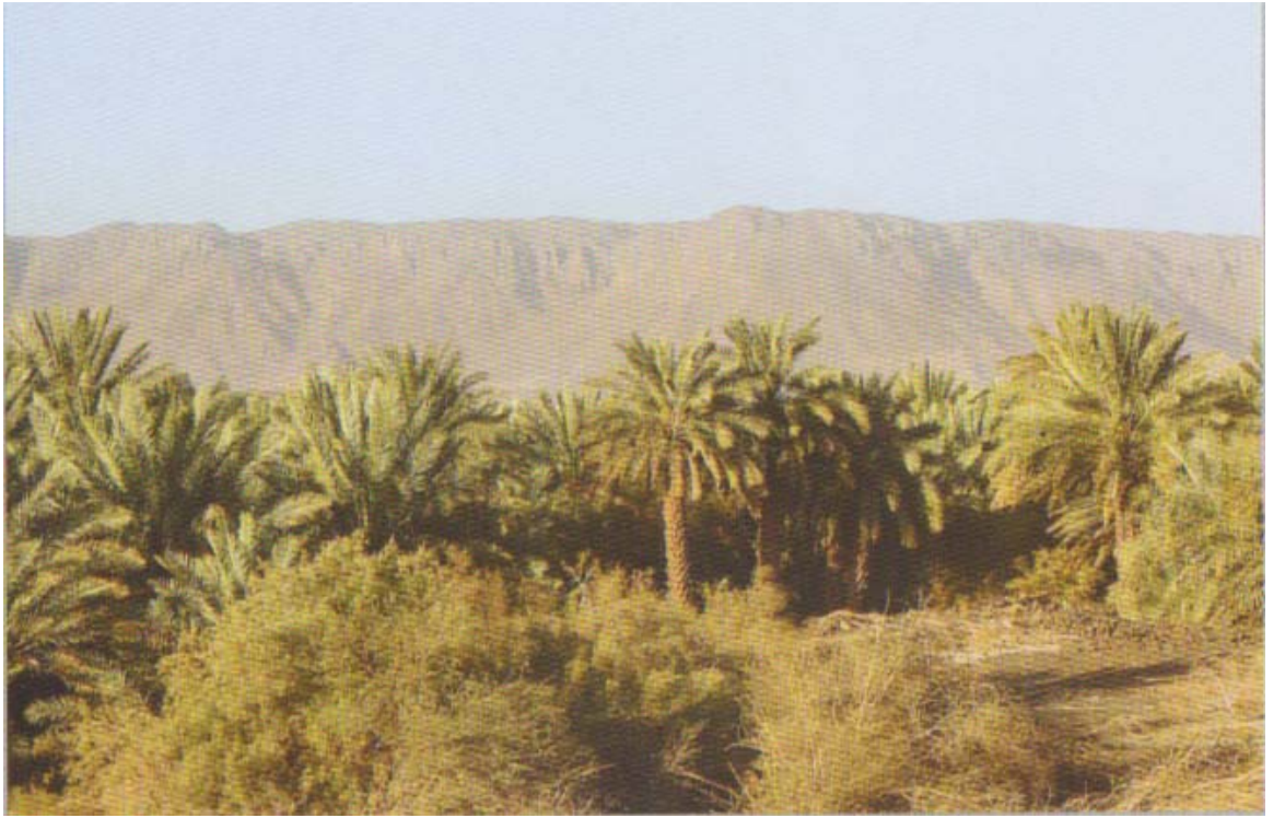
Benî Nâdir toprakları ( Küçükaşçı, Hicaz Albümü s. 151).