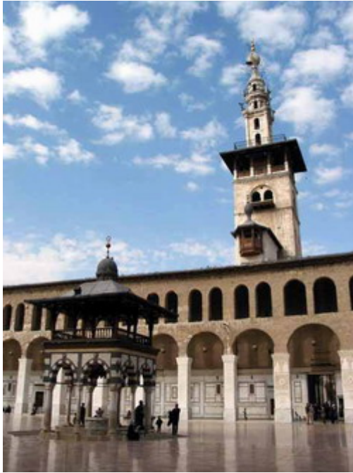
Resim 3: Şam Emeviye Camii ve Gazzali'ye İnzivası Süresince Mekan Olmuş Minaresi

Gazzali'nin yaşamı, bize inziva düşüncesinin insan hayatında ortaya çıkışında ve sonrasında meydana getirebileceği değişiklikleri net bir şekilde gösterdiğinden ötürü önemlidir.