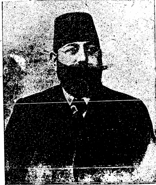
سیواس والیسی رشید پاشا Réchid pacha, gouverneur general de Sivas.