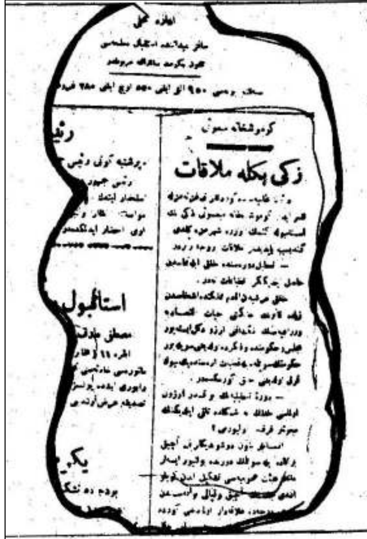
Kaynak: Mısıroğlu, 1995:141