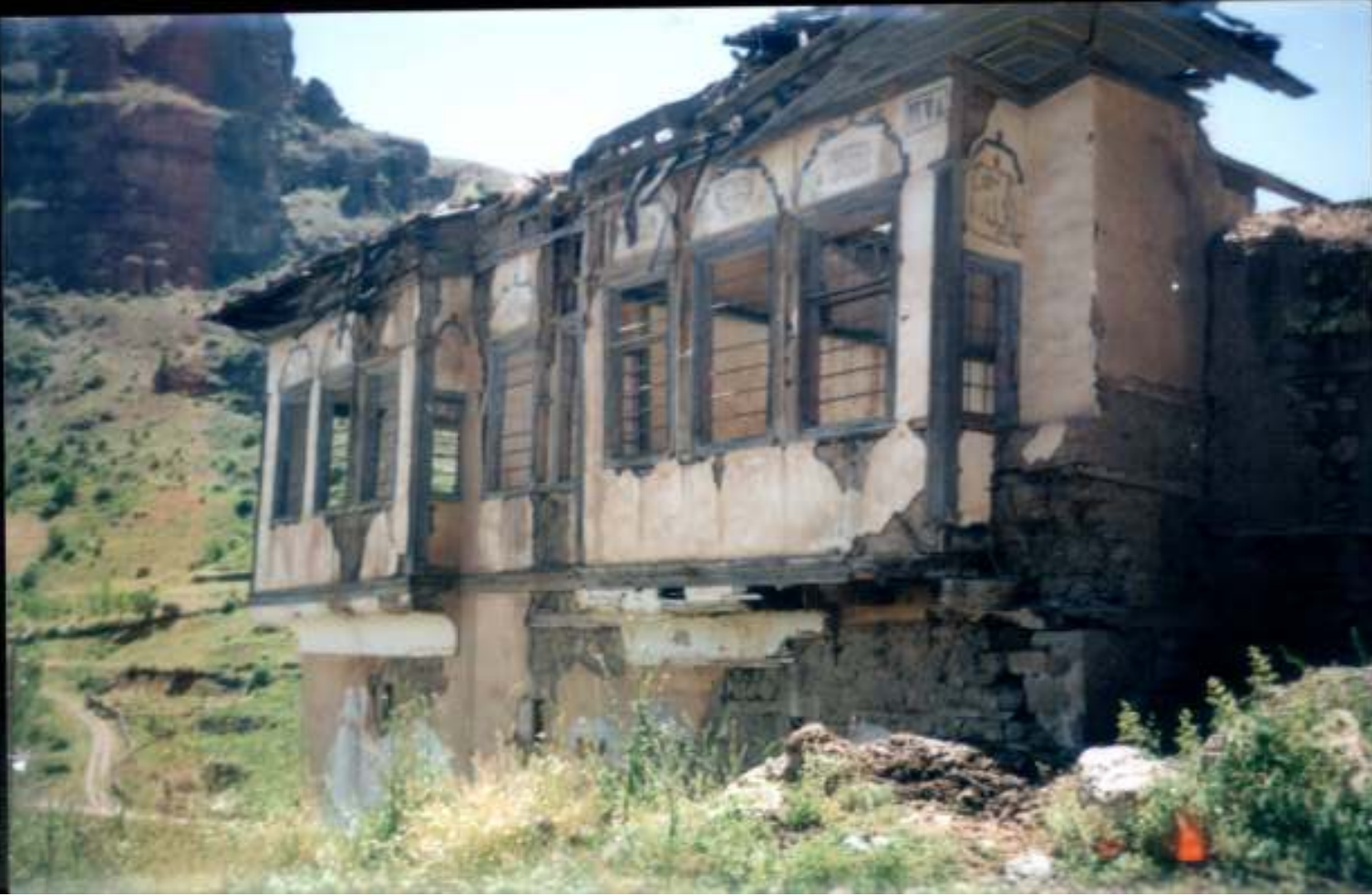
Zeki Bey ve babası İbrahim Lütü Paşa'nın İstanbul'a yerleşmesi ve uzun yıllar kullanılmaması nedeniyle bakımsız kalan ve yıkılmaya yüz tutmuş bir halde bulunan Kadirbeyoğlu ailesine ait Gümüşhane'deki ev.