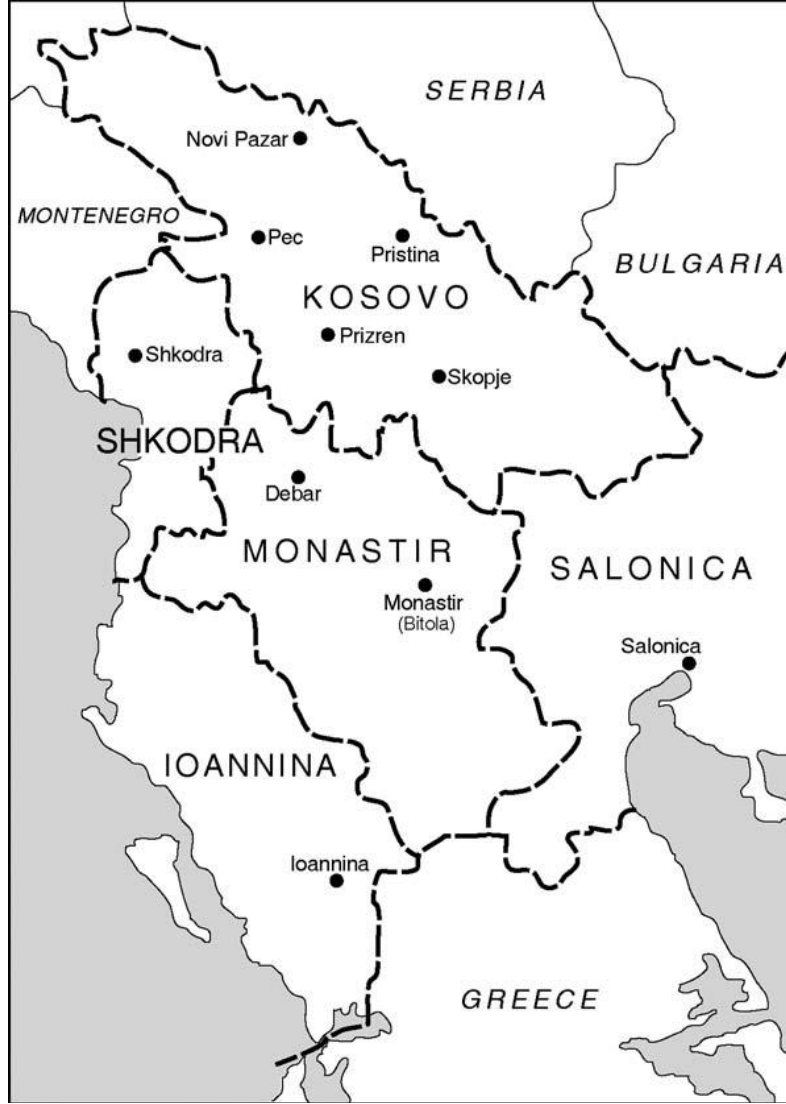
Harita 1: 19. Yüzyıl sonunda Osmanlı'nın Balkan Vilayetlerini (Manastır, Kosova ve İşkodra) Gösteren Harita.