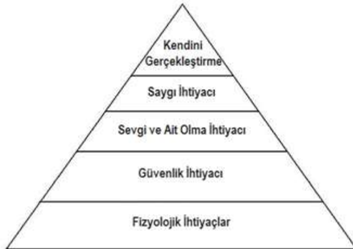
Şekil 3: Maslow' un İhtiyaçlar Hiyerarşisi

Motivasyon alanında öncü çalışmaları gerçekleştiren isimler arasından önde gelenlerden biri Abraham H. Maslow'dur. Maslow, bireylerin gereksinimlerine yönelik olarak yazmış olduğu bir çalışmada bireylerin gereksinimleri beş grup halinde sınıflandırmıştır. Bu gereksinimler kendi içlerinde bir hiyerarşiye sahiptir ve en alt sırada yer alan başat gereksinimin tatmin edilmesinden sonra bireyin diğer üst aşamalardaki gereksinimlerini giderme ihtiyacı duyduğu belirtilmiştir.