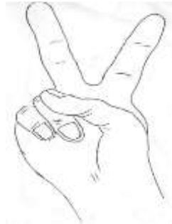
Şekil 2: Yavrukurt Selamı (URL5)

Sağ el kullanılarak selam edilir. Sağ elin başparmağı yüzük parmağının üstüne konulur, küçük parmak bükülür, işaret parmağı ve orta parmak gerilmiş ve açık biçimde viziye kenarına konulur. Baş selam verilecek yere döndürülür.