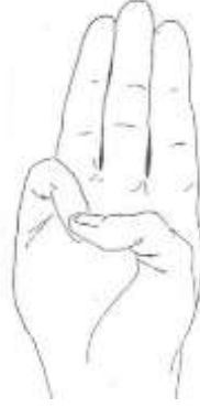
Şekil 1: İzci Selamı (URL5)

Sağ elin başparmağı küçük parmağın üstüne konulur, diğer parmaklar birleşik ve gerilmiş biçimde tutulur, el şapkanın kenarına götürülür, baş selam verilecek yöne döndürülür.