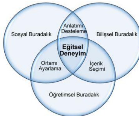
Şekil 3. Sorgulama topluluğu modeli