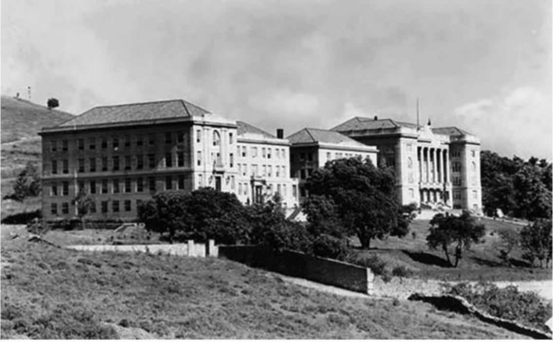
Robert Kolej 1920

( https://www.eskiistanbul.net/4736/robert-kolej-1920 “E.T. 25/05/2024”)