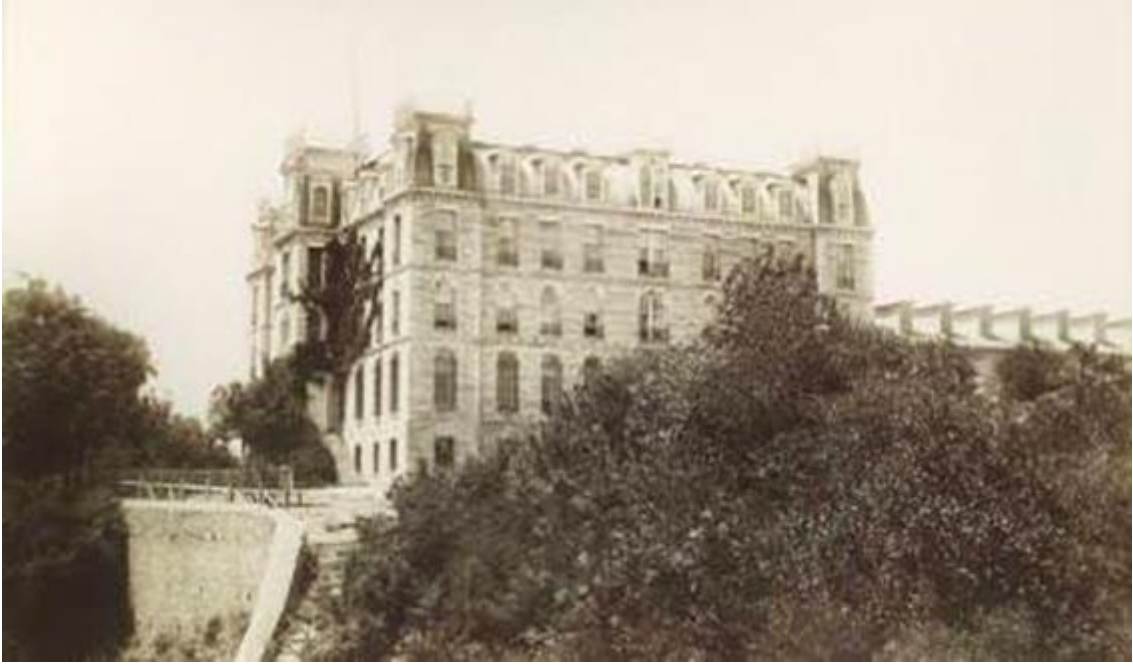
Robert Kolej Hamlin Hall Binası