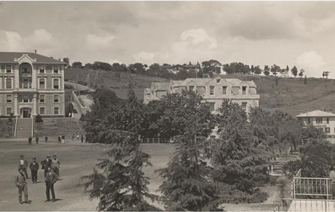
Robert Kolej ve Amerikan Kız Koleji Binası

( https://www.eskiistanbul.net/tag/robert-kolej/ “E.T. 25/05/2024”)