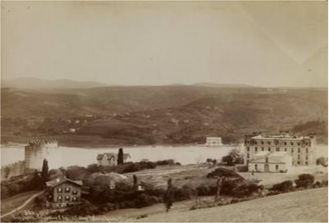
Robert Kolej ve Rumelihisarı / Sébah ve Joaillier Fotoğrafi / 1890'lar

( https://www.eskiistanbul.net/4736/robert-kolej-1920 “E.T. 25/05/2024”)