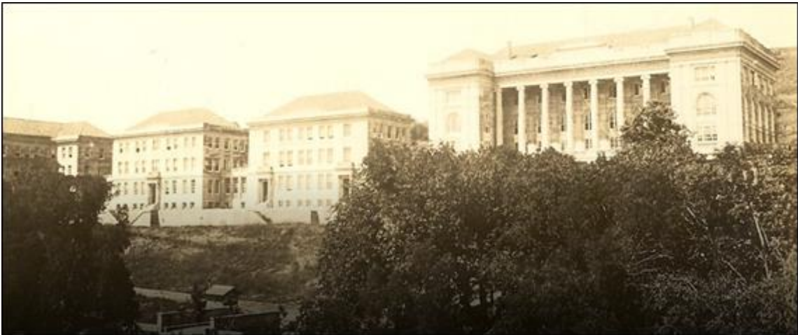
Robert Kolej Binası