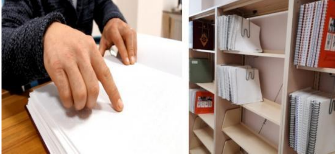
Görsel 21: Engelsiz Kütüphane Hizmetlerine Bir Örnek