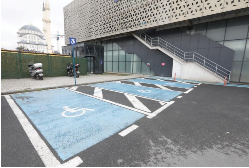
Görsel 16: Engelliler İçin Oluşturulmuş Otoparklara Bir Örnek