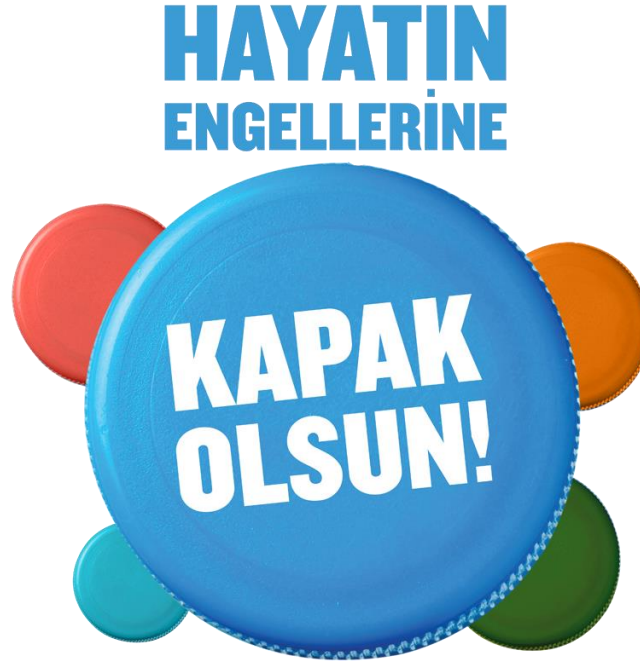
Görsel 6: "Hayatın Engellerine Kapak Olsun" Kampanyası Logosu

Örneğin; ortopedik engelli bireylerin tek başlarına hareket etmelerini, özgürce gezebilmelerini ve yaşadıkları dünyayı keşfedebilmelerini sağlayabilmek amacı taşıyan Türkiye Omurilik Felçlileri Derneğinin 2011 yılından bu yana yürütmekte olduğu plastik kapak kampanyası ile vatandaşlar; içtikleri su şişelerinin, damacanelerinin, zeytinyağlarının, meşrubatların kapaklarını atmak yerine biriktirerek derneğe başvurusu bulunan ihtiyaç sahibi ortopedik engelli bireyler için gerekli tekerlekli sandalye, akülü sandalye ve diğer medikal malzemelerin temin edilmesine yardımcı olabilmektedir (TOFD, 2022).