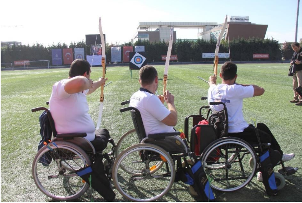
Görsel 18: Okçuluk Sporü ve Engelli Sporcular