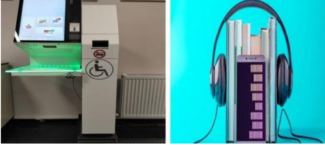
Görsel 20: Engelsiz Kütüphane Hizmetlerine Bir Örnek

olursa olsun, yeteneklerini en iyi şekilde geliştirebilecekleri eğitim hizmetlerinden eşit olarak yararlanabilmelerini sağlamak yürütülen sosyal sorumluluk projelerinden biridir (Engelsiz Kütüphane, 2022).