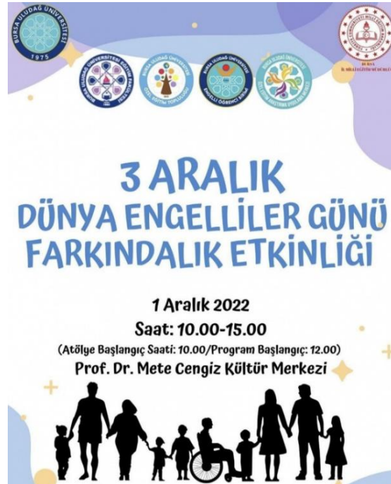
Görsel 2: Dünya Engelliler Günü Etkinliklerine Bir Örnek

Dünya Engelliler Günü, 1992'den beri Birleşmiş Milletler tarafından 3 Aralık'ta kutlanan uluslararası bir farkındalık günüdür.