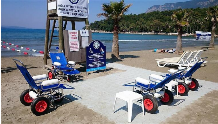
Görsel 17: Muğla Büyükşehir Belediyesine Ait Engelli Plaj Sandalyesi Hizmeti

Turizm faaliyetlerine erişilebilirlik, engelli bireylerin karşılaştıkları bir diğer önemli sorundur. “Erişilebilir turizm” ve “engelsiz turizm” gibi terimlerle ifade edilen proje ve uygulamalar ile engellilerin turizm faaliyetlerine katılımının sağlanması ve artırılması hedeflenmektedir (Subaşı, 2023, s. 68-69).