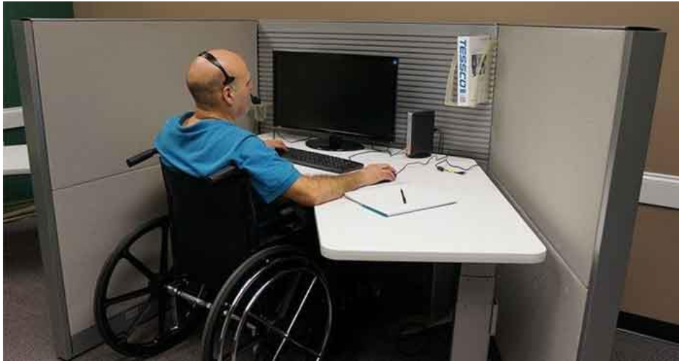
Görsel 8: Engellilerin İstihdamına Yönelik Bir Örnek

Ülkemizde ilk olarak 1967 yılında Deniz İş Kanunu ile, daha sonra ise 1971’de kabul edilen 1475 sayılı İş Kanunu ile engelli bireylerin çalışma yaşamında aktif rol oynayabilmelerine olanak tanıyan kota uygulaması yürürlüğe girmiştir. Kota uygulaması halen yürürlükte olan 4857 sayılı İş Kanunu’nda ve 854 sayılı Deniz İş Kanunu’nda ve emniyet mensupları için 3201 sayılı Emniyet Teşkilatı Kanunu’nda bulunmakta ve engelli kotasına ilişkin sorumluluklarını yerine getirmeyen işverenlere para cezası uygulanması yer almaktadır. İlgili yasalara göre, 50 ve daha fazla çalışanı olan özel sektör işyerleri yüzde 3’ünü, kamu işyerleri yüzde 4’ünü engelli bireylerden istihdam etmek zorundadır (Güloğlu, 2021, s. 204).