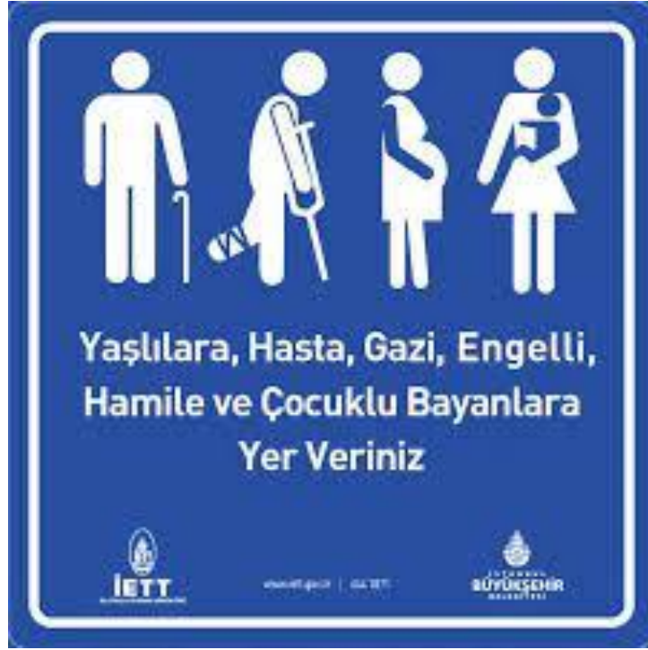
Görsel 4: İETT'ye Ait Bir Uyarı Tabelası

Örneğin Ankara Büyükşehir Belediyesi Ego Genel Müdürlüğü Raylı Sistem Yolcu Taşıma Yönergesi Madde 6. 30. Fıkra şu şekildedir: “Engelli vatandaşlara, yaşlılara, hamile ya da bebekli bayanlara yer verilir; inerken ve binerken öncelik tanınır.”