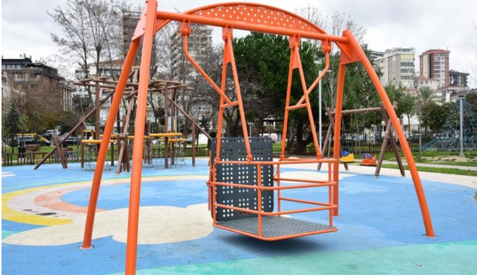
Görsel 14: Engelliler İçin Tasarlanan Bir Salıncak