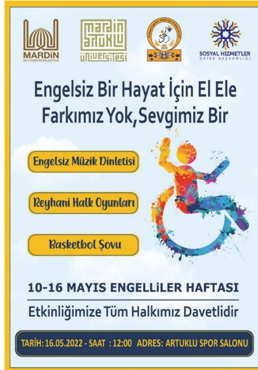
Görsel 1: Engelliler Haftası İçin Düzenlenen Etkinliklere Bir Örnek

... Bu bilinçle bizler de temel hedefimizi, engelli ya da engelsiz her bir kişinin, bu toplumun refahı için üretebilmesi, hayata aktif, eşit, doğal ve tam katılımını sağlayabilmesi olarak belirledik... Bu duygularla engelliler haftasını kutluyor, dayanışma içinde, umut ve sevgi dolu bir hayat temenni ediyorum.” (ASHB, 2022).