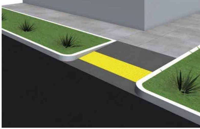
Görsel 9: Açık Alan Erişilebilirlik Uygulaması Örneği

engelliler için erişilebilir duruma getirilir.” hükmü ile engelli bireylerin erişilebilirlik hakları konusunda yerel yönetimlere sorumluluk verilmiştir.