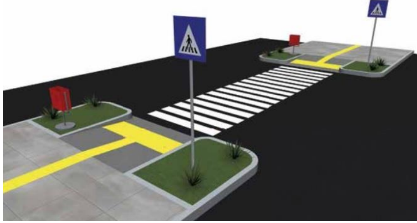
Görsel 11: Görme Engellilere Yönelik Hissedilebilir Yüzey Uygulaması

öğrencilerin bir arada ders çalışacağı ve eğitim alacağı binalar tasarlanmalı, resmi binalar gibi kamu kullanımına açık tüm binalarda her türden engelli bireye yönelik olanaklar sağlanmalıdır (Sümer, 2015, s. 147).