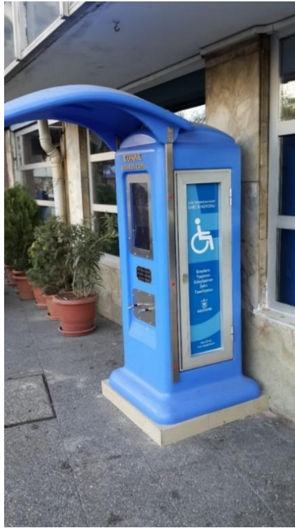
Görsel 12: Konak Belediyesine Ait Akülü Engelli Arabaları İçin Şarj İstasyonu

Dünyanın pek çok ülkesi ile birlikte bizim ülkemizde de kentselin barındırdığı engellerin kaldırılması noktasında önemli gelişmeler ve birikimler gerçekleşmiştir. Engelli bireylerin şehir içinde daha aktif ve özgür olmalarını sağlamaya yönelik yollar, kaldırımlar, park yerleri, asansörler, ulaşım araçları, engelli geçitleri, şehrin ulaşılabilir yerlerinde engelli akülü araç şarj istasyonları vb. uygulamalar giderek yaygınlaşmaktadır.