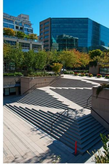
Görsel 13: Engellilere Yönelik Açık Alan Erişilebilirlik Hizmeti