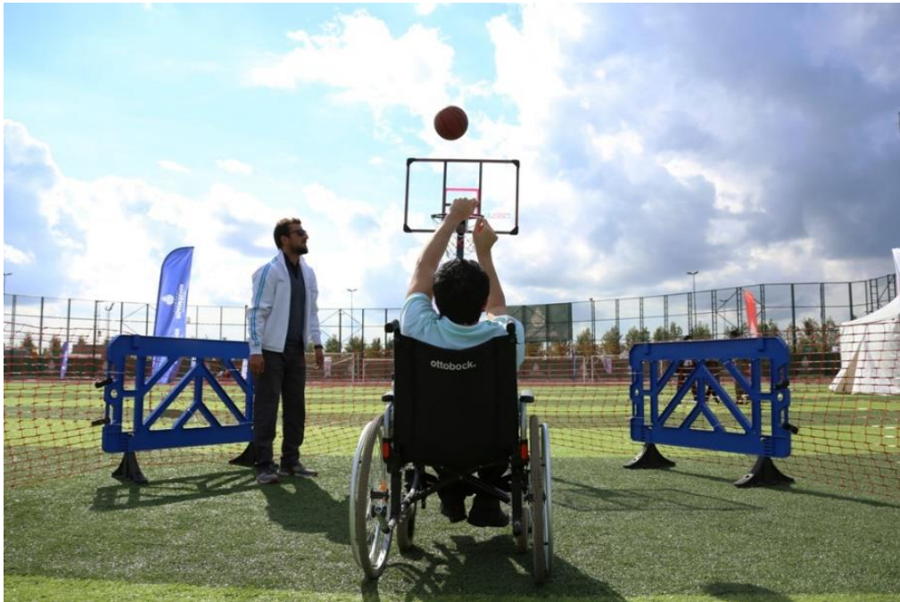
Görsel 19: Basketbol Oynayan Bir Engelli Sporcu