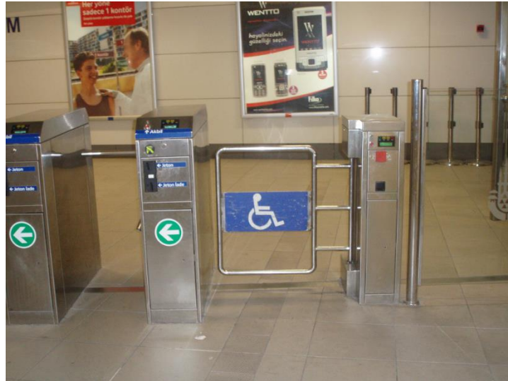
Görsel 10: Metro İstasyonlarında Erişilebilirlik Uygulamalarına Bir Örnek

Birleşmiş Milletler Genel Kurulu tarafından 13 Aralık 2006 tarihinde kabul edilen, 30 Mart 2007 tarihinde imzaya açılan ve ülkemizin 80 ülke ile imzaladığı Engellilerin Haklarına Dair Sözleşme'nin 9. maddesinde erişilebilirliğe ilişkin tüm yükümlülükler yer almaktadır (EYGHM, 2011).