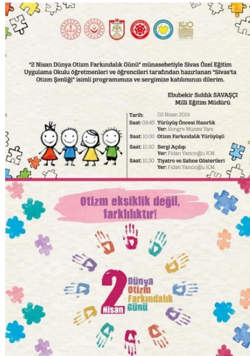
Görsel 3: Otizm Farkındalık Günü İçin Düzenlenen Etkinliklere Bir Örnek

2 Nisan 2008 yılında Birleşmiş Milletler tarafından otizm konusunda farkındalık yaratmak ve otizmle ilgili sorunlara çözüm aramak amacıyla "Dünya Otizm Farkındalık Günü" ilan edilmiştir.