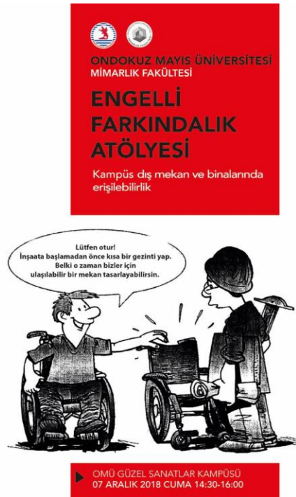
Görsel 5: Farkındalık Çalışmalarına Bir Örnek

Yakın zamanda kapsamını genişleten ESHA, yetişkinlere yönelik sunumlarla din adamlarına, üniversite öğrencilerine, taksi şoförlerine ve İETT çalışanlarına engelliliği anlatarak toplumda farkındalık yaratmayı hedeflemektedir (İBB, 2000).