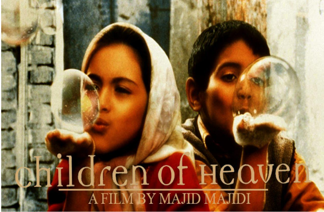
Cennetin Çocukları (Children Of Heaven) Filminin Afişİ