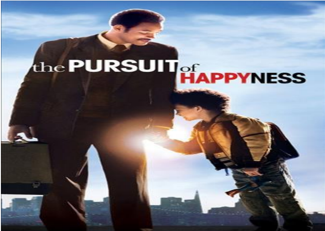
Umudunu Kaybetme (The Pursuit Of Happyness) Filminin Afiři