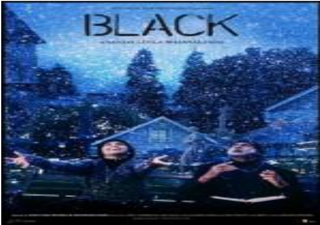
Siyah (Black) Filminin Afişİ