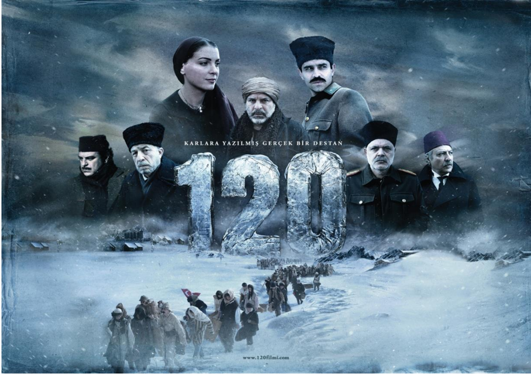
120 Filminin Afiŝi