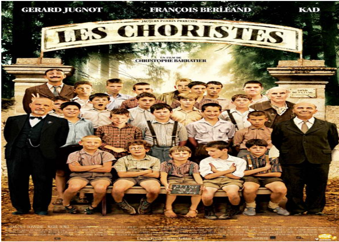
Koro (Les Choristes) Filminin Afışı