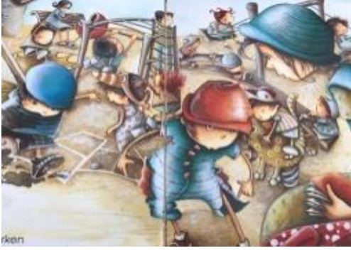
Resim 20. Temizlik değeri görseli

Resim 20 incelendiğinde yırtılan pantolonunu fark edip annesine gösteren çocuk resmedilmiştir. Bu görsel ile temizlik değerine vurgu yapılmaktadır.