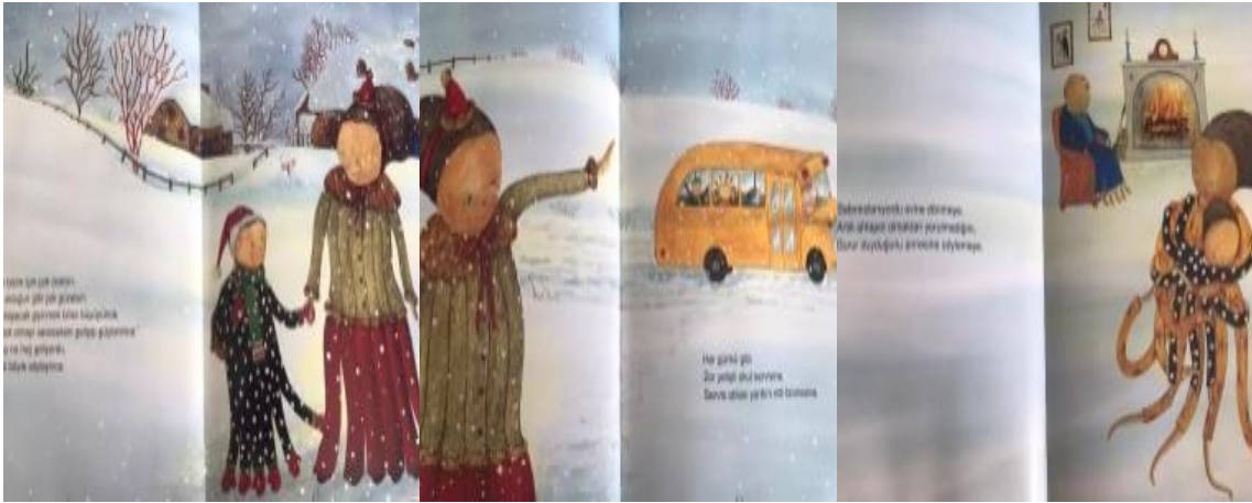
Resim 1. Sevgi değeri görselleri

Ayrıca kitabın görsellerinde “ sevgi(3), yardımseverlik(3), mutluluk (1), merhamet (1) ve özgürlük (1)” değerleri tespit edilmiştir.Konuyla ilgili örnekler aşağıda sunulmuştur.