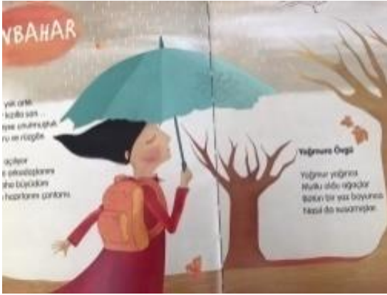
Resim 30. Özgüven değeri görseli

Resim 29 incelendiğinde; Birlikte keyifli vakit geçiren iki çocuk resmedilmiştir. Bu görselle dostluk değeri verilmiştir.