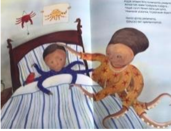
Resim 4. Merhamet değeri görseli

Resim 4 incelendiğinde annesi tarafından uyandırılan ahtapot resminde merhamet değeri verilmek istenmiştir denilebilir.