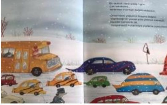
Resim 6. Sabırlı olma becerisine vurgu

Ayrıca kitabın görsellerinde “ sabırlı olma(1), doğru karar verme(1)becerileri tespit edilmiştir. Konuyla ilgili örnekler aşağıda sunulmuştur.