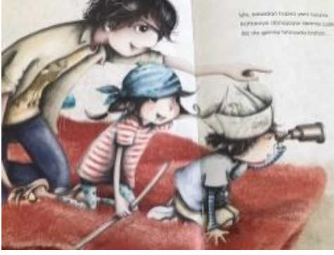
Resim 41. Estetik değeri görseli

Resim 41 incelendiğinde; Yaptıkları işe hayran bir şekilde bakan baba ve çocukları resmedilmiştir. Bu görselle estetik değeri verilmiştir.