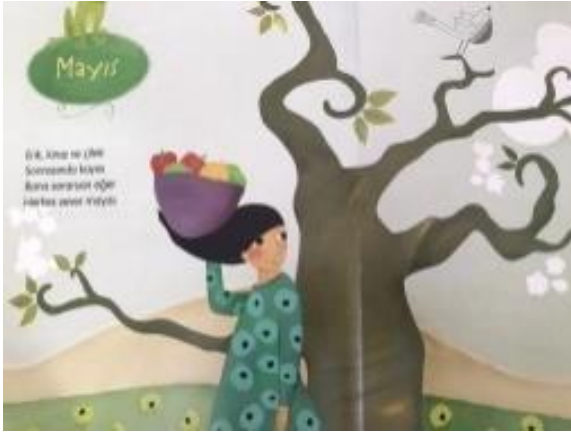
Resim 28. Sorumluluk değeri görseli

Resim 27 incelendiğinde Yaptığı çalışmadan memnun kalan çocuk ve hayretle rüzgârı dinlemeye çalışan çocuk resmedilmiştir. Estetik değeri ele alınmış denilebilir.