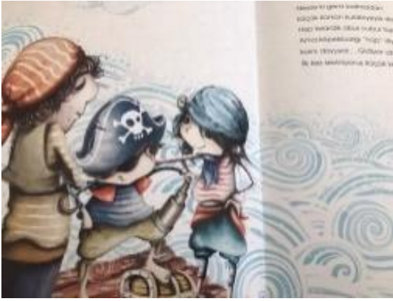
Resim 42. Özgüven değeri görseli

Resim 41 incelendiğinde; Yaptıkları işe hayran bir şekilde bakan baba ve çocukları resmedilmiştir. Bu görselle estetik değeri verilmiştir.