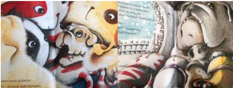
Resim 33. Sevgi değeri görseli

Resim 32 incelendiğinde; Üşüyen yavru köpeğe sarılan kediler resmedilmiştir. Bu görsellerle merhamet değeri ele alınmıştır.