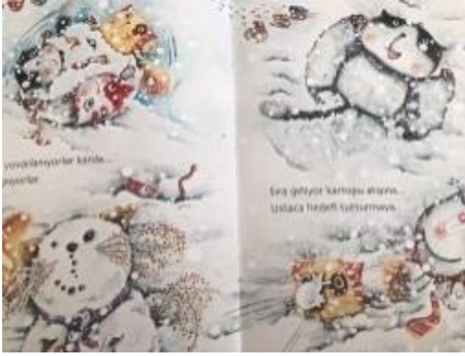
Resim 37. İşbirliği becerisi görseli

Resim 37 de Birlik içerisinde ürün ortaya çıkaran kediler resmedilmiştir. Okul öncesi dönem çocukları için iş birliği becerisi kazandırılmak amaçlanmıştır