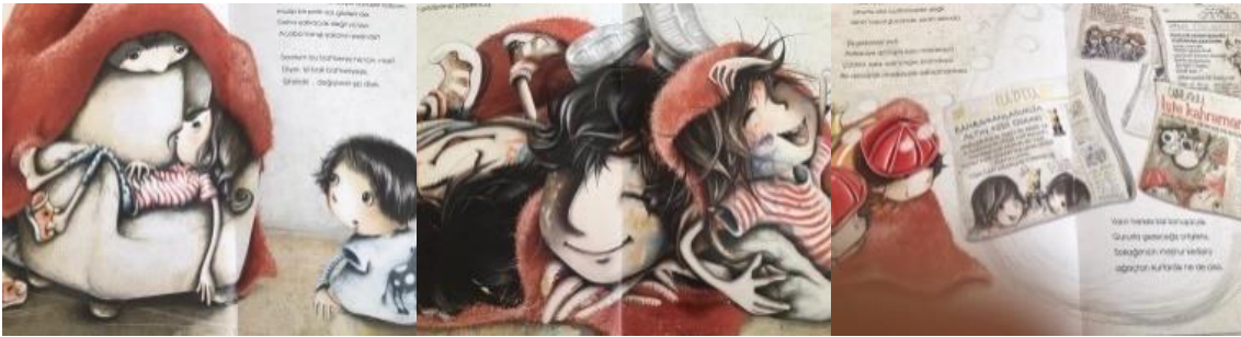
Resim 38. Mutluluk değeri görselleri

Ayrıca kitabın görsellerinde “ mutluluk(3), yardımseverlik (2), aile birliğine önem (1) ve estetik (1).özgüven (1)” değerleri tespit edilmiştir. Konuyla ilgili örnekler aşağıda sunulmuştur.