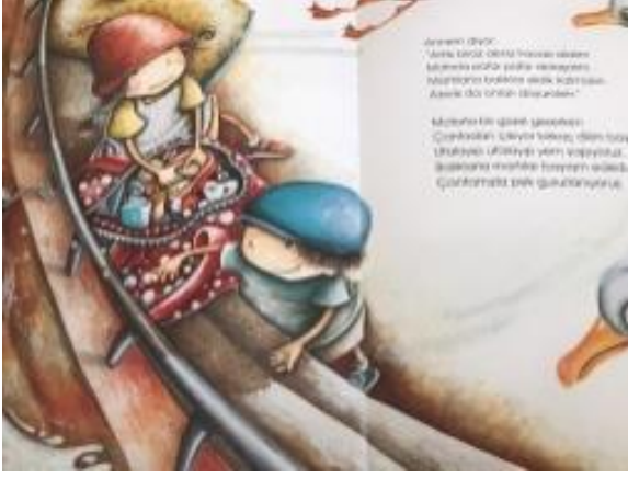
Resim 24. Paylaşma becerisine vurgu

Resim 24 de ekmeğini hayvanlarla paylaşan çocuklar okul öncesi dönem çocukları için paylaşma becerisine vurgu yapmaktadır.