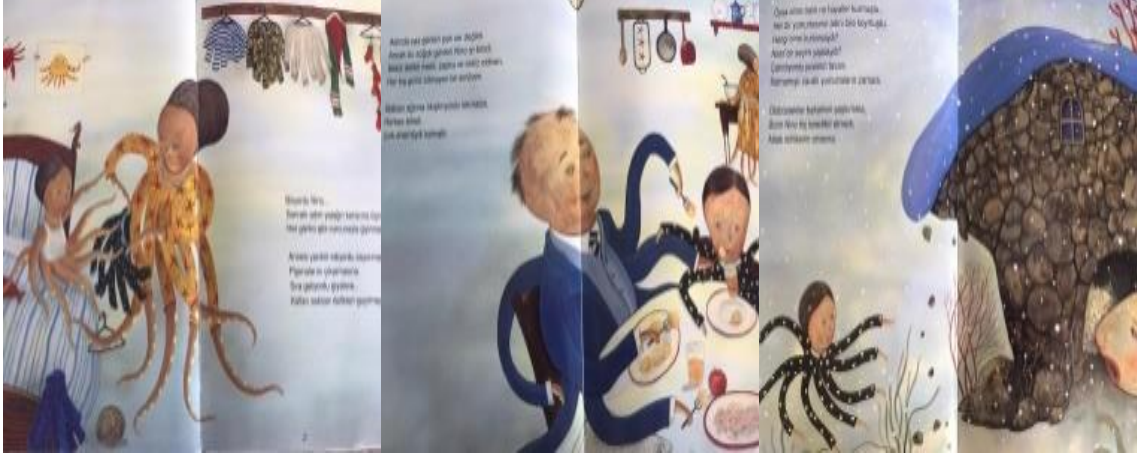
Resim 2.Yardımseverlik değeri görselleri

ahtapot ve Mutluluğunu annesine sarılarak paylaşan ahtapot resmedilmiştir. Bu görsellerle sevgi değeri ele alınmıştır.