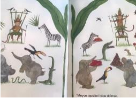
Resim 13. Mutluluk değeri görseli

Resim 12 de birlikte oynayan hayvanlar resmedilmiştir. Bu görselle dostluk değerine vurgu yapılmıştır.