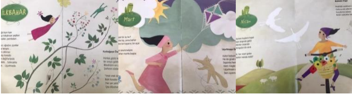
Resim 25. Mutluluk değeri görselleri

Ayrıca kitabın görsellerinde “ mutluluk(6), sorumluluk(1), estetik(1), dostluk (1) ve özgüven (1)” değerleri tespit edilmiştir. Konuyla ilgili örnekler aşağıda sunulmuştur.