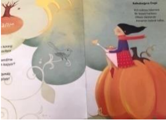
Resim 31.Yardımseverlik değeri görseli

Resim 31 incelendiğinde; Tabağındaki yemeği kuşla paylaşan çocuk resmedilmiştir. Bu görselle Yardımseverlik değeri verilmektedir.