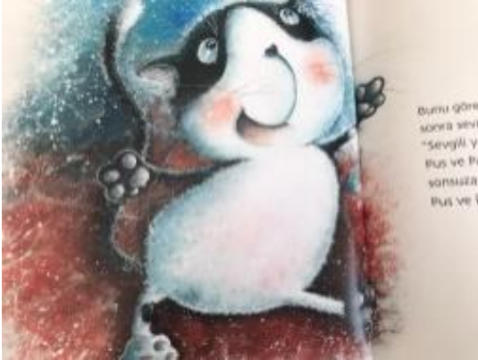
Resim 16. Mutluluk değeri görseli

Resim 15 incelendiğinde Gökyüzünde gerçekleşen olaya hayranlıkla bakan kediler ve Gökyüzünde gerçekleşen duruma karşı şaşkın kediler resmedilmiştir. Bu görsellerle estetik değeri vurgulanmıştır.