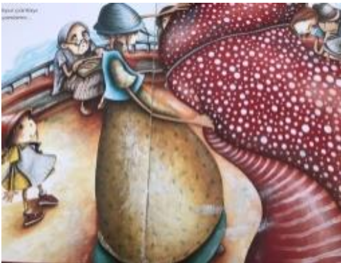
Resim 22. Sorumluluk değeri görseli

Resim 21 incelendiğinde çocukların kedileri beslediği görülmektedir. Bu görselle yardımseverlik değeri üzerinde durulduğu söylenebilir.