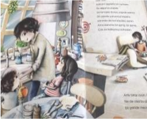
Resim 40. Aile birliğine önem değeri görseli

Resim 39 incelendiğinde; Baba ve çocuğun yardımlaşarak diğer çocuğu battaniyede sallaması, Üç kedinin yavru bir kediye kurtarma çabası, Koşarak yardıma giden baba ve çocukları resmedilmiştir. Görseller ile verilmek istenen değerin yardımseverlik olduğu söylenebilir.