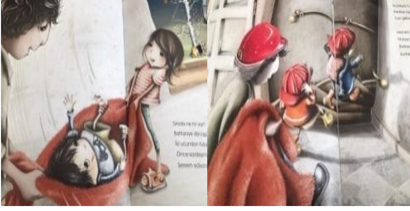
Resim 39. Yardımseverlik değeri görselleri

Resim 39 incelendiğinde; Baba ve çocuğun yardımlaşarak diğer çocuğu battaniyede sallaması, Üç kedinin yavru bir kediye kurtarma çabası, Koşarak yardıma giden baba ve çocukları resmedilmiştir. Görseller ile verilmek istenen değerin yardımseverlik olduğu söylenebilir.