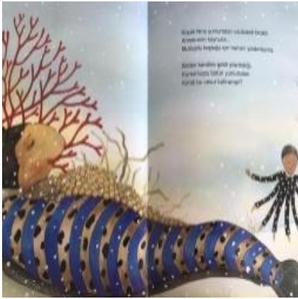
Resim 3.Mutluluk değeri görseli

Resim 2 incelendiğinde yavru ahtapotun giyinmesine yardım eden baba ahtapot, Yavru ahtapotun kahvaltısına yardım eden baba ahtapot ve Evi yıkılmak üzere olan anne yılanı yardıma koşan yavru ahtapot resmedilmiştir. Bu görsellerle yardımseverlik değeri üzerinde durulmuştur.