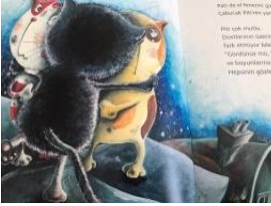
Resim 17. Sevgi değeri görseli

Resim 17 incelendiğinde Birbirlerini çok seven arkadaşların duygusal sarılmalarının resmedildiği ve bununla sevgi değerine vurgu yapıldığı görülmektedir.