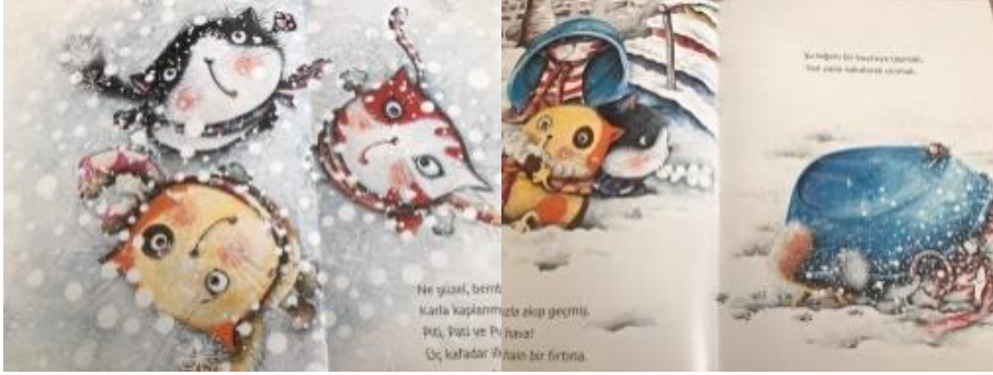
Resim 34. Estetik değeri görseli

Resim 33 incelendiğinde; Neşe ile birbirine sarılan, sevgiyle birbirine bakan ve şefkatle kedilere ve yavrularına sarılan köpek resmedilmiştir. Bu görsellerle sevgi değeri üzerinde durulmuştur.