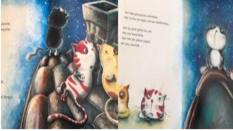
Resim 18. Sabırlı olma becerisi görseli

Resim 18 de Vazgeçmeden yıldızın kaymasını bekleyen bir kedi resmedilmiştir. Okul öncesi dönem çocukları için sabırlı olma becerisi vurgulanmaktadır.