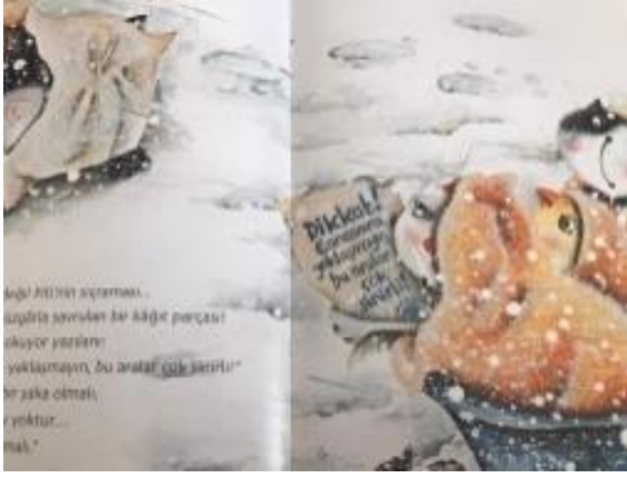
Resim 36. Cesaret değeri görseli

Resim 36 incelendiğinde; Korkulacak duruma karşı sakin olma durumu resmedilmiş ve cesaret değerine vurgu yapılmıştır.