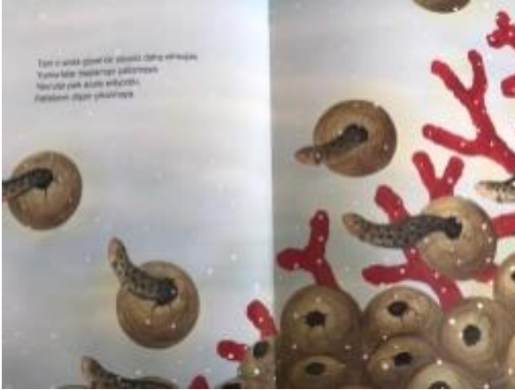
Resim 5. Özgürlük değeri görseli

Resim 4 incelendiğinde annesi tarafından uyandırılan ahtapot resminde merhamet değeri verilmek istenmiştir denilebilir.