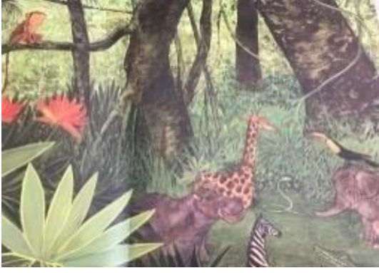
Resim 12. Dostluk değeri görseli

Resim 12 de birlikte oynayan hayvanlar resmedilmiştir. Bu görselle dostluk değerine vurgu yapılmıştır.