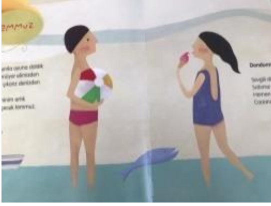
Resim 29. Dostluk değeri görseli

Resim 29 incelendiğinde; Birlikte keyifli vakit geçiren iki çocuk resmedilmiştir. Bu görselle dostluk değeri verilmiştir.