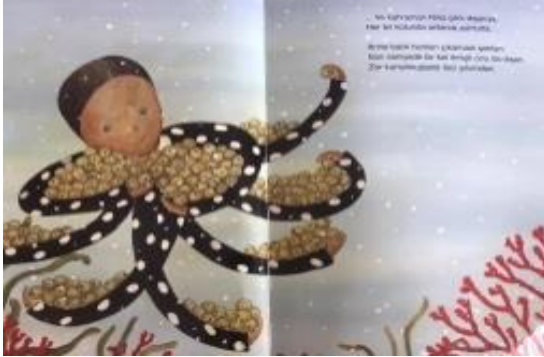
Resim 7. Karar verme becerisine vurgu

Resim 6 incelendiğinde Deniz sakinlerinin yaşadığı trafik sorununun resmedildiği ve bununla sabırlı olma becerisinin ele alındığı görülmektedir