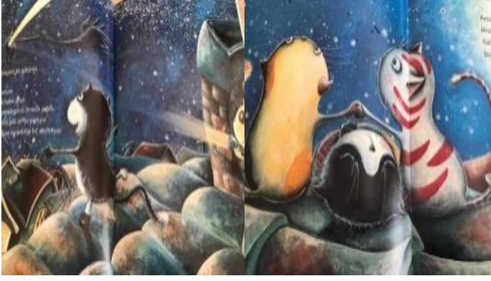
Resim 15. Estetik değeri görseli

Resim 15 incelendiğinde Gökyüzünde gerçekleşen olaya hayranlıkla bakan kediler ve Gökyüzünde gerçekleşen duruma karşı şaşkın kediler resmedilmiştir. Bu görsellerle estetik değeri vurgulanmıştır.