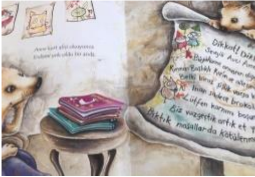
Resim 10.Cesaret değeri görseli

Resim 9 incelendiğinde Anne kurdun sorduğu soruyu bilen kurdun sevinmesi ve Gülen yüzlerle birbirine bakan hayvanlar resmedilmiştir.Bu görsellerle mutluluk değeri üzerine vurgu yapılmıştır.