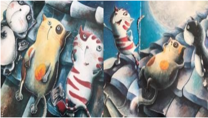
Resim 14.Dostluk değeri görseli

Ayrıca kitabın görsellerinde “ sevgi(2), temizlik (1), yardımseverlik(1), sorumluk (1) ve estetik (1)” değerleri tespit edilmiştir. Konuyla ilgili örnekler aşağıda sunulmuştur.