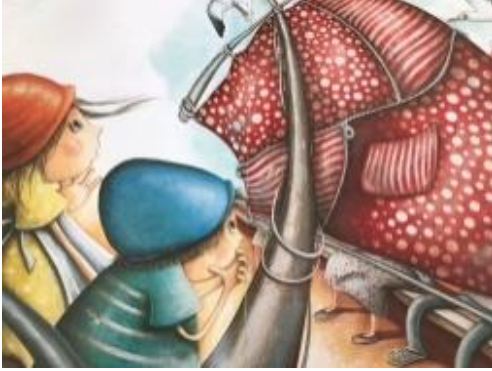
Resim 23. Estetik değeri görseli

Resim 22 incelendiğinde çantasını yırtıp gemiyi kurtaran anne resmedilmiştir.Bu görselle Sorumluluk değerine vurgu yapılmış denilenebilir.