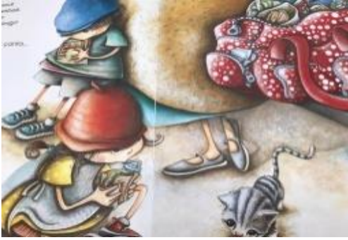
Resim 21. Yardımseverlik değeri görseli

Resim 20 incelendiğinde yırtılan pantolonunu fark edip annesine gösteren çocuk resmedilmiştir. Bu görsel ile temizlik değerine vurgu yapılmaktadır.