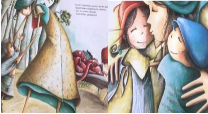
Resim 19. Sevgi değeri görseli

Ayrıca kitabın görsellerinde “ sevgi(2), temizlik (1), yardımseverlik(1), sorumluluk (1) ve estetik (1)” değerleri tespit edilmiştir. Konuyla ilgili örnekler aşağıda sunulmuştur. Resimlendirme çocukların duygu dünyalarına giden önemli bir yoldur. Okul öncesi dönem çocuğu için, gelişimi dolayısı ile somutlaştırma çok önemlidir.