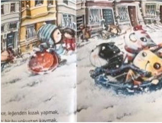
Resim 35. Dostluk değeri görseli

Resim 34 incelendiğinde; Manzaraya hayran ve şaşkın şekilde bakan resmedildiği görülmüş ve estetik değerin verilmek istendiği anlaşılmıştır.