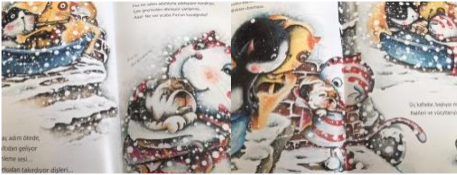
Resim 32.Merhamet değeri görseli

Aynı zamanda üüyen hayvanları klübesine götüren köpek ile sorumluluk (1) ele alınmıştır. Ayrıca kitabın görsellerinde “ merhamet(2), sevgi (2), estetik(2), dostluk (1) ve cesaret (1)” değerleri tespit edilmiştir. Konuyla ilgili örnekler aşağıda sunulmuştur.