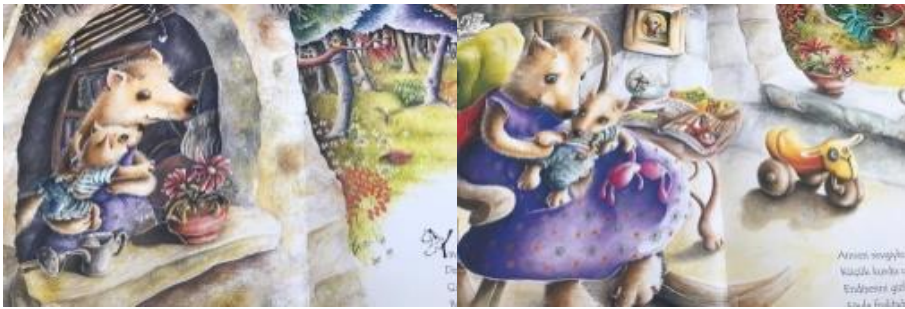
Resim 8. Sevgi değeri görseli

Ayrıca kitabın görsellerinde “ sevgi(2), mutluluk(2), cesaret(1) ” değerleri tespit edilmiştir. Konuyla ilgili örnekler aşağıda sunulmuştur.