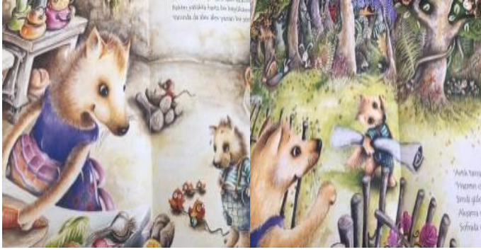
Resim 9.Mutluluk değeri görseli

Resim 9 incelendiğinde Anne kurdun sorduğu soruyu bilen kurdun sevinmesi ve Gülen yüzlerle birbirine bakan hayvanlar resmedilmiştir.Bu görsellerle mutluluk değeri üzerine vurgu yapılmıştır.