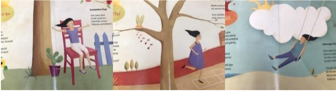
Resim 26. Mutluluk değeri görselleri

Resim 25 incelendiğinde;Sevinçle havaya doğru uçmak, Sevinçle uçurtma uçurmak, Sevinçle bisiklet sürmek,