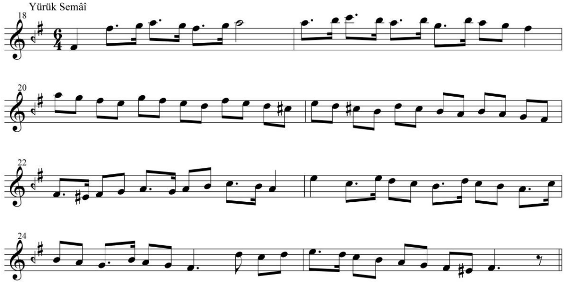
Görsel 31: Dilkeşhâverân Saz Semâisi Notası

Kaynak: Eser defterde 84-85 numaralı sayfalarda yer almaktadır, defterde 86 numaralı sayfa boş bulunmaktadır.