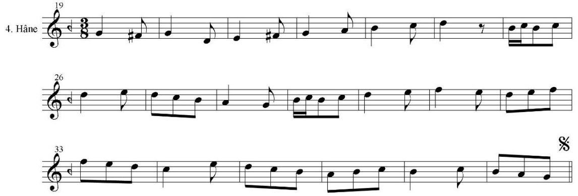
Görsel 112: Acem Tarab Saz Semâisi Notası

Kaynak: Eser defterde 291 numaralı sayfada yer almaktadır, defterde 292-293 numaralı sayfalar boş bulunmaktadır.