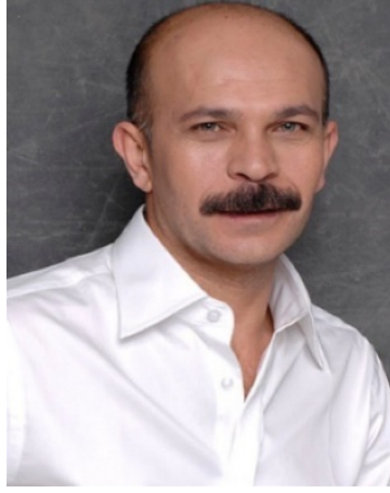
Fotoğraf 7: Entelköy Efeköy’e Karşı Filmi Oyuncularından Emin Gürsoy