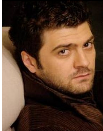
Fotoğraf 5: Entelköy Efeköy’e Karşı Filmi Oyuncularından Şahin Irmak

Kaynak: https://www.beyazperde.com/sanaticilar/sanatici-425877/ E.T. 07.06.2022