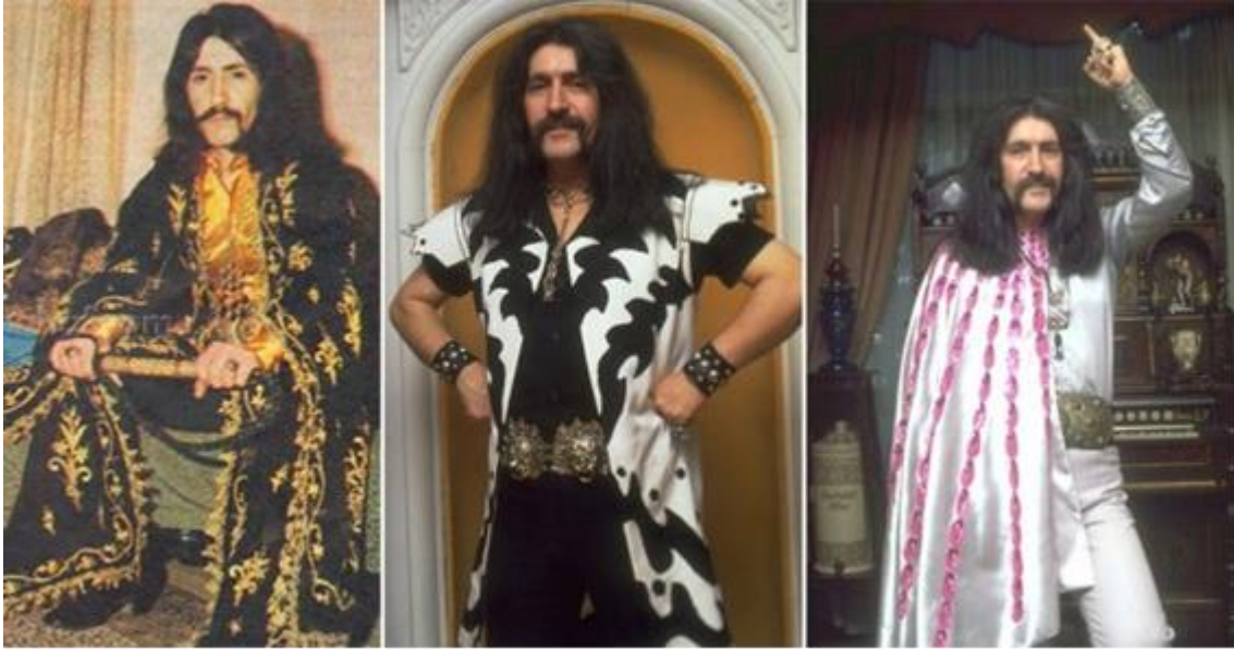
Fotoğraf 3: Barış Manço'nun Giyim Tarzını Yansıtan Sahne Kostümlerinden Örnekler

Barış Manço uzun saçlı, bıyıkları aşağı doğru uzanan bir görünüme sahiptir. Tesadüfen şekillenen bu görünüm onun tarzı olmuştur. Manço Hollanda'da bir trafik kazası geçirmiştir. Bu kaza sonucunda yüzünün bazı bölgelerinde kalıcı çizikler oluşmuştur. Manço bu çizikleri kapatmak amacıyla bıyık bırakmıştır. Daha sonra bıyığı ile orantılı olacak şekilde saçlarını da aynı oranda uzatmıştır. Uzun saç ve bıyıkları, giydiği takım elbise ile uyumsuz hale gelince, Manço, kıyafetlerini de saçına uygun olacak şekilde saçaklı, püsküllü, salaş olarak nitelendirilen bir tarzla birleştirmiştir. Bu tesadüfler sonucunda Manço'nun sanatçı olarak tarzı oluşmuştur (Tunca, 2005, 26).