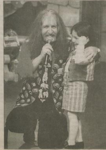
7'den 77'de şarkılarındaki gibi basit ama etkileyici dil kullanıyordu.