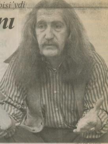
Barış Manço, yarım Levent Camii'ndeki öğle namazından sonra uğurlanacak.

"Bu kadar çok yöne dağılan Manço'nun yaşamında müzik ikinci plana düşmüştü, beste üretmek için fazla vakit yoktu. Dünyanın çeşitli yerlerinde verdiği konuşlere devam ediyordu, ama yenilik yoktu müziğinde. 1994 sonunda çıkan Müsaadenizle Çocuklar'ın kalitesi eski yapıtlarının çok gerisine düşmüş ve bir-iki parça dışında ses getirememişti albüm. Ancak eski yapıtları kaldı düzenli şekilde satıyor ve Barış Manço her türlü eleştiriyi karış 40 yılı aşkın bir süre aynı çizgide kalıyordu. Bir söyleşide bu konudaki sorumuza uzun uzun şöyle yanıtlamıştı: "Üretimde bana göre sadelik şart. Müzikal tarafım her şeyi yapılabiliye hastan be-risi biverim, müzikal kariyerim yok, oturup hocadan ders almış-gim yok. Almadığım için de birtakım müzik adamlarıyla tartışma-yacağım. Ancak tevaaz göstermi-yorum. Ben o 12 notaya 250 beste sığdırdım, hiçbirini birbirine benzemiyorum. Barış Manço müziği hemen anlaşılıyor. Ben malum pazara çık-karıyorum, insanlara sunuyorum, onlar karar veriyor. Aslında plak sat-tırlarım öyle alım şahum değil. Ver-riken rakamlara göre, bu şahum kadar daha yarım milyon satış gör-medim. İstedim 2000'li yıllara gı-